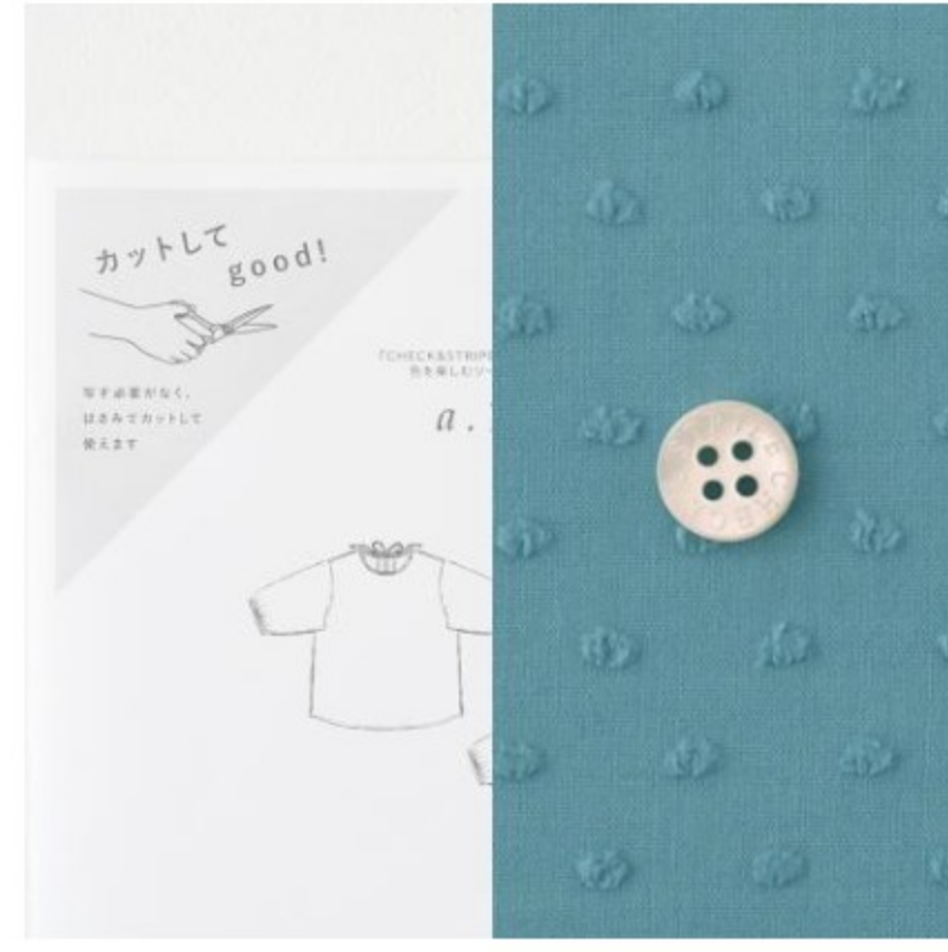
フォゲットミーノット