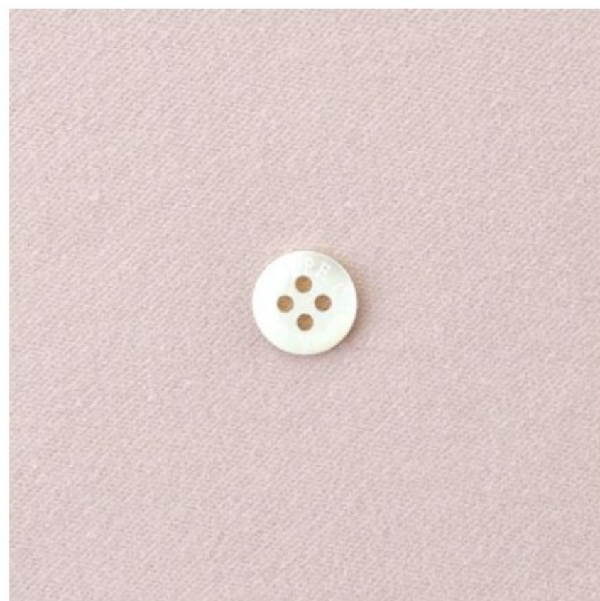
グレイッシュピンク