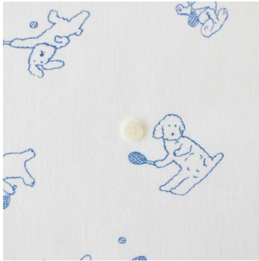
ホワイトにブルー