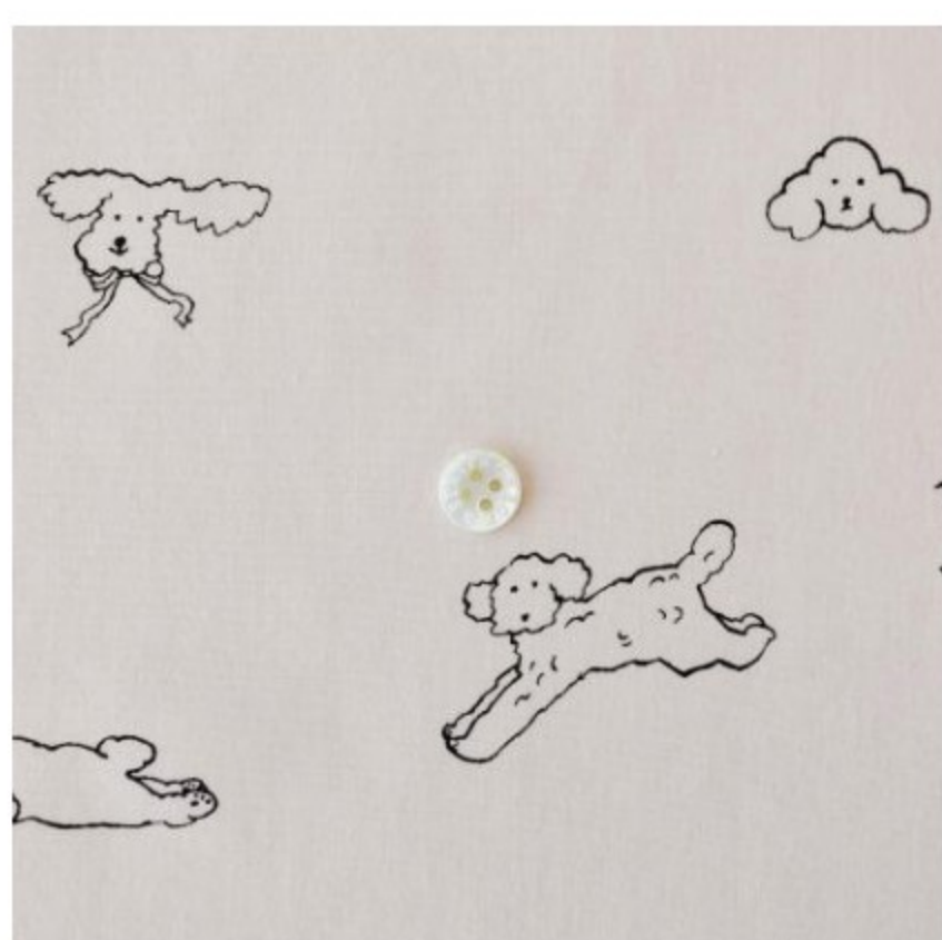
グレイッシュピンク