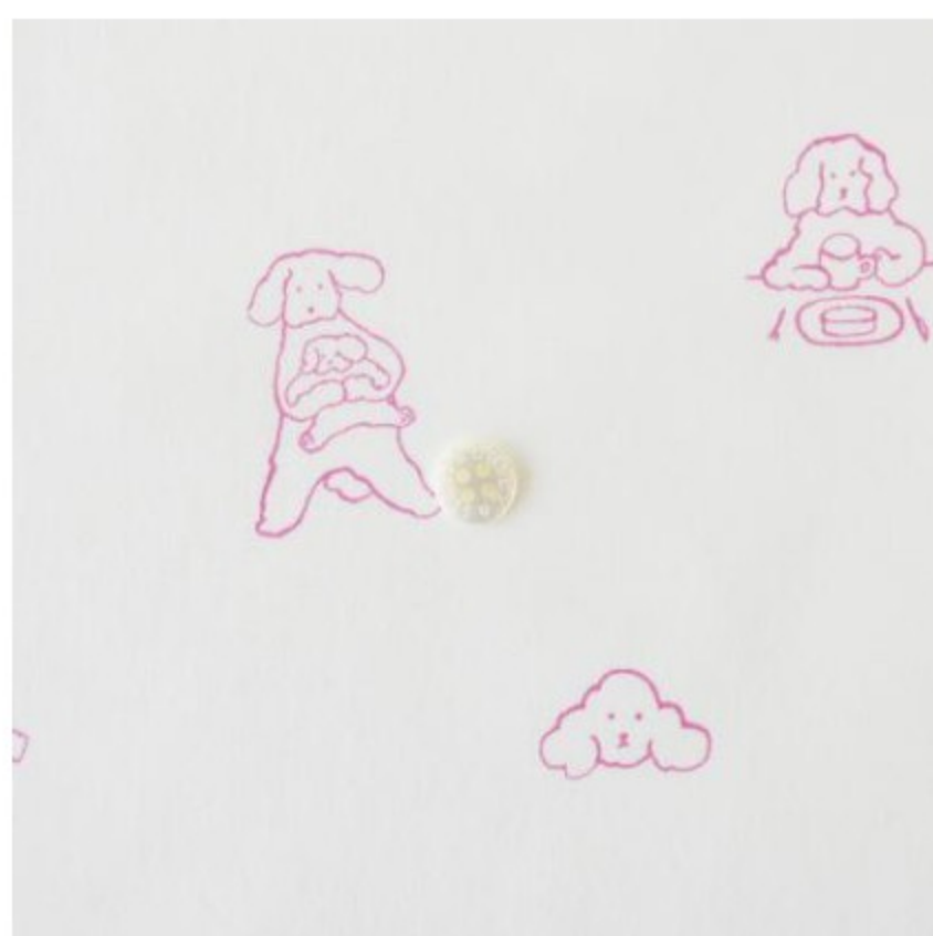
ホワイトにピンク