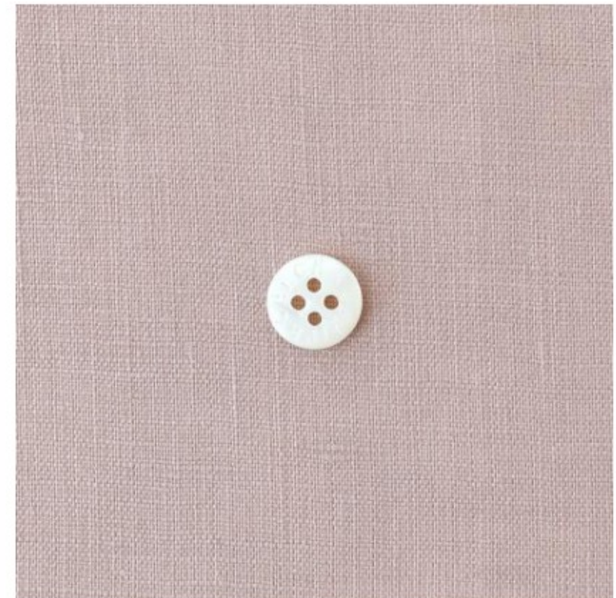
グレイッシュピンク