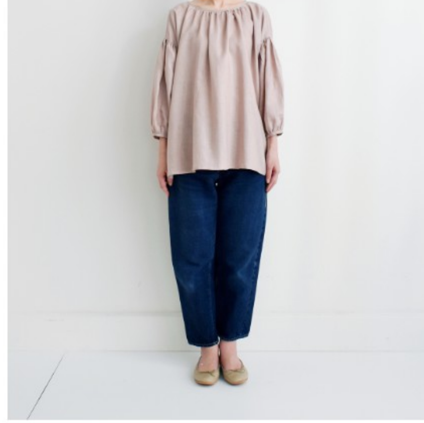
グレイッシュピンク:『CHECK&STRIPEのおとな服ソーイング・レメディィ』(文化出版局)スタンダードギャザーブラウス