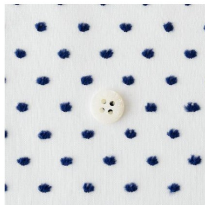
白にダークブルー