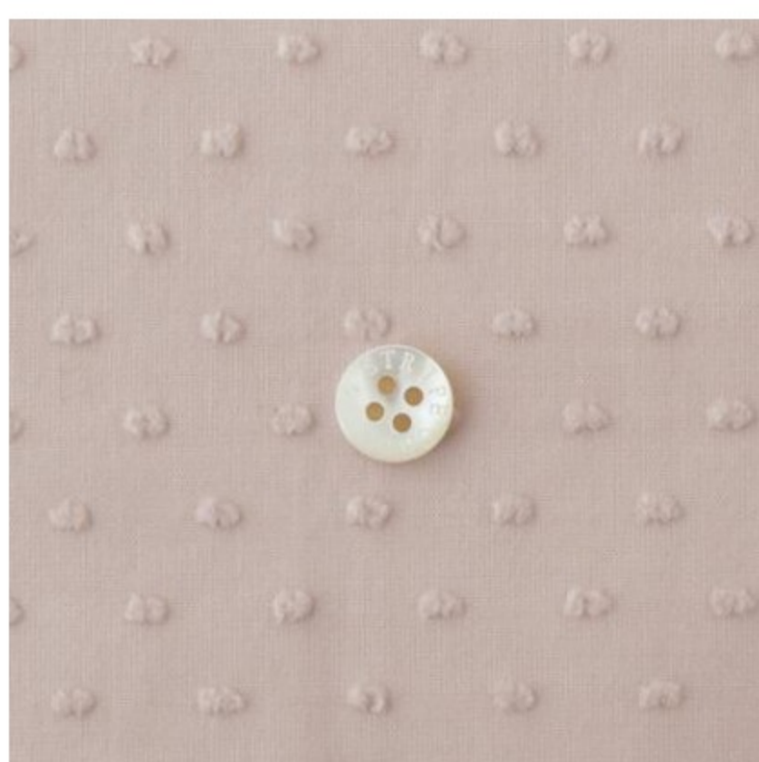
グレイッシュピンク