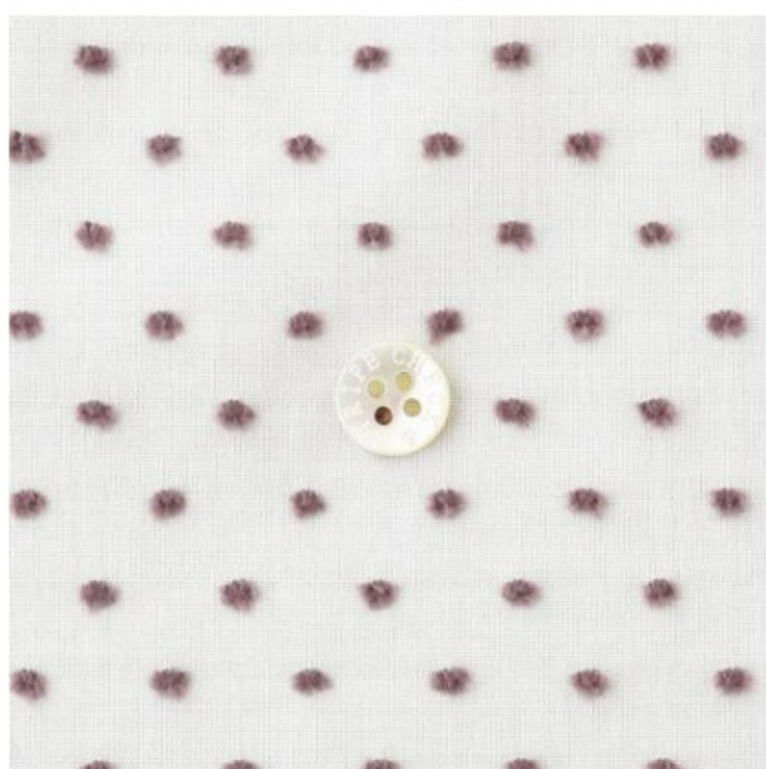
白にあずきミルク