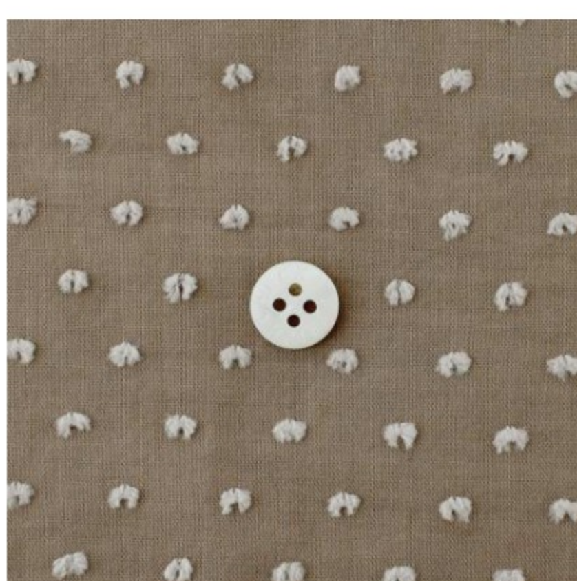
サンドにソイラテ