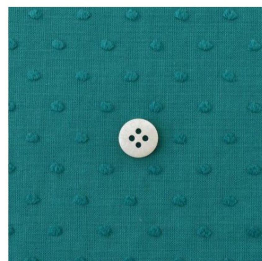
フレンチターコイズ