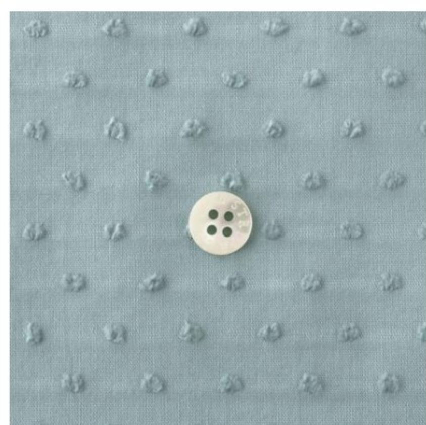
スモークブルーグレー