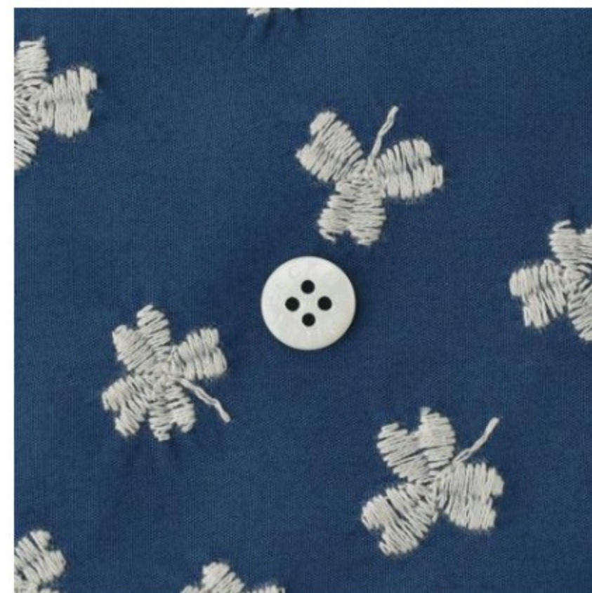
スモークブルーにシルバーグレー