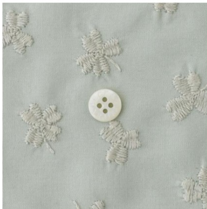
ミンティーにシルバーグレー