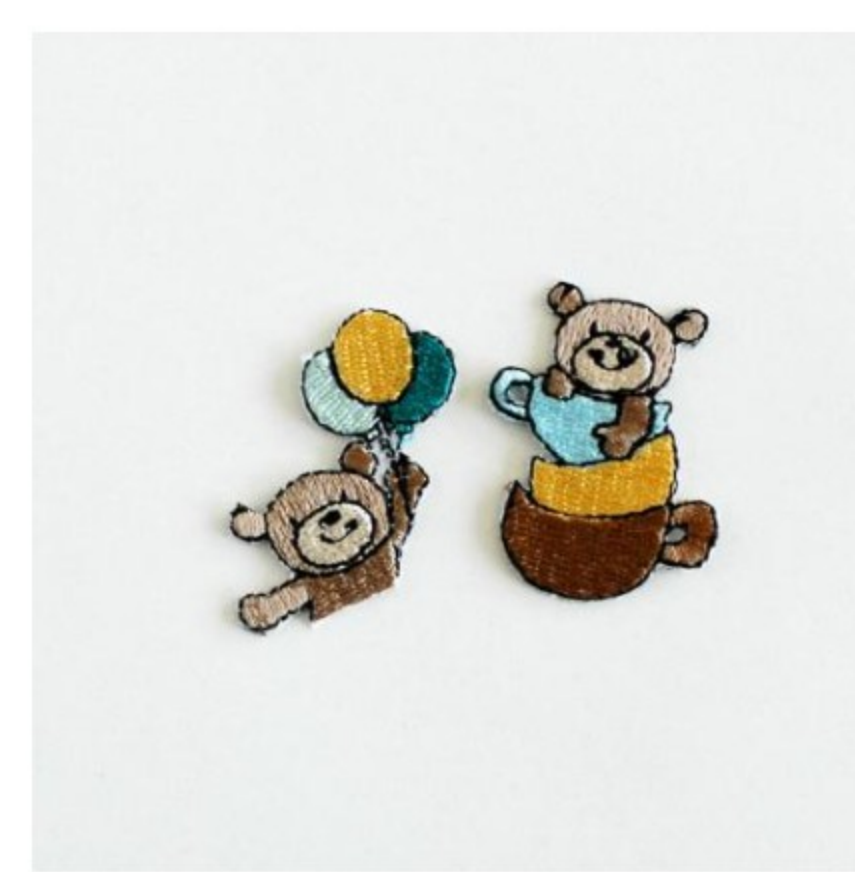
くま カップと風船 男の子用