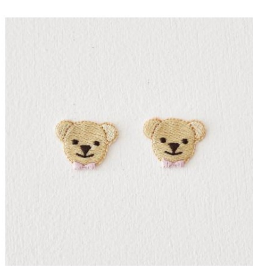
くまのぬいぐるみ リュカ