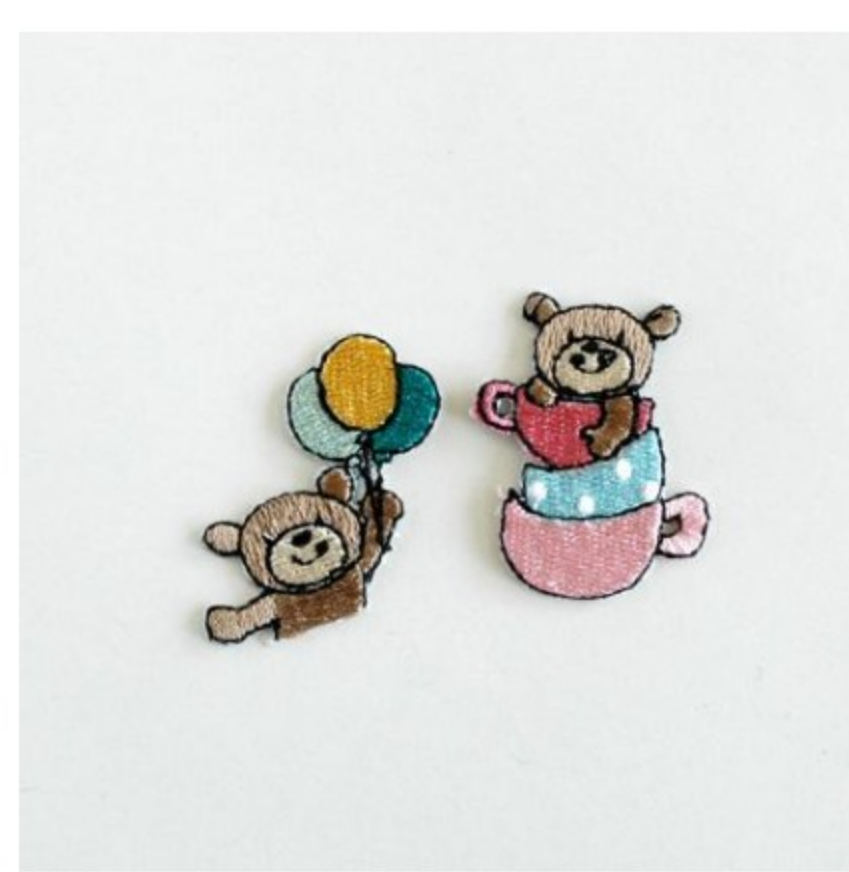
くま カップと風船 女の子用