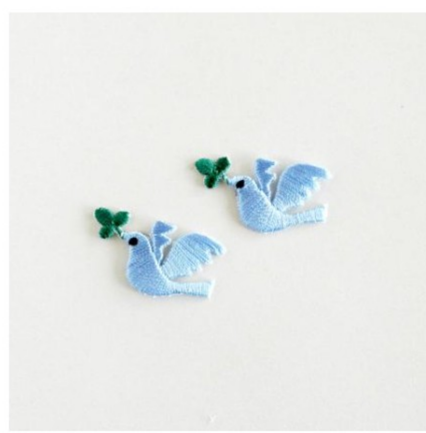
とりとクローバー