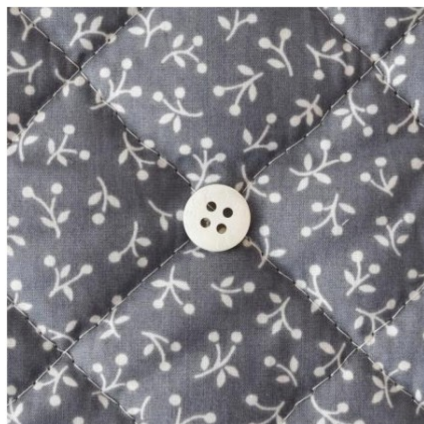
ラベンデューラ地にマッシュルーム