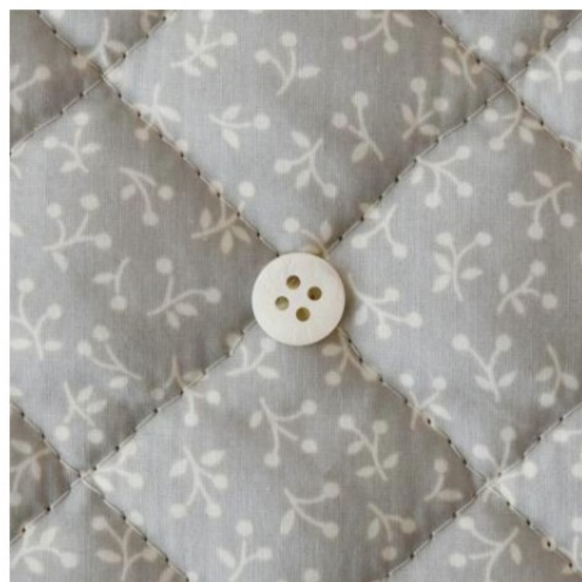
ストーン地にマッシュルーム