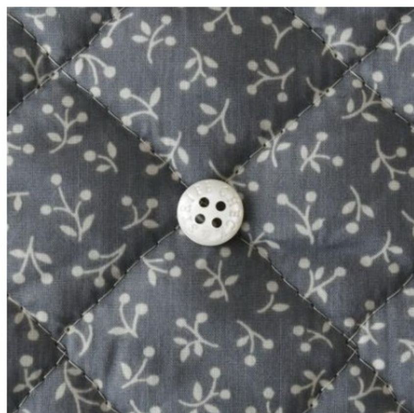
ダークグレー地にマッシュルーム