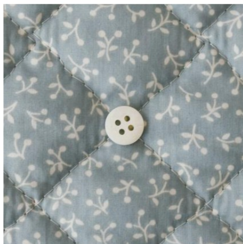
スモークブルーグレー地にマッシュルーム