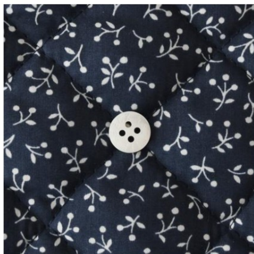
ネイビー地にマッシュルーム