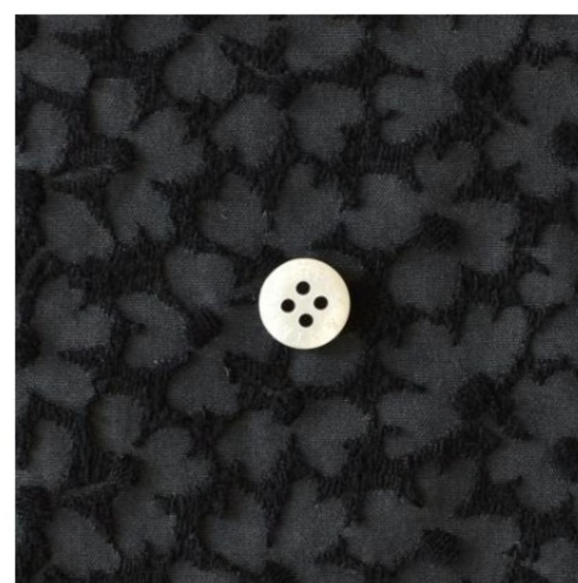
木いちごに黒(新色)