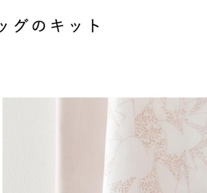
「SLOW」 ホワイト × グレイッシュ ピンク