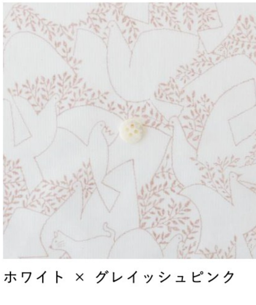
ホワイト × グレイッシュピンク