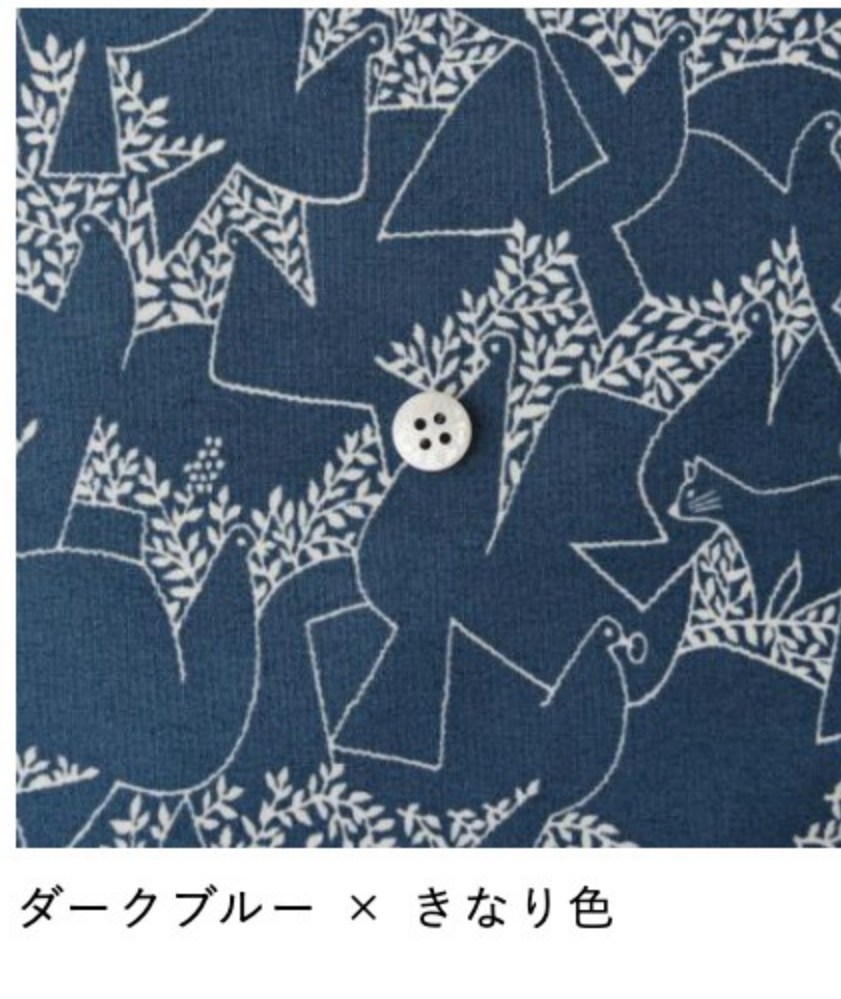
ダークブルー × きなり色