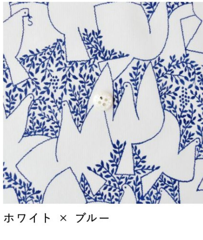
ホワイト × ブルー