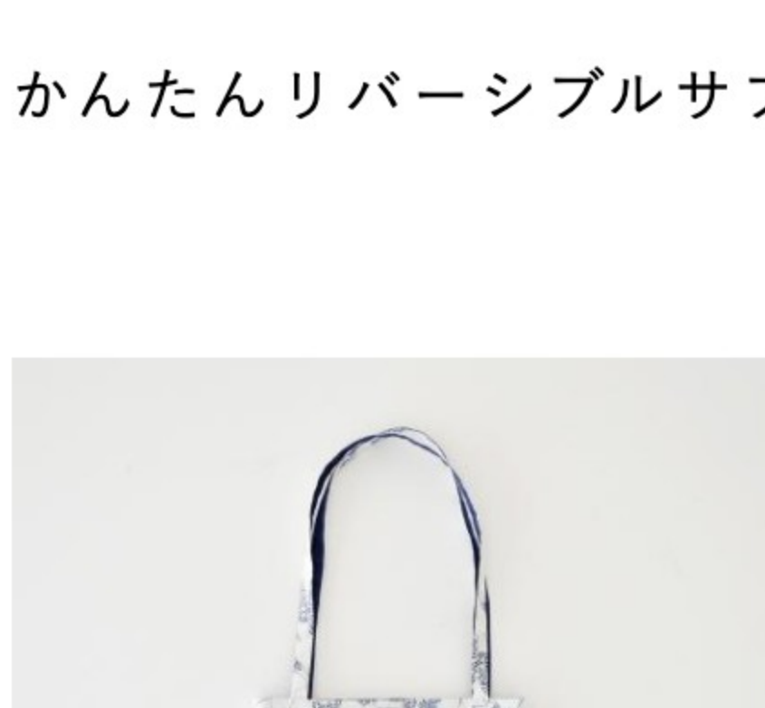
「SLOW」 ホワイト × ブルー