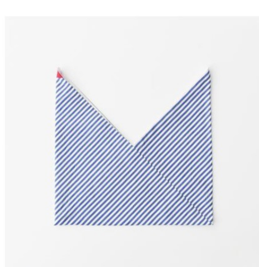
sunny days stripe ブルー×ホワイト