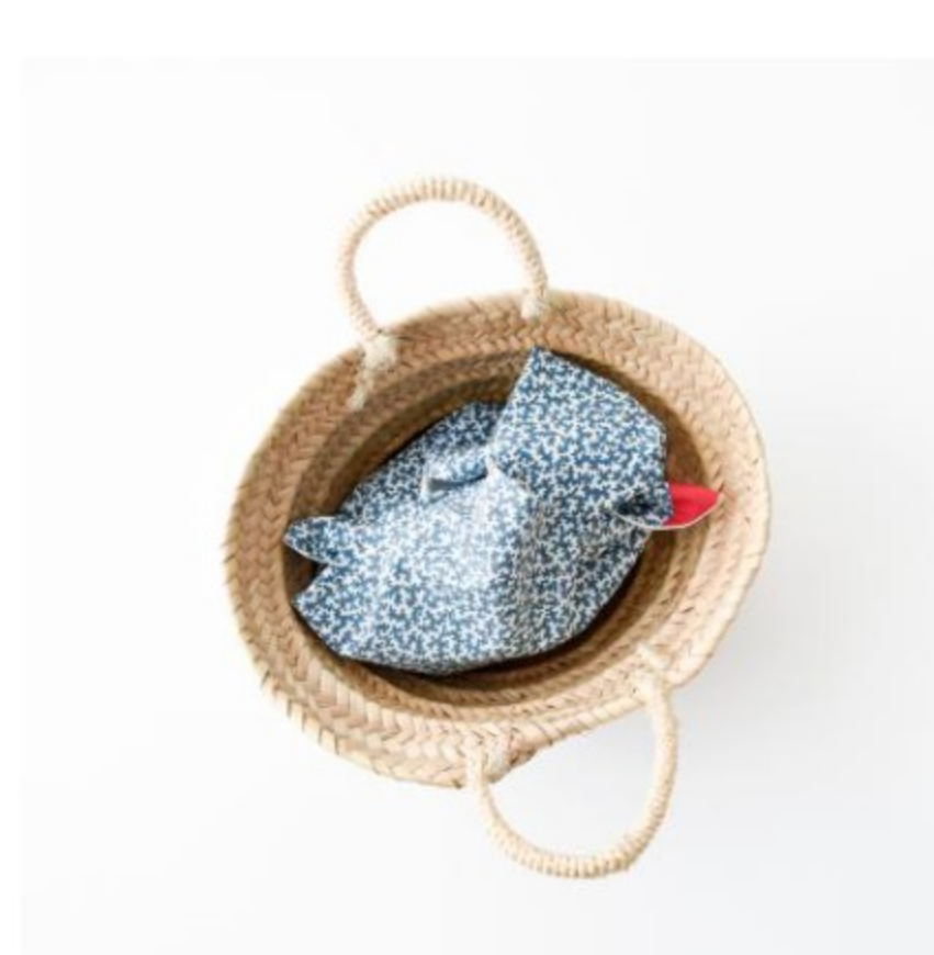
Petal water アンティークホワイト地