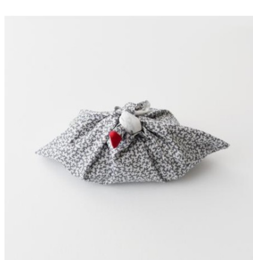
Petal water ラベンデューラ地