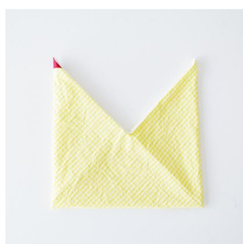
sunny days check レモンイエロー×ホワイト