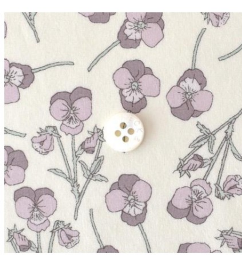
◎J21D(フレンチカラー系)