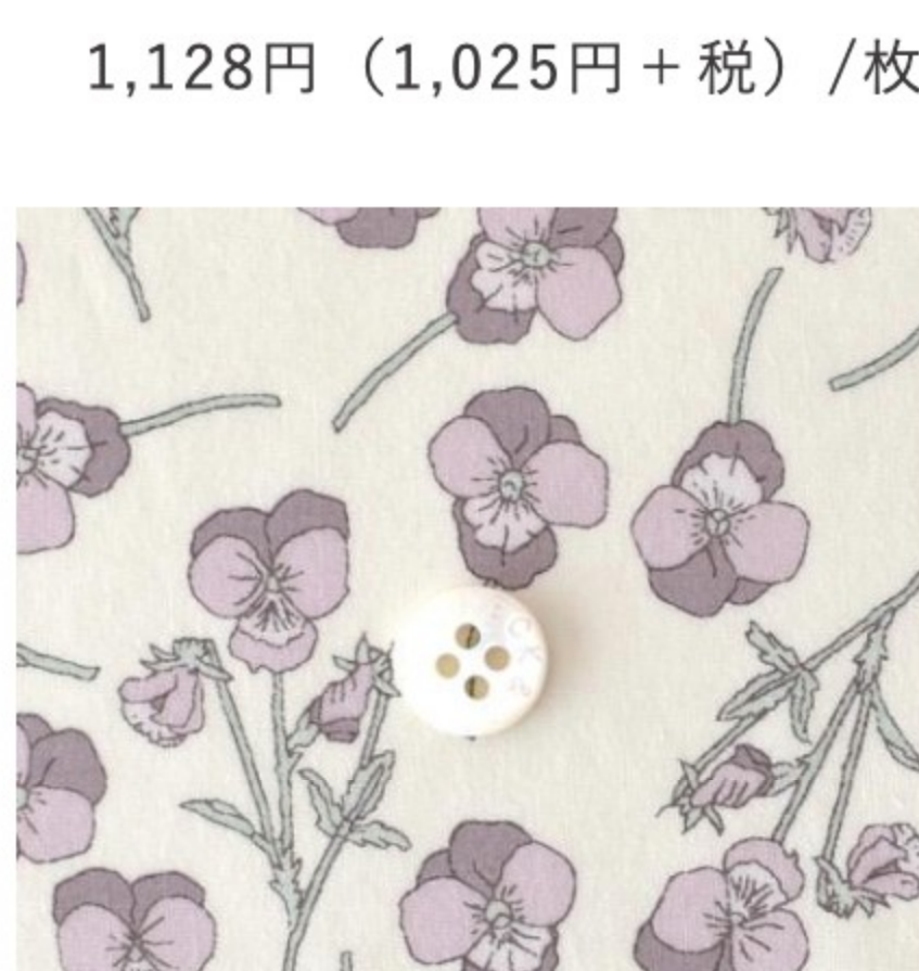
◎J21D(フレンチカラー系)