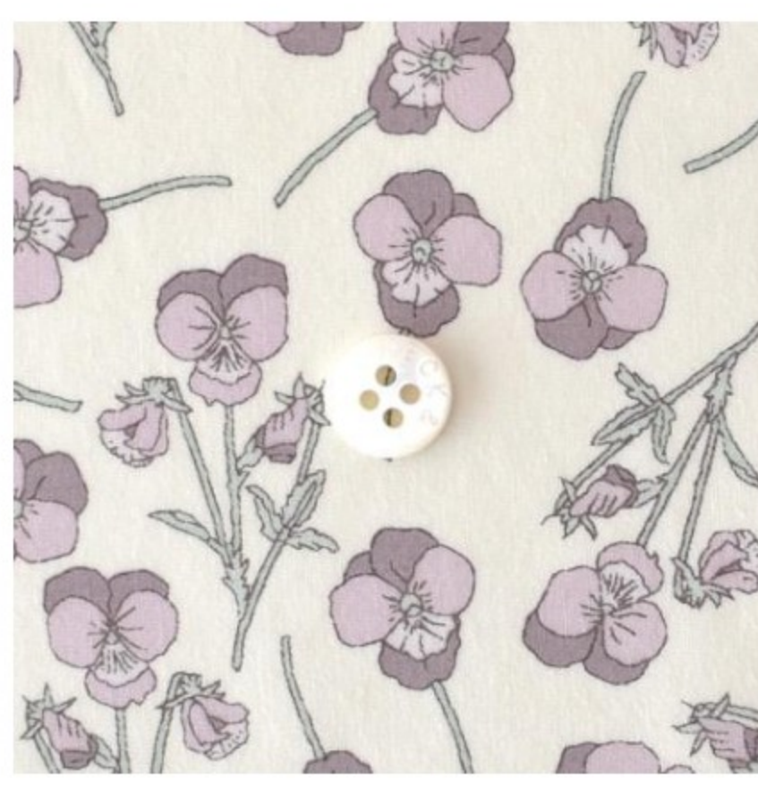
◎J21D(フレンチカラー系)