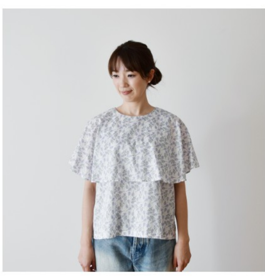
◎J21A(ラベンダー系) : 『CHECK&STRIPE my favorite 私の好きな服』(主婦と生活社) ケーブブラウス