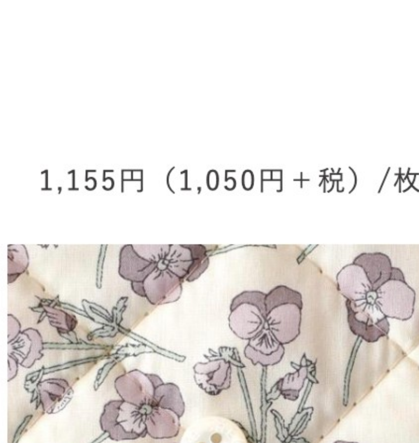
◎J21D(フレンチカラー系)