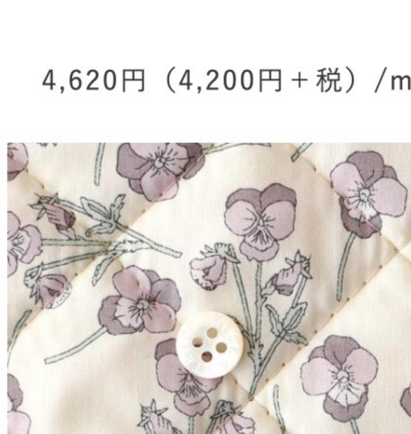
◎J21D(フレンチカラー系)