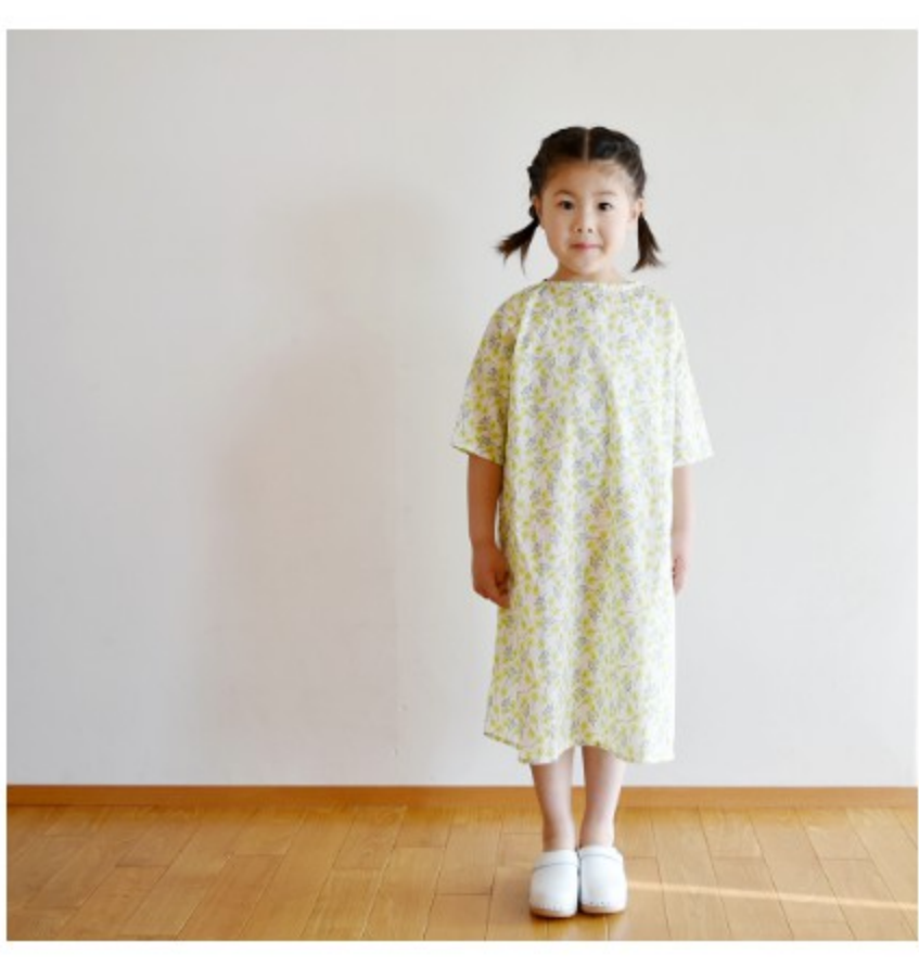
◎J21C(イエロー系) : 『CHECK&STRIPE Sewing Diary in Paris パリのソーイングダイアリー』(世界文化社) ポートネックのワンピース 子ども