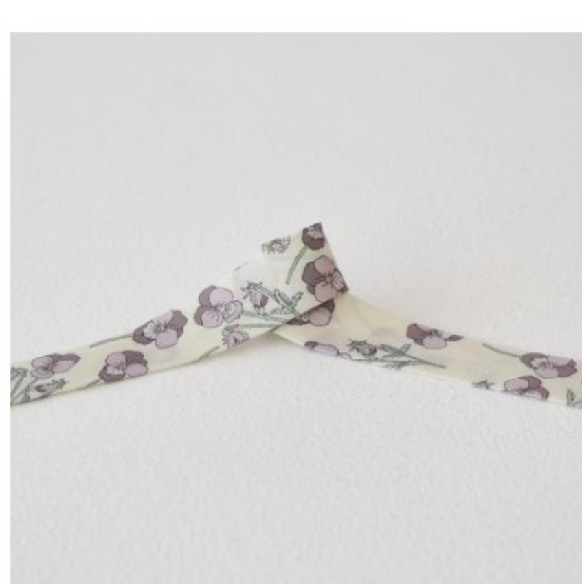
◎J21D(フレンチカラー系)