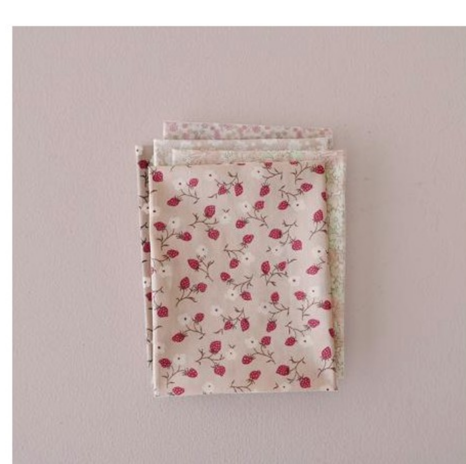
フレンチカラー系