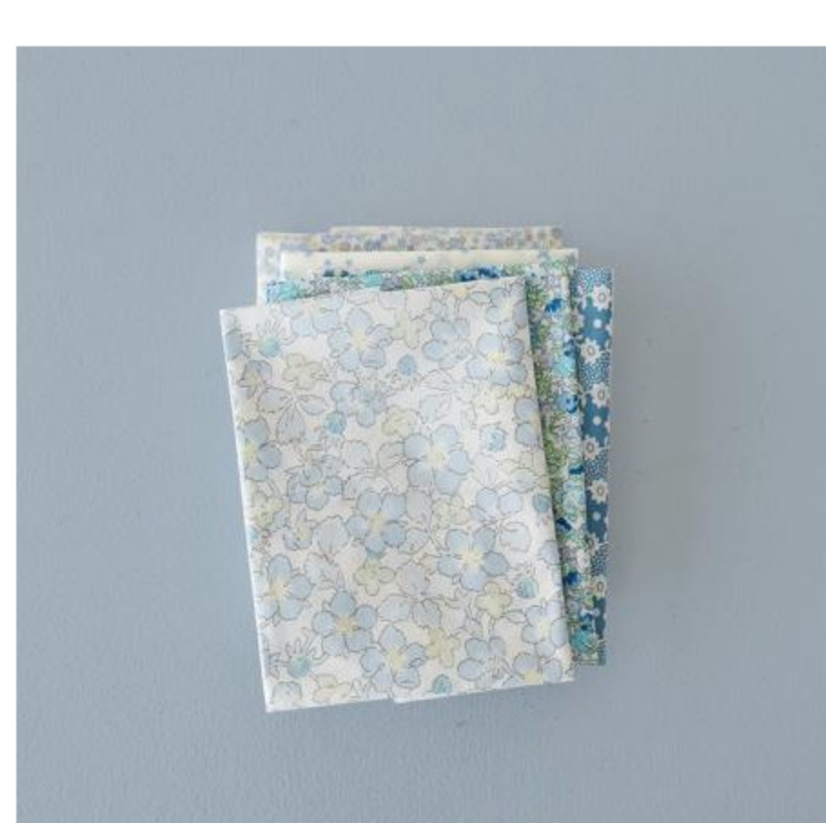
ブルー・ネイビー系