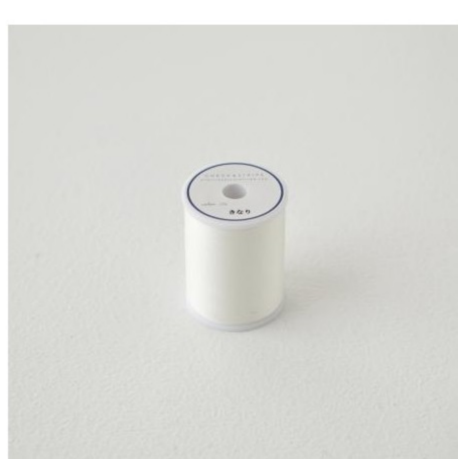
副資材(ミシン糸など)