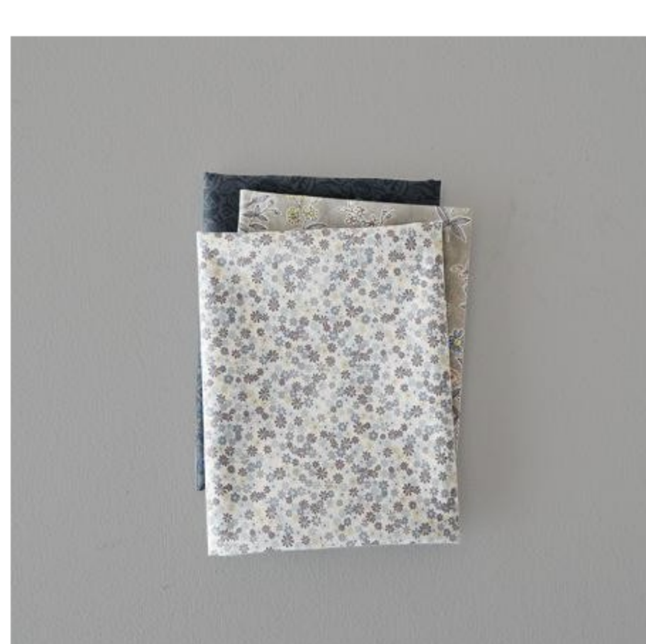
グレー・ブラウン系