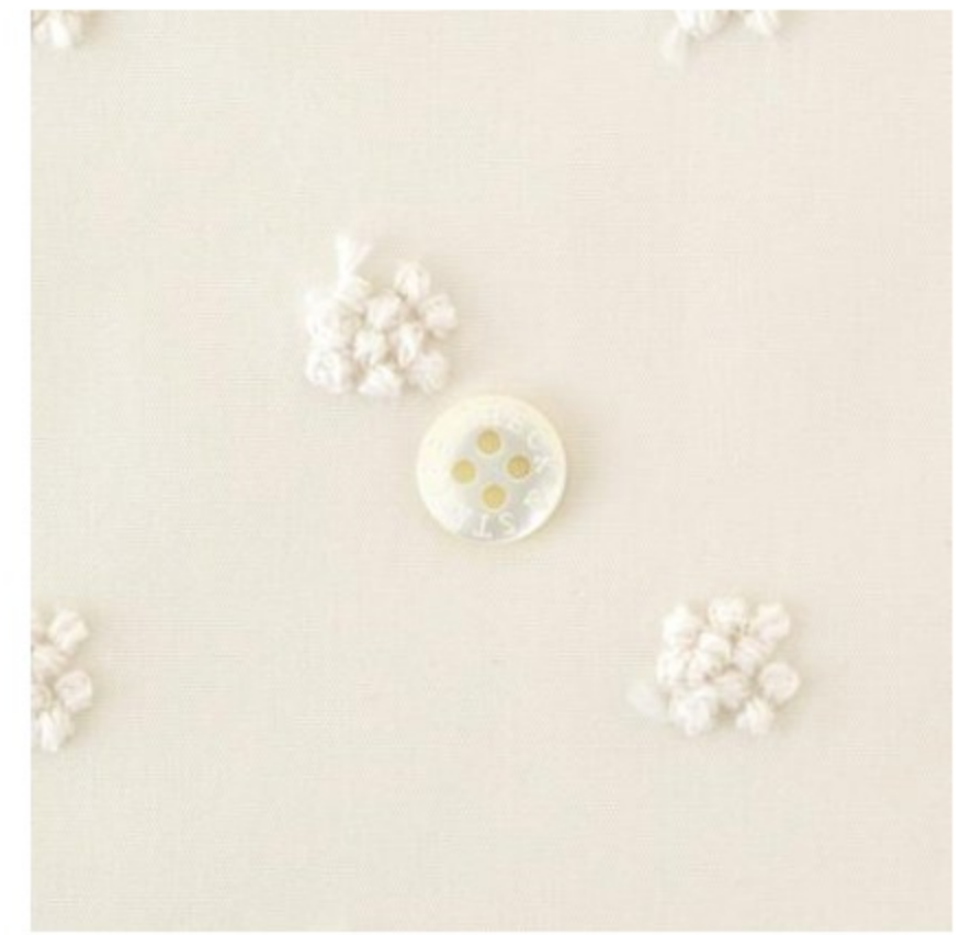
きなりにアイボリー