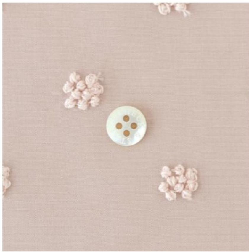
グレイッシュピンクにピーチ