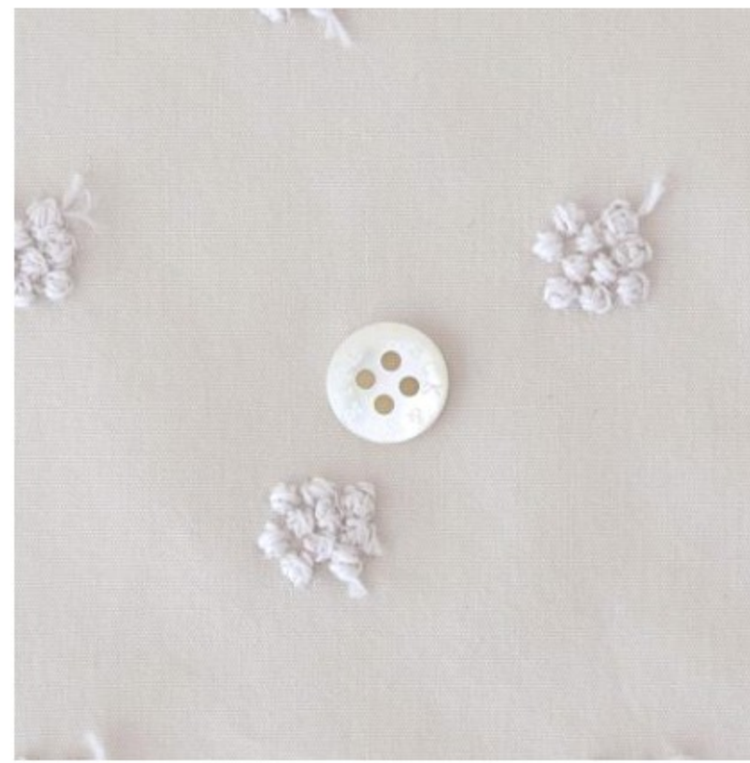
マッシュルームにパールグレー