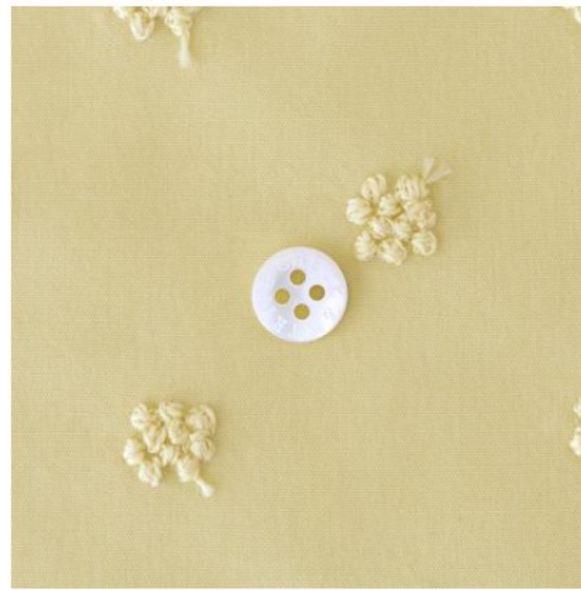
カナリーイエローにコーン