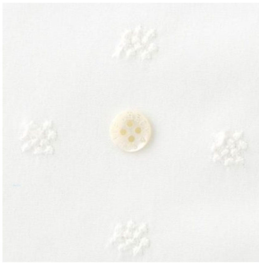
ホワイトにオフホワイト