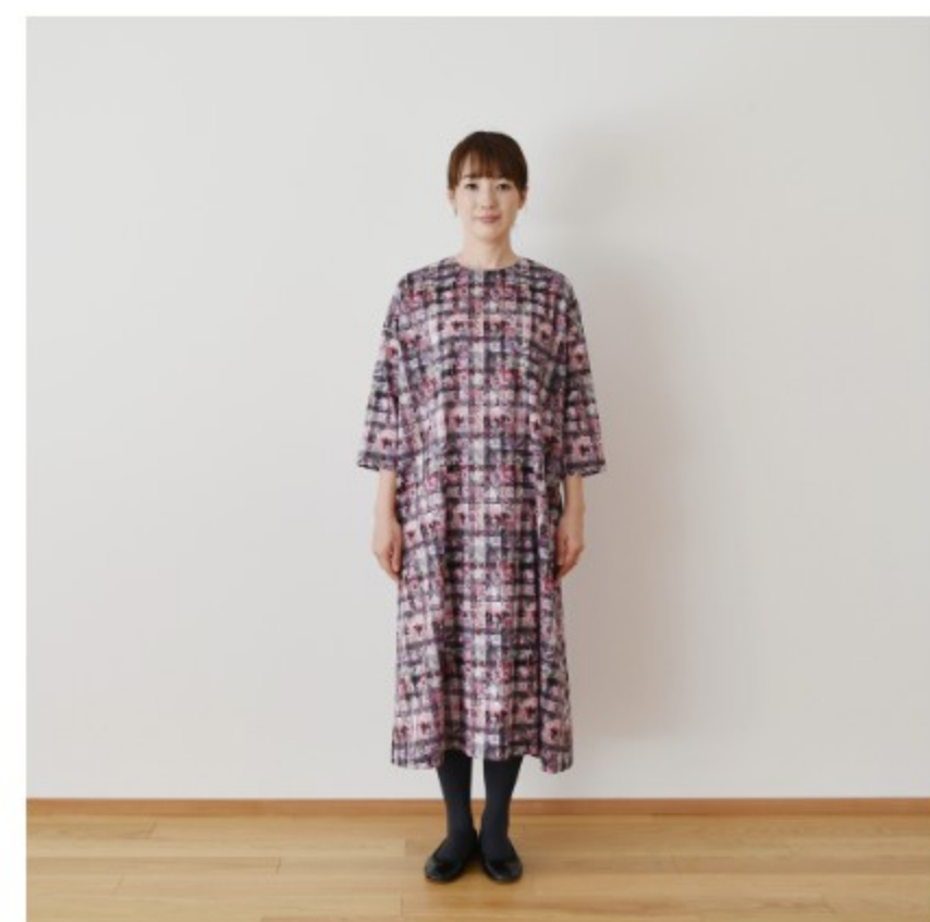
B(パープル):『CHECK&STRIPEのおとな服 ソーイング・レメディ』(文化出版局) シンプルAラインワンピース