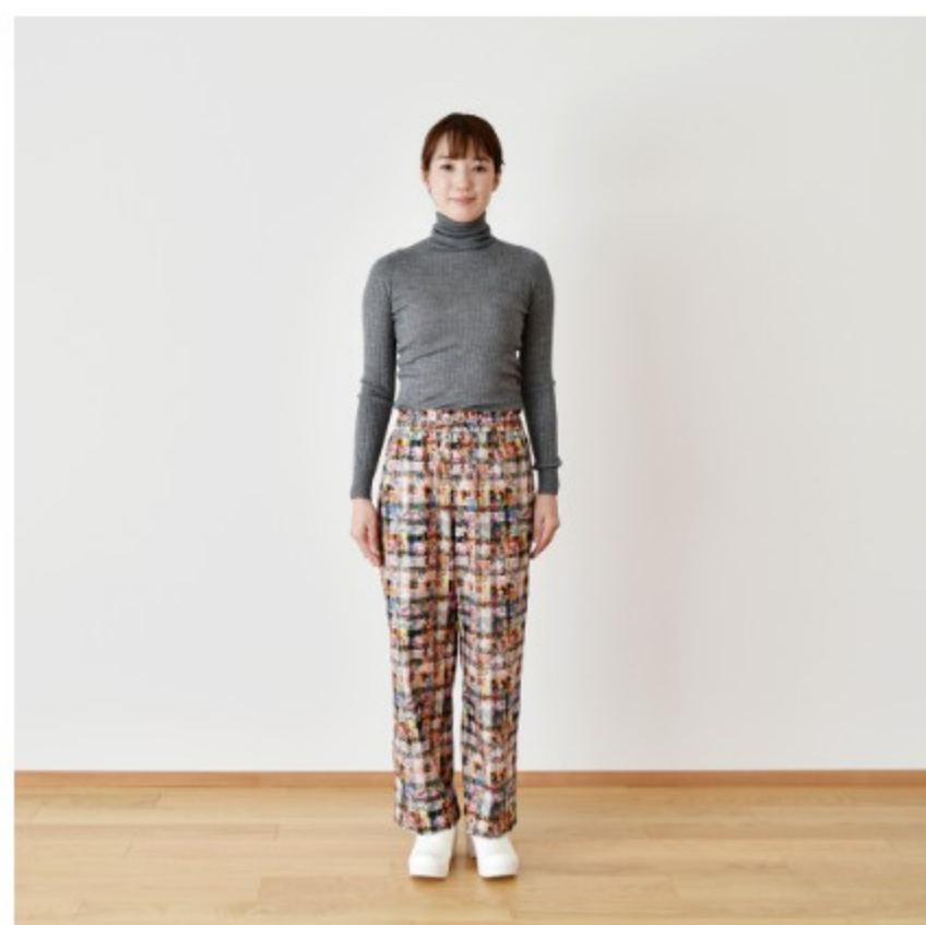
A(カラフル):『CHECK&STRIPEのおとな服 ソーイング・レメディ』(文化出版局) フローラルパンツ