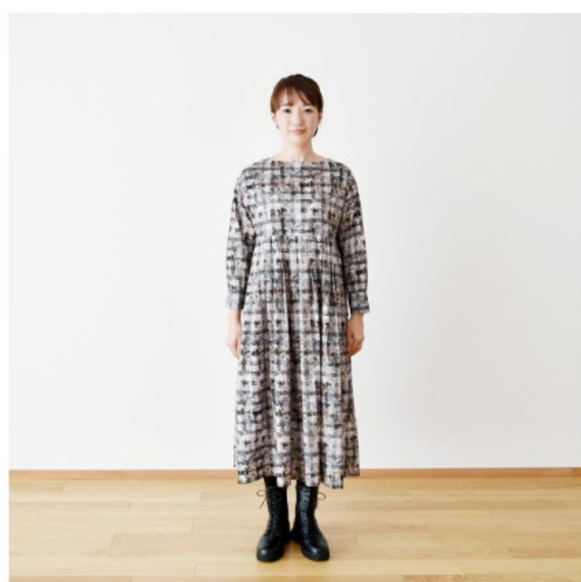
C(グレー):『CHECK&STRIPE my favorite 私の好きな服』(主婦と生活社) タックワンピース ※着丈を3cm伸ばして、袖口にカフスをつけて長袖にするアレンジをしています。