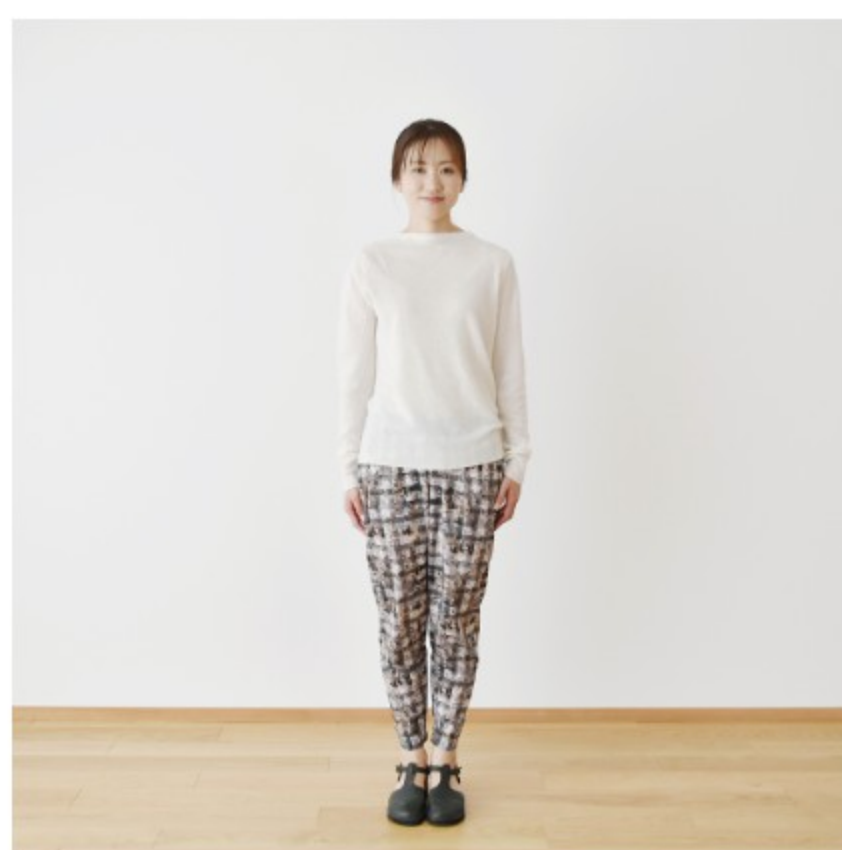
C(グレー):おまけレシピ「すっきりパンツ」 ※裾幅を15cmに狭めるアレンジをしています。用尺:S・M・L 2.2m (こちらのレシピはつきません)