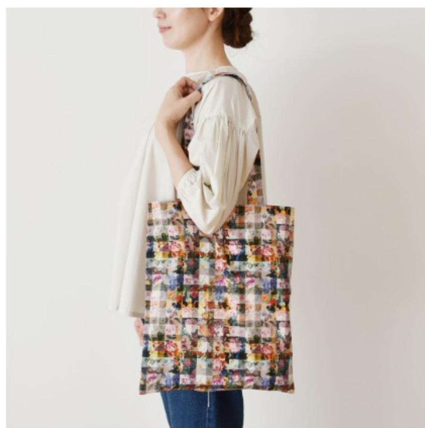
A(カラフル):おまけレシピ「リバティトートバッグ」(こちらのレシピはつきません)