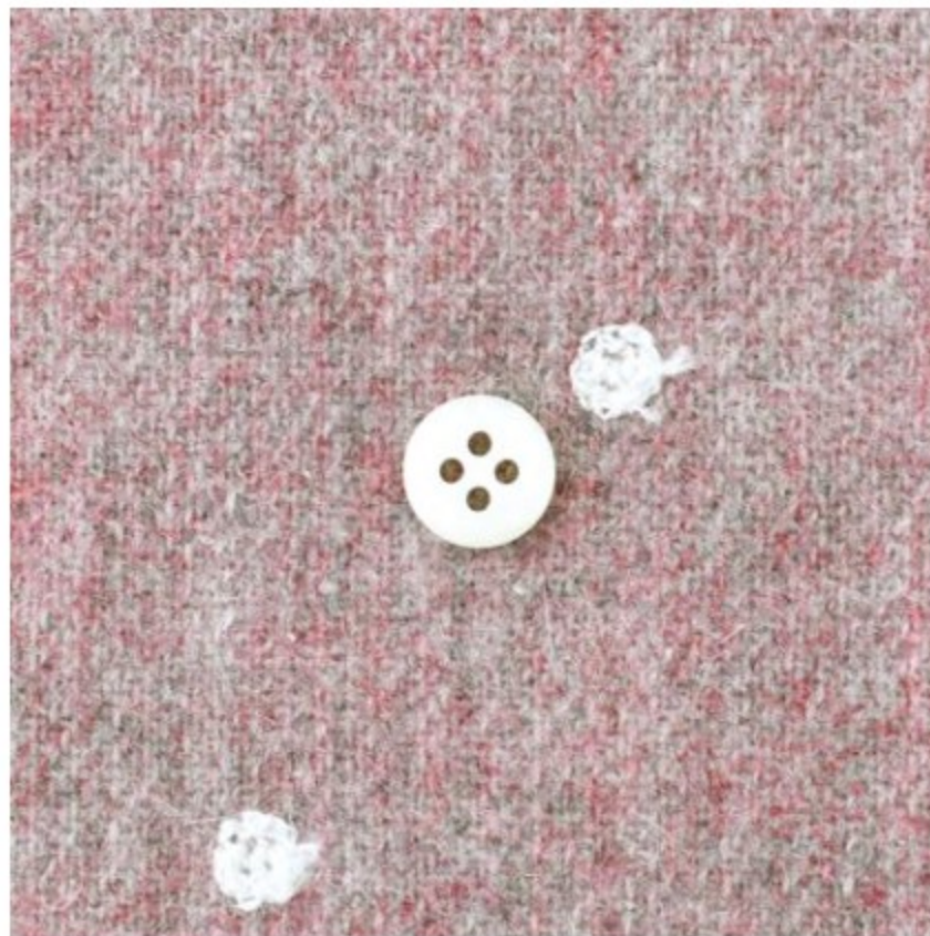
全ピンク地にオフホワイト