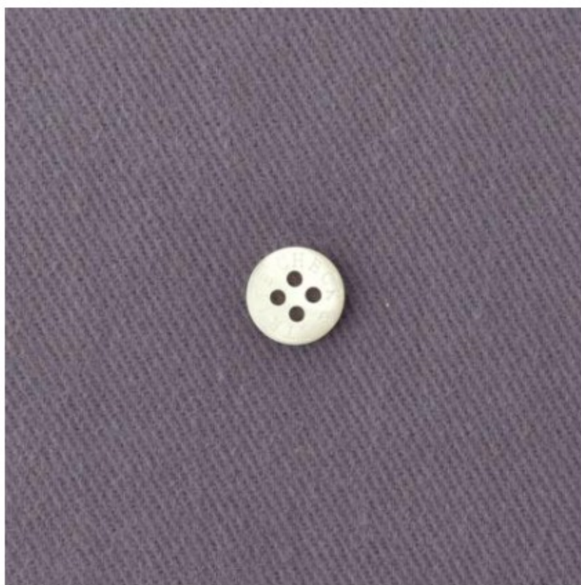
グレイッシュラベンダー