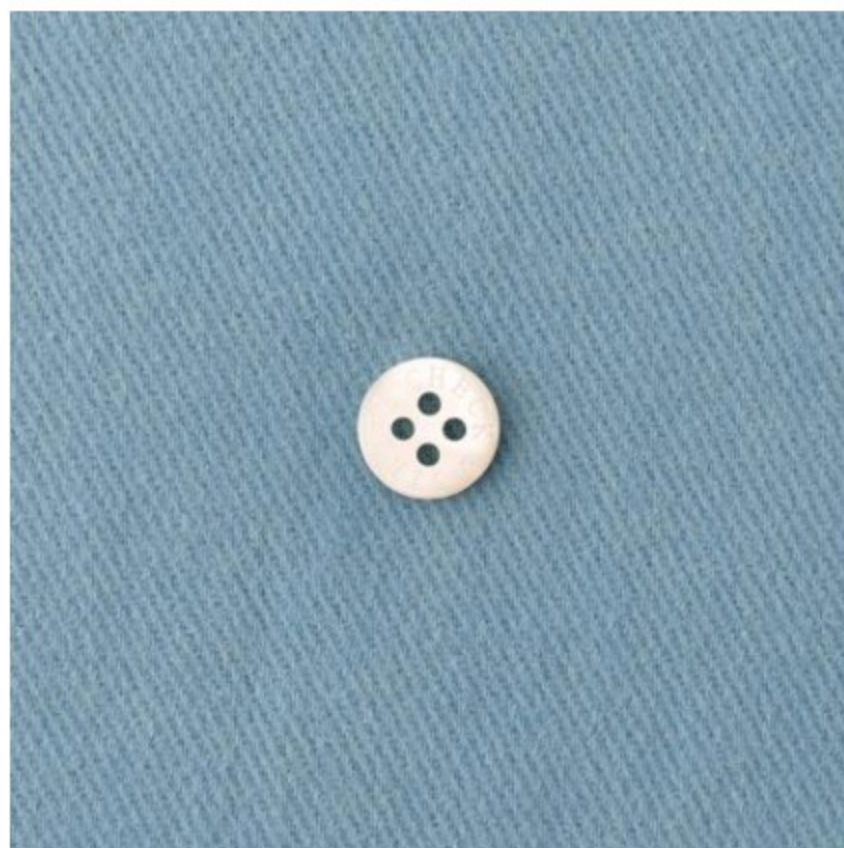
フォゲットミーノット