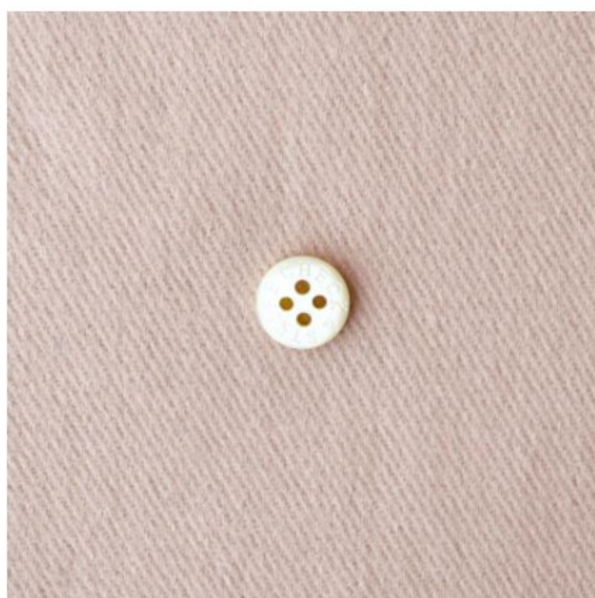
グレイッシュピンク