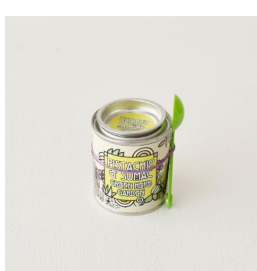
ミニ缶(計量スプーン付き)