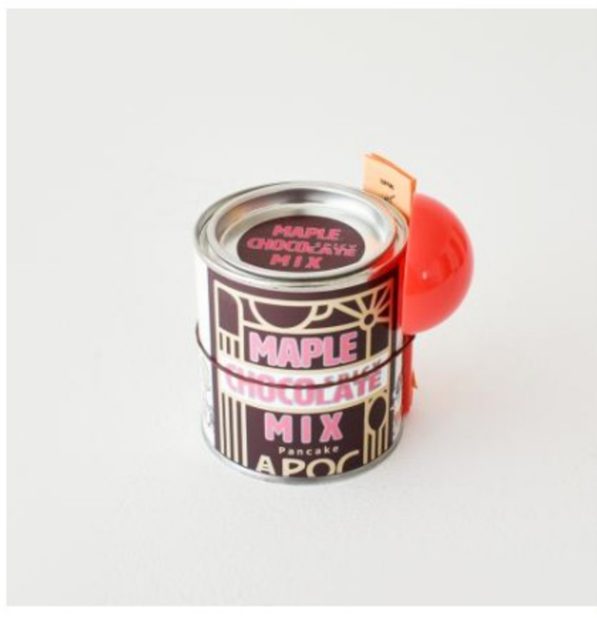
缶(計量スプーン付き)