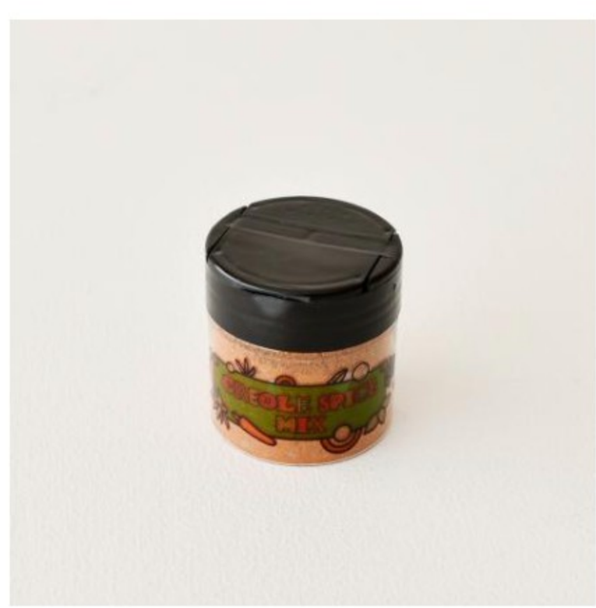
フリップキャップ付きスパイスジャー