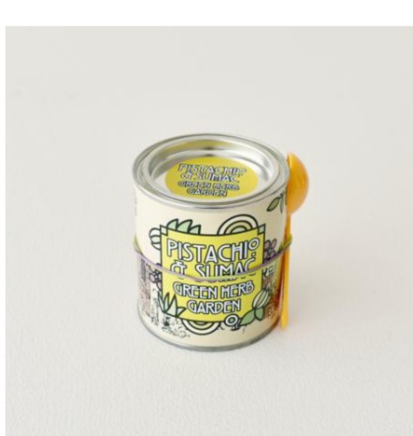
缶(計量スプーン付き)