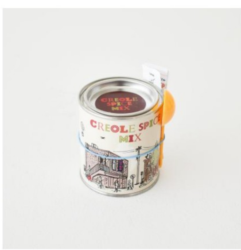
缶(計量スプーン付き)