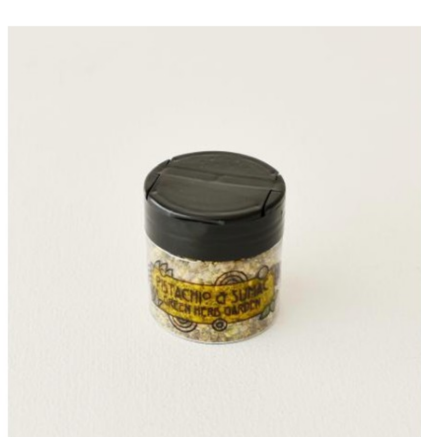
フリップキャップ付きスパイスジャー