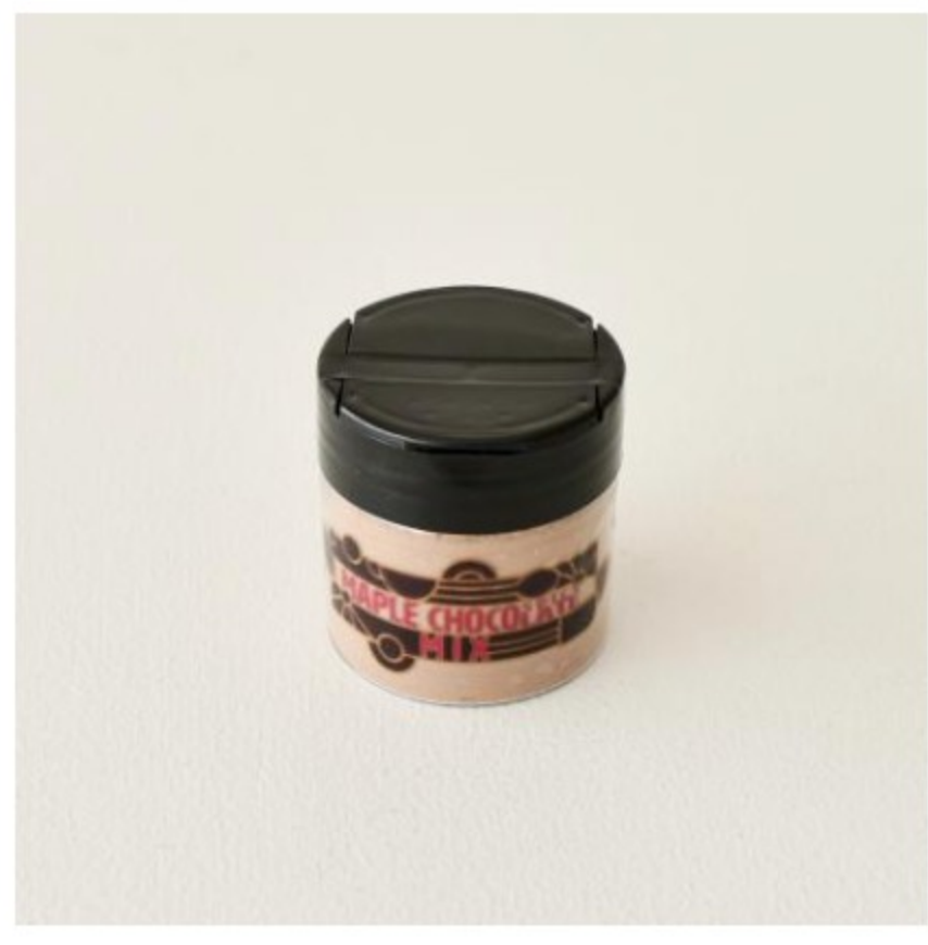
フリップキャップ付きスパイスジャー