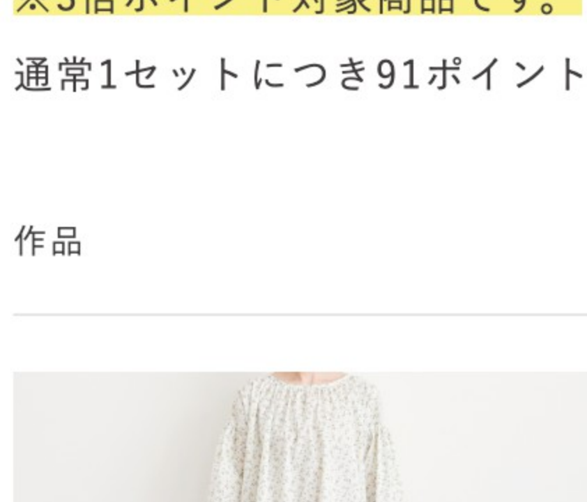
◎J20D(マッシュルーム系): 『CHECK&STRIPEのおとな服ソーイング・レメディー』(文化出版局) スタANDARDギャザーブラウス