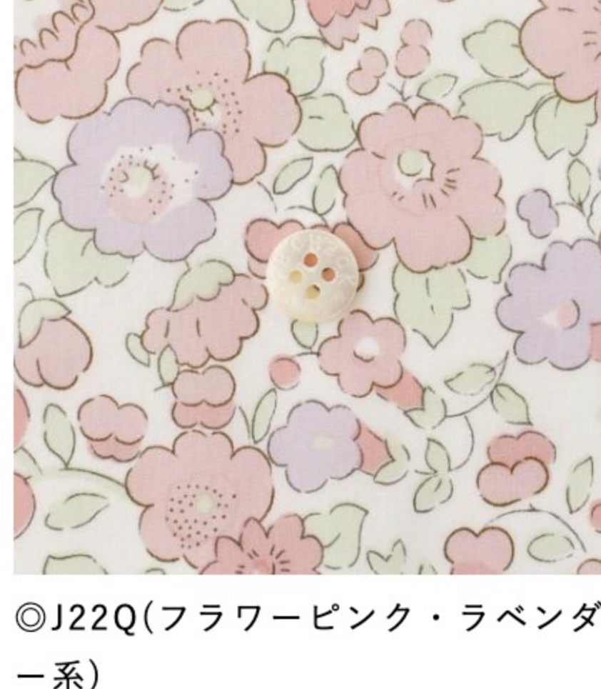
◎J22Q(フラワーピンク・ラベンダー系)