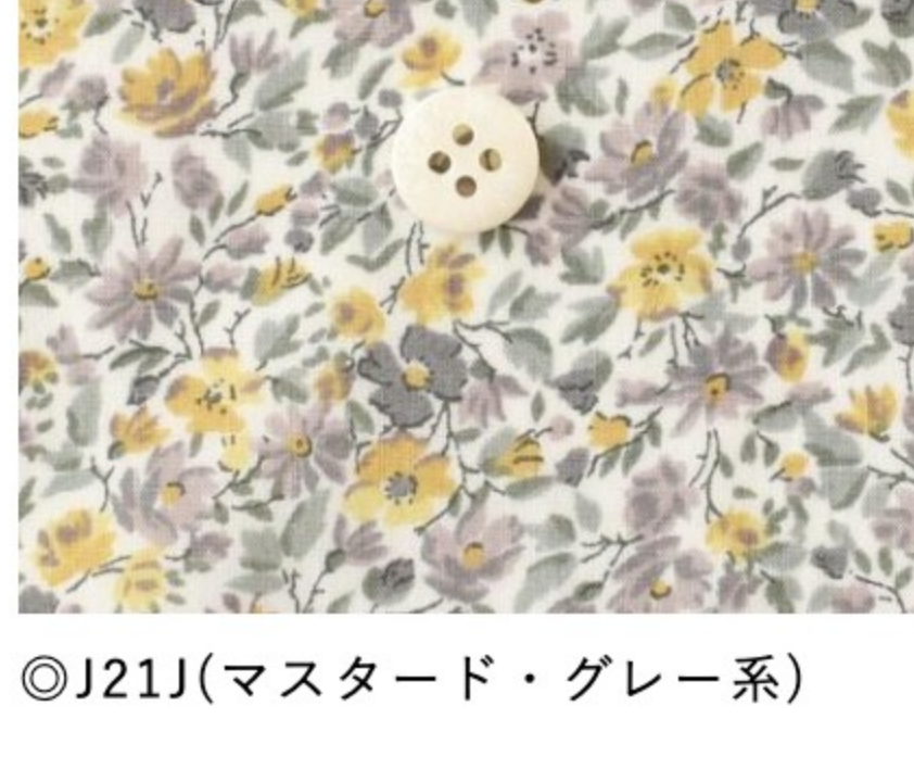
◎J21J(マスタード・グレー系)