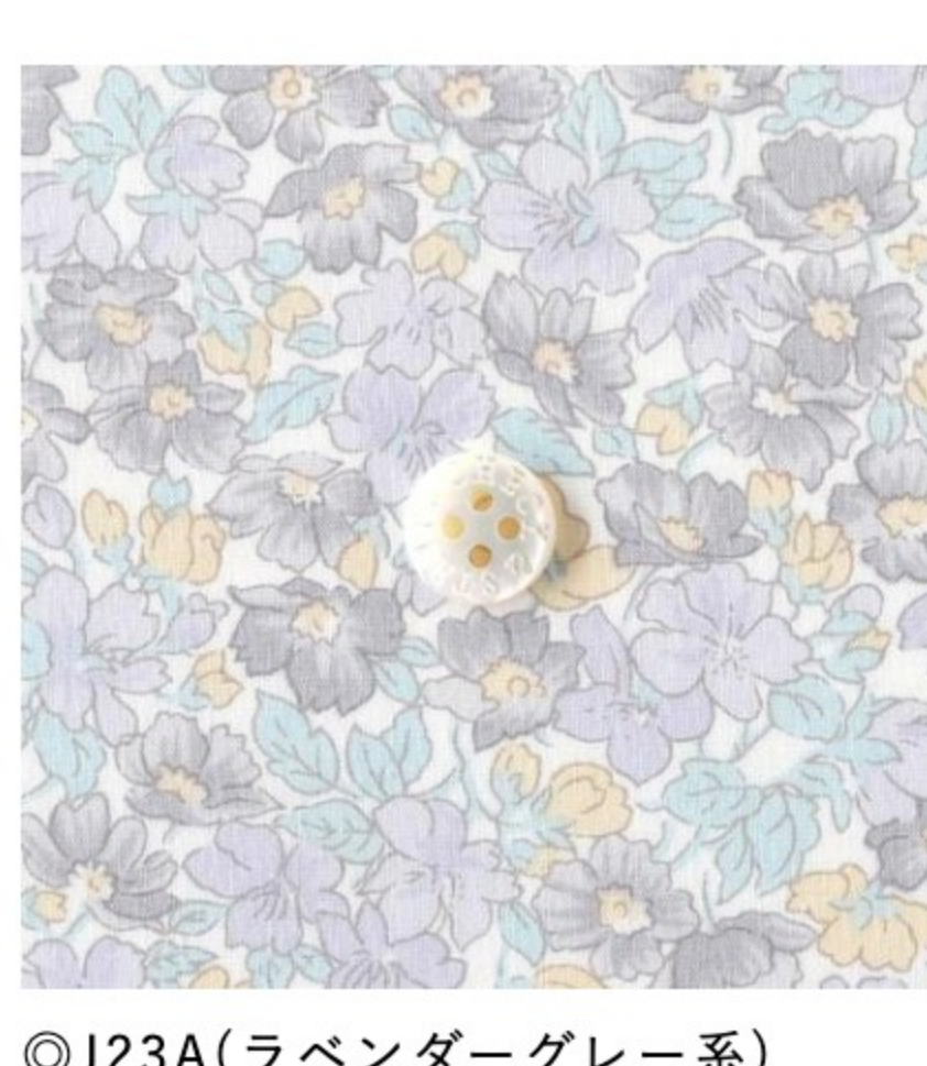
◎J23A(ラベンダーグレー系)