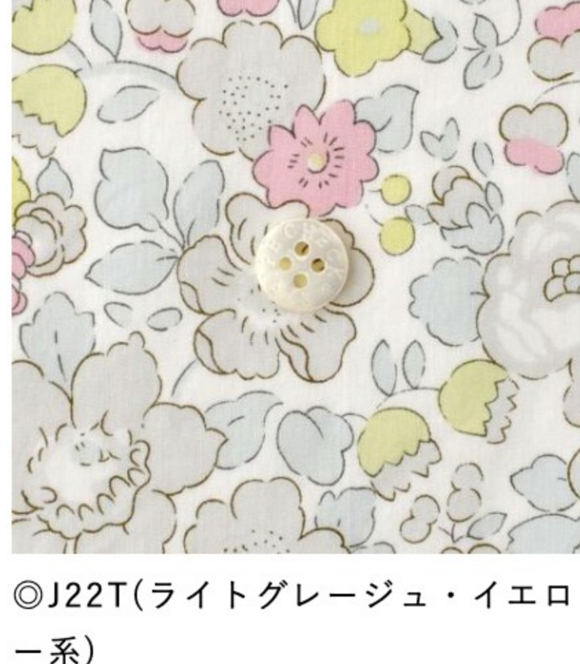
◎J22T(ライトグレージュ・イエロ系)