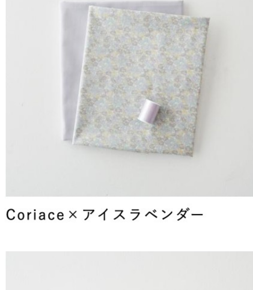
Coriace×アイスラベンダー