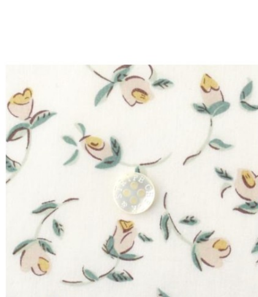
◎J20D(マッシュルーム系)