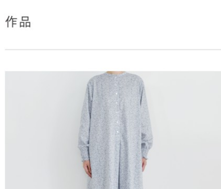
J21CT:「パターン176」 スタンドカラーのワンピース 長袖