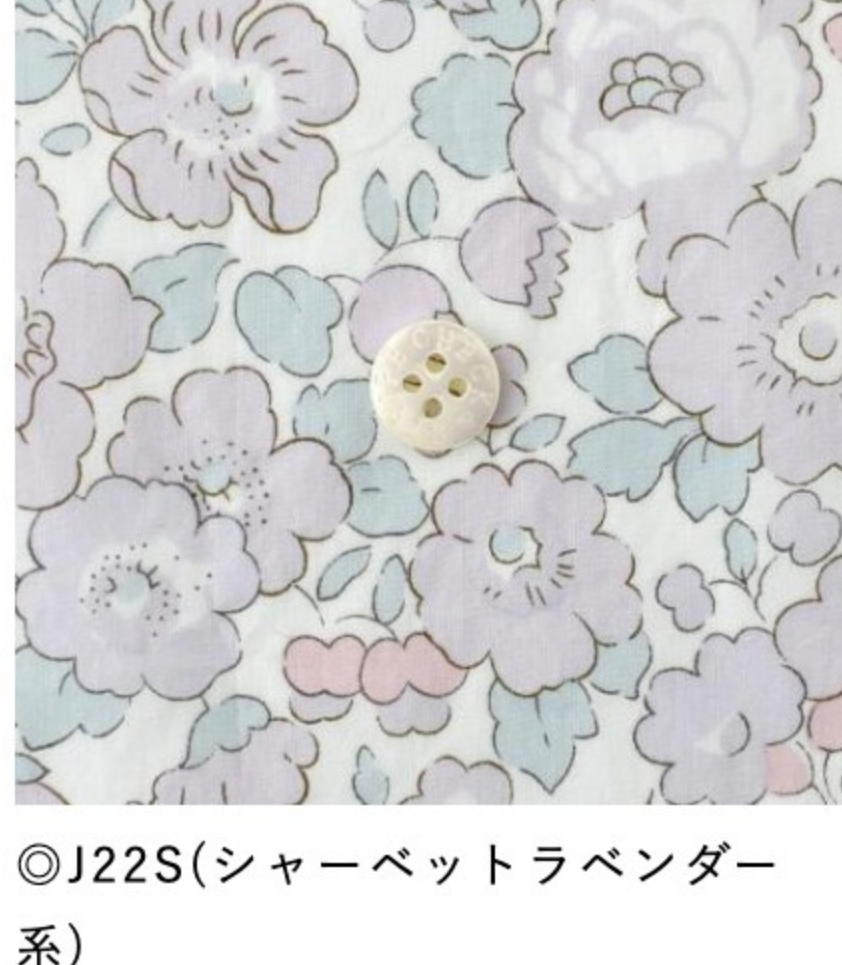
◎J22S(シャーベットラベンダー系)