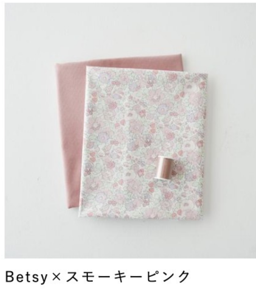
Betsy×スモーキーピンク