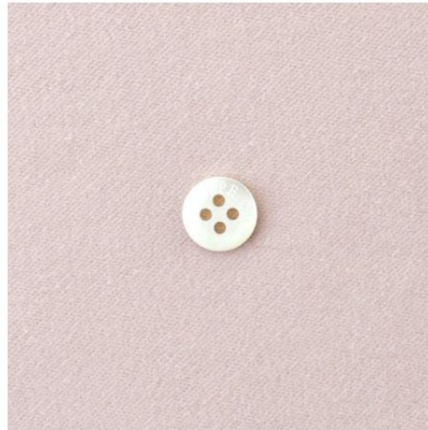
グレイッシュピンク