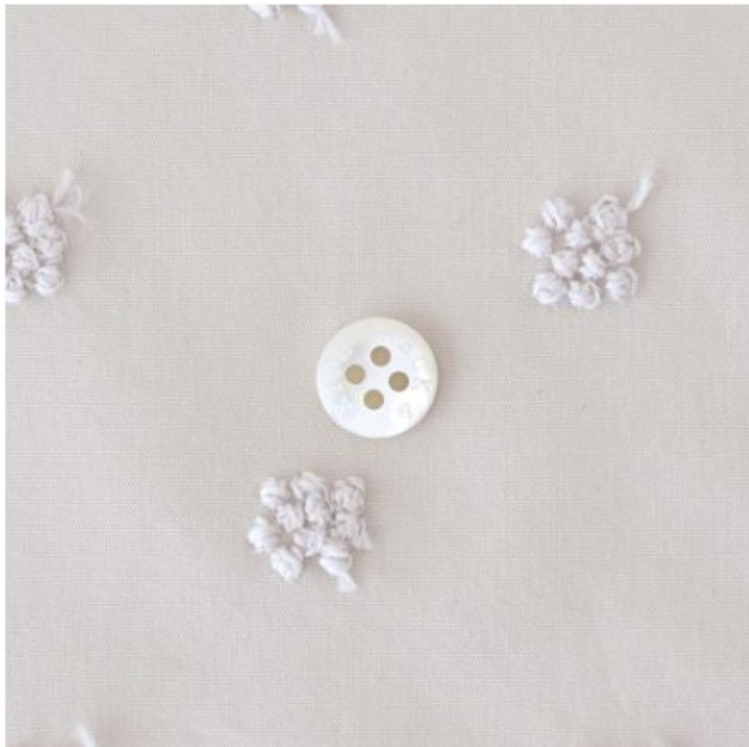
マッシュルームにパールグレー