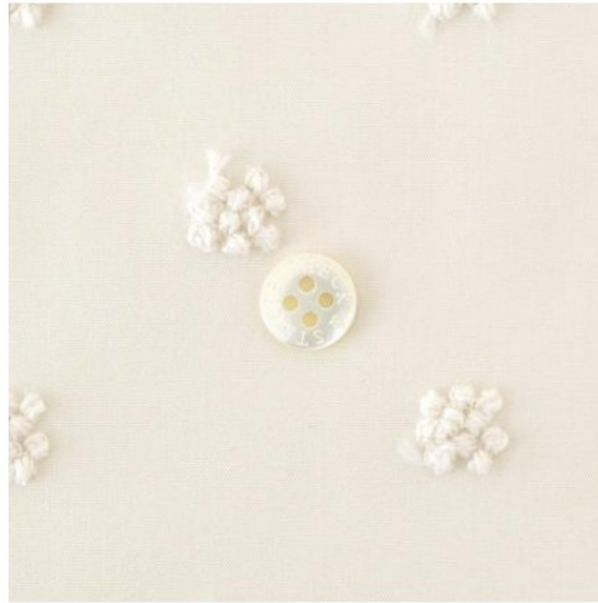
きなりにアイボリー