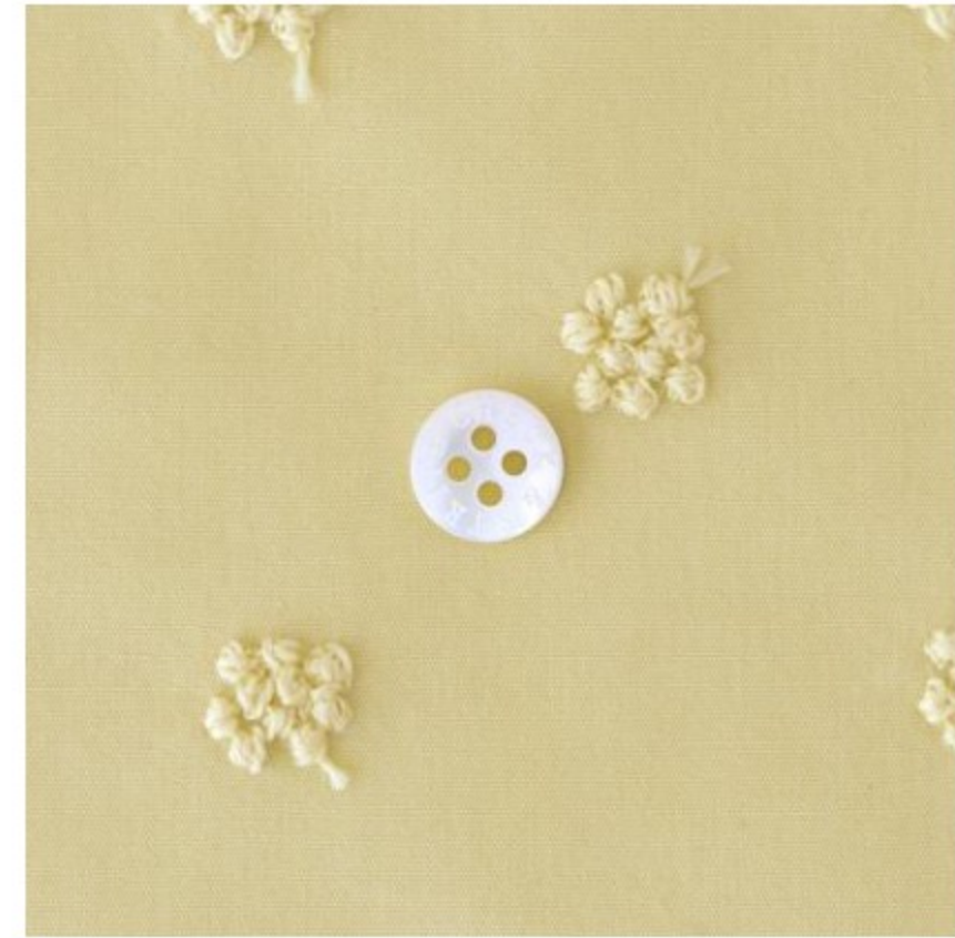
カナリーイエローにコーン