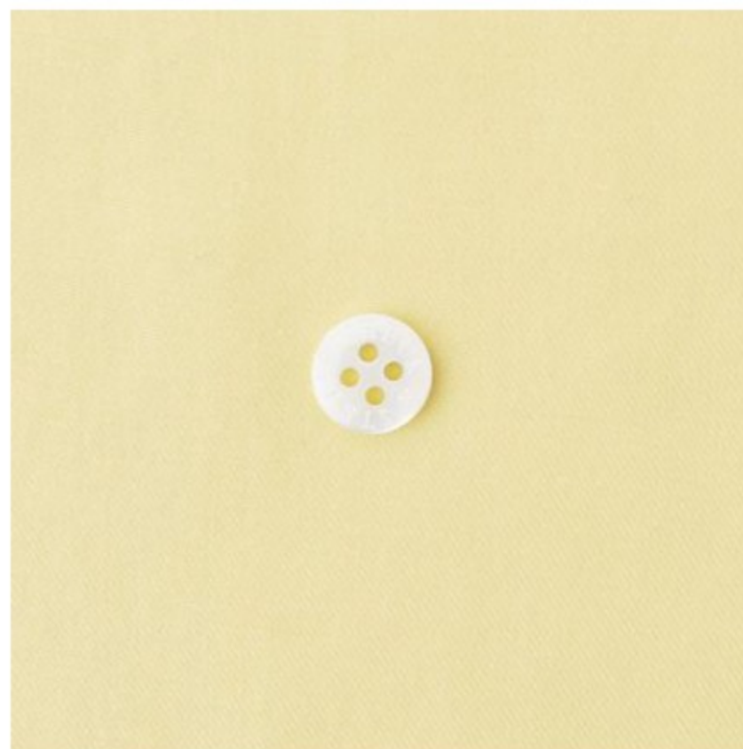
カナリーイエロー