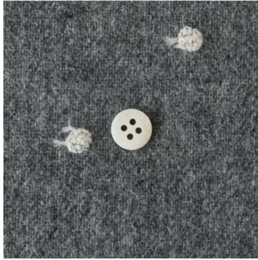
グレー地にホワイト