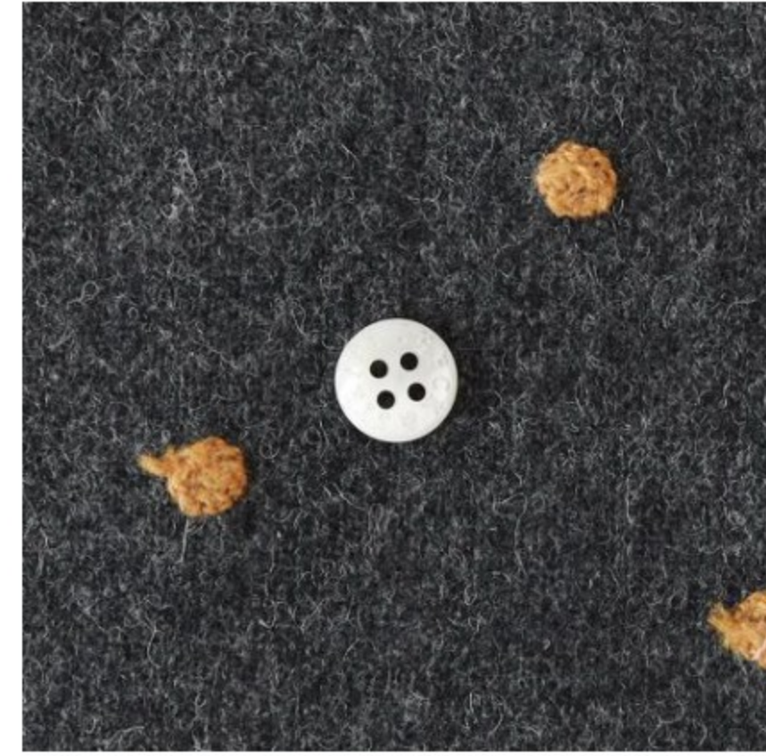
チャコールグレー地にオレンジ