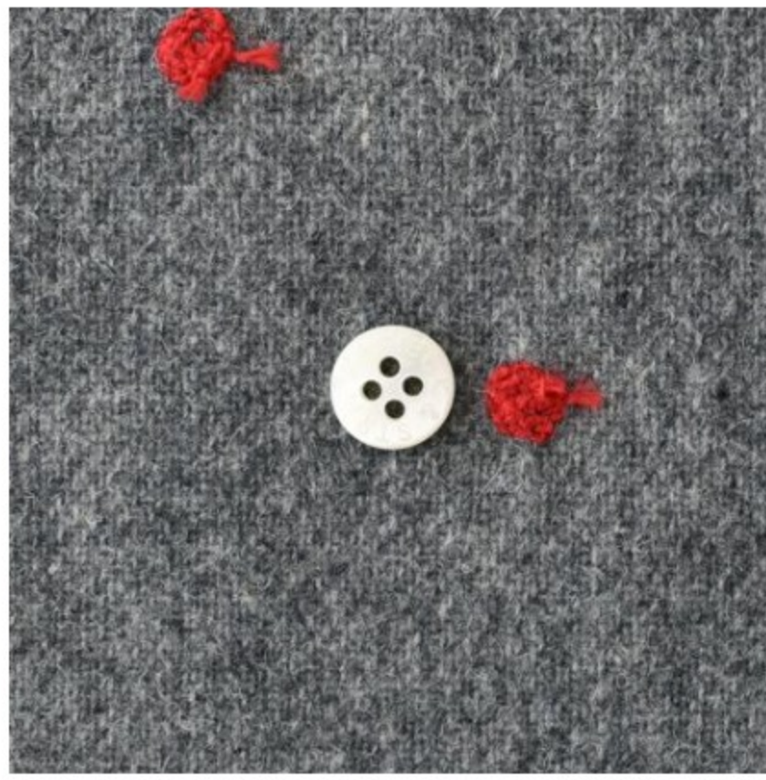
グレー地に赤(新色)