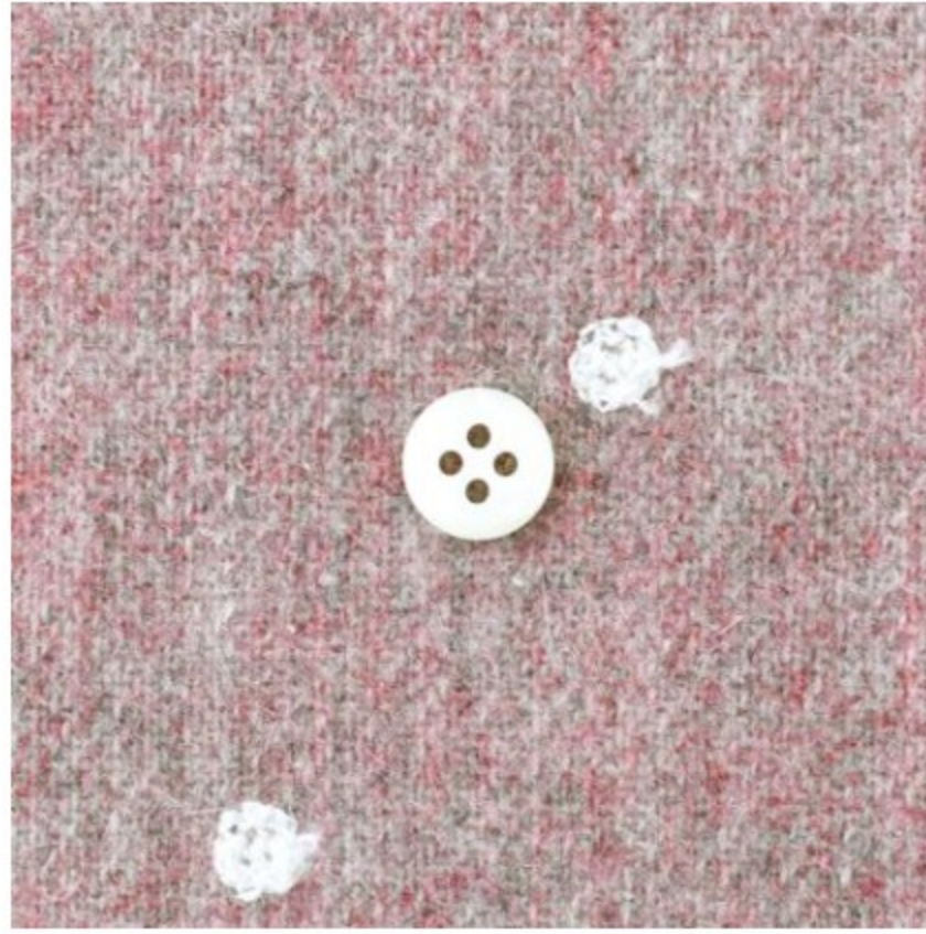
柔ピンク地にオフホワイト