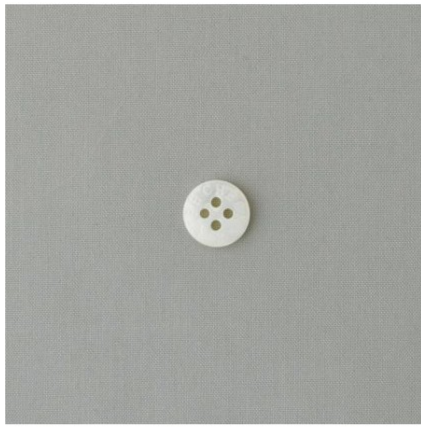
ライトグレージュ