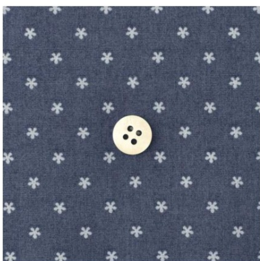
ネイビーラベンダー