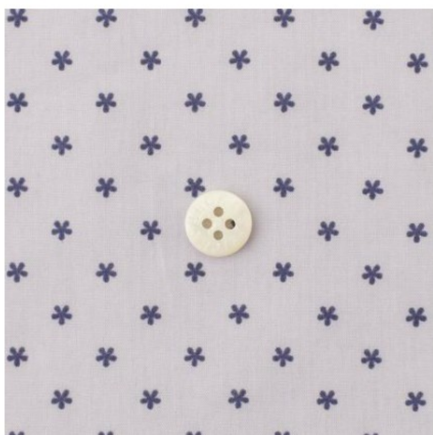
ペールラベンダー