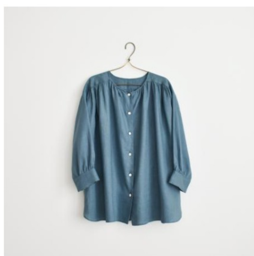
175(七分袖のギャザーブラウス/ワンピース)