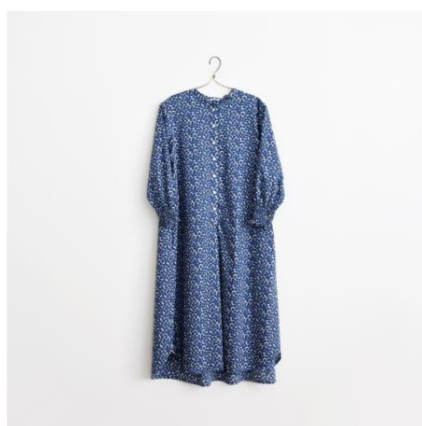
176(スタンドカラーのワンピース)