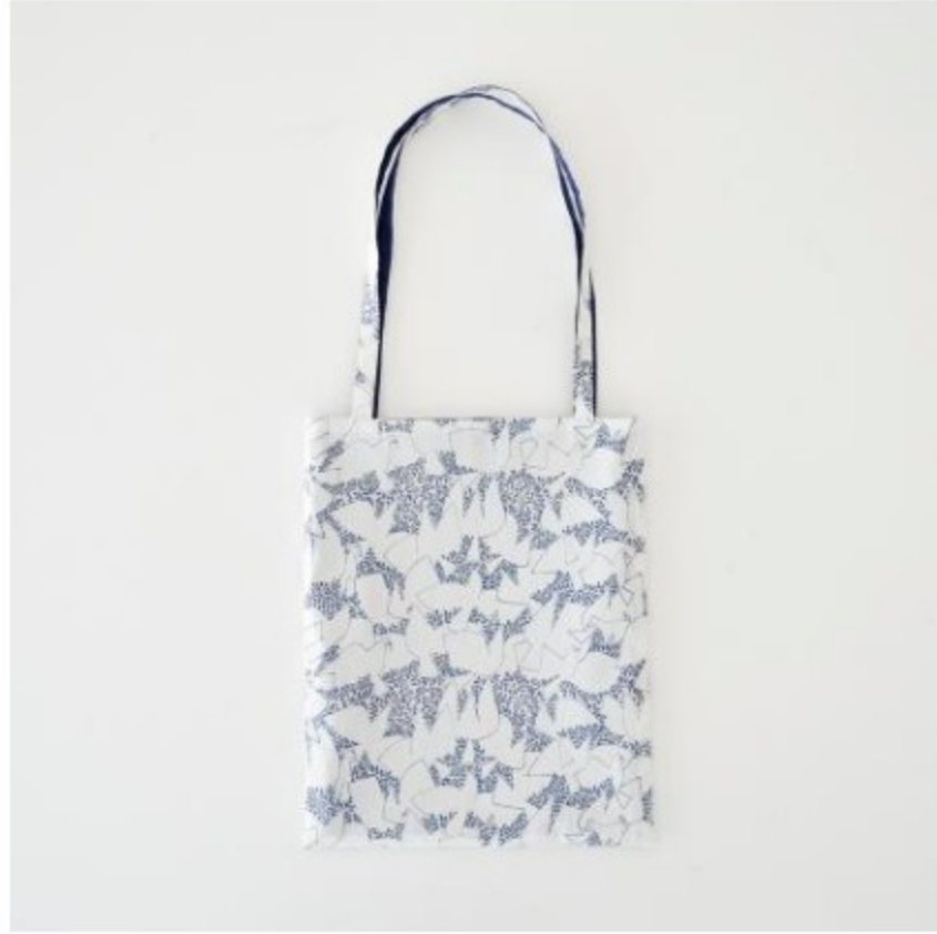
「SLOW」 ホワイト × ブルー