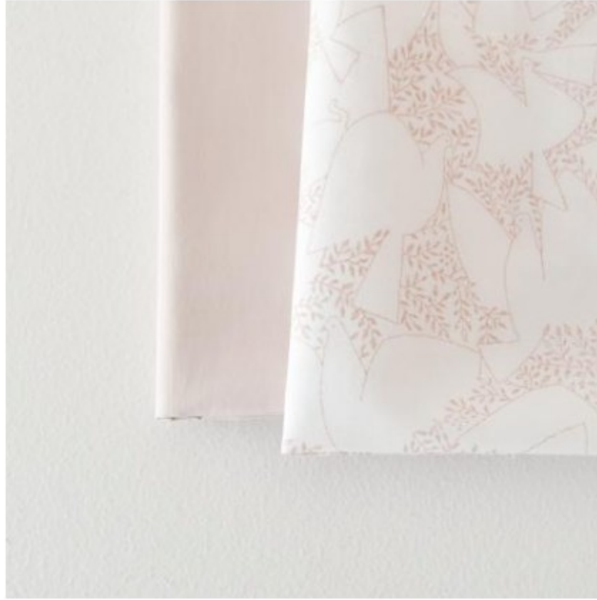
「SLOW」 ホワイト × グレイッシュピンク