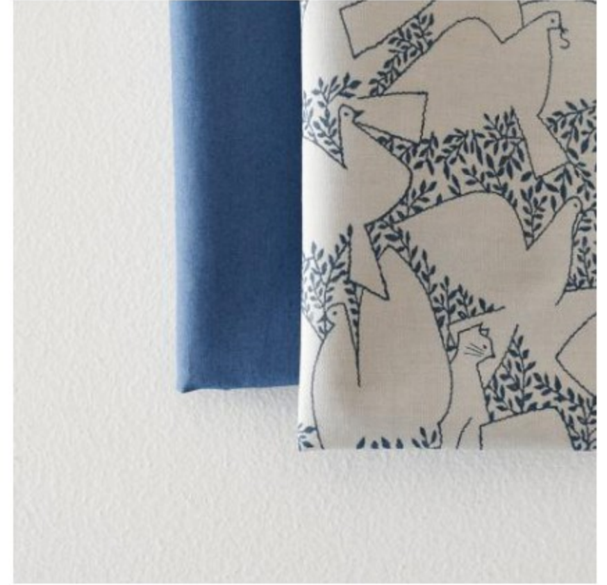
「SLOW」 グレージュ × ダークブルー