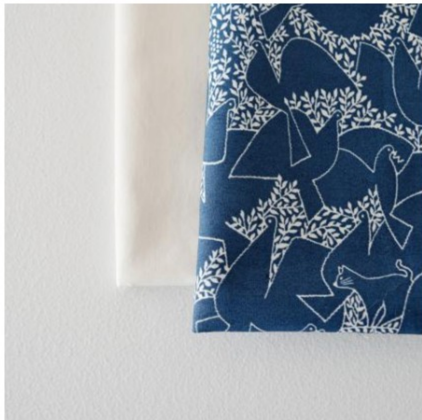
「SLOW」 ダークブルー × きなり色