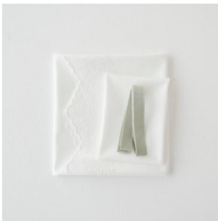
ホワイトにオフホワイト