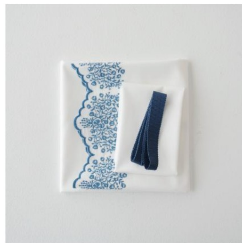
ホワイトにダークブルー