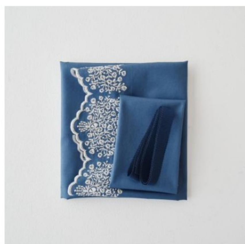
スモークブルーにパールグレー