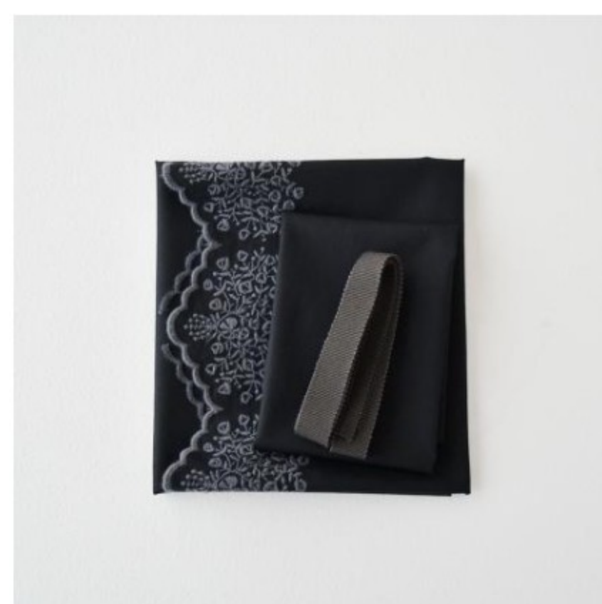
ブラックにミドルグレー