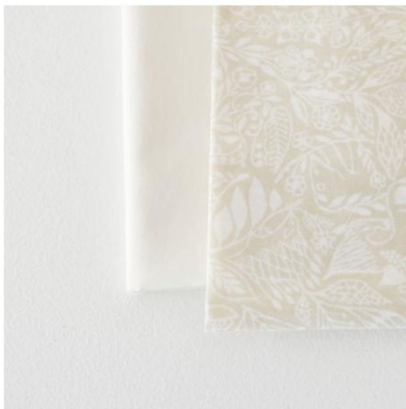
「Seek animals」 ベージュ × ホワイト