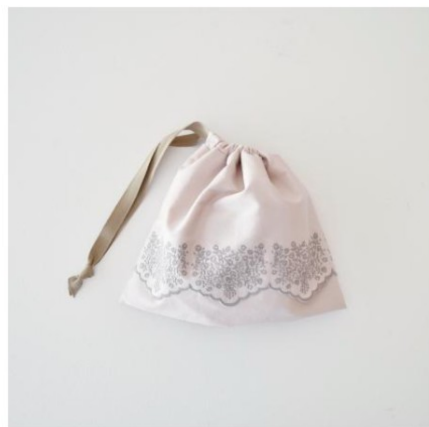
グレイッシュピンクにカシミア