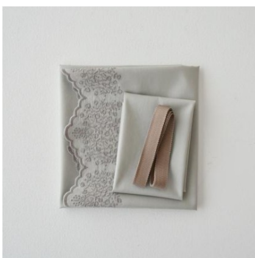
ストーンにカシミア