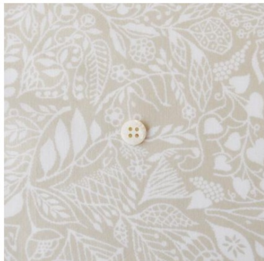
ベージュ × ホワイト