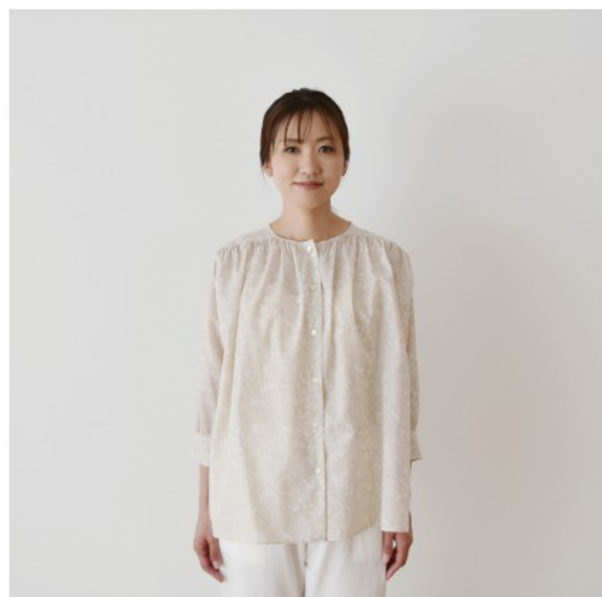
ベージュ×ホワイト:パターン 175(七分袖のギャザーブラウス)