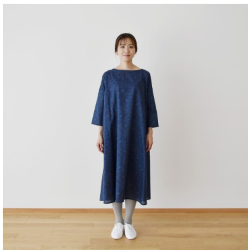
ネイビー×ブルー: 『CHECK&STRIPE Sewing Diary in Paris パリのソーイング ダイアリー』(世界文化社)ポ ートネックのワンピース