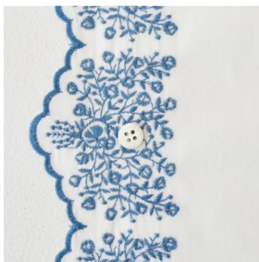
ホワイトにダークブルー