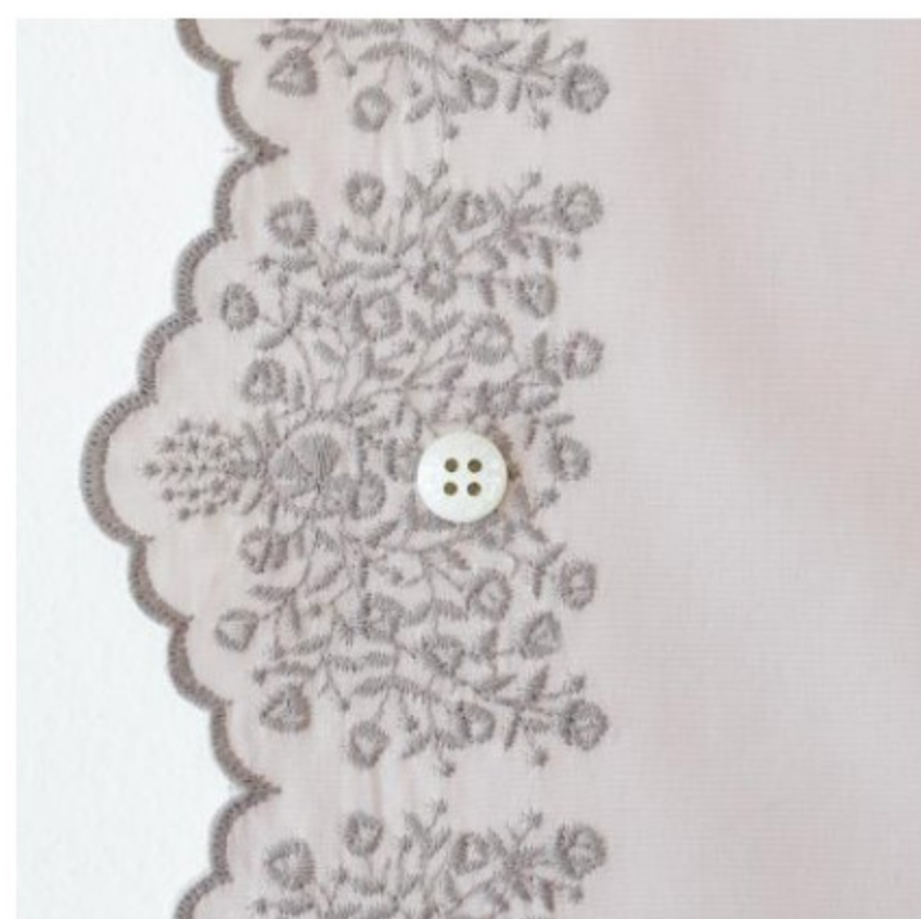
グレイッシュピンクにカシミア