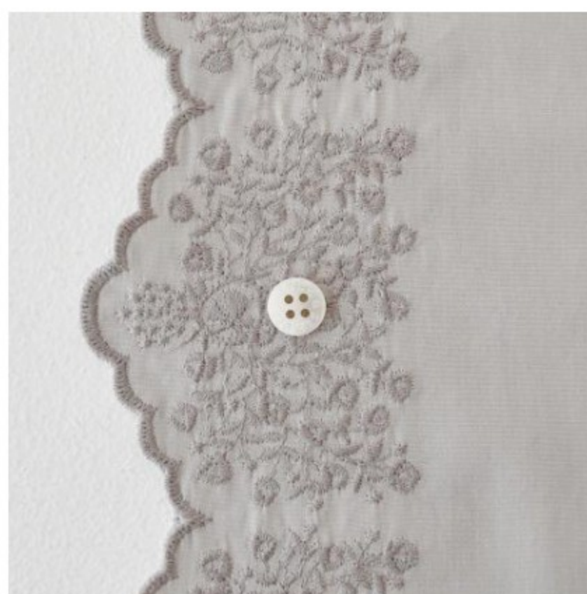
ストーンにカシミア