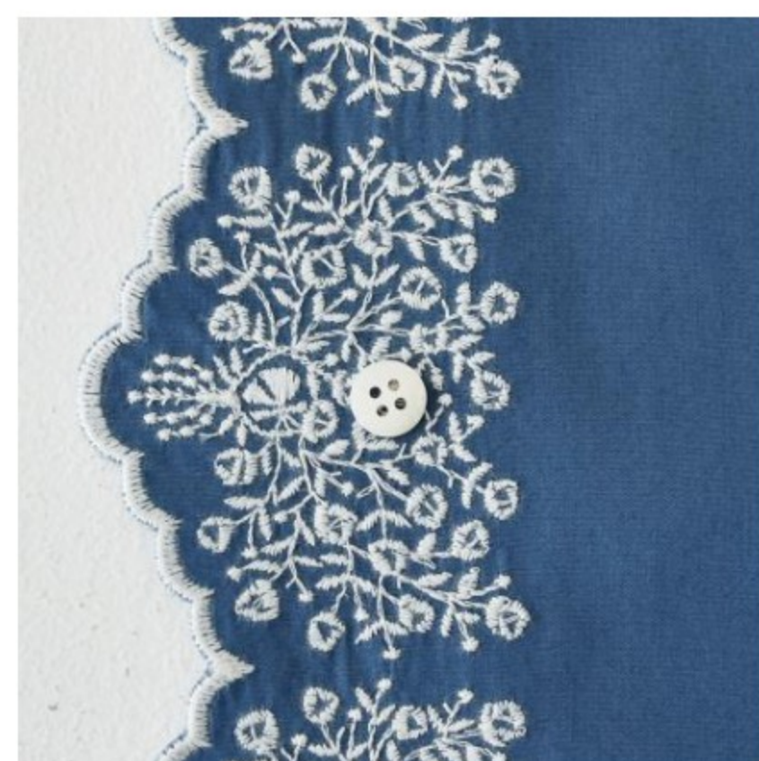
スモークブルーにパールグレー