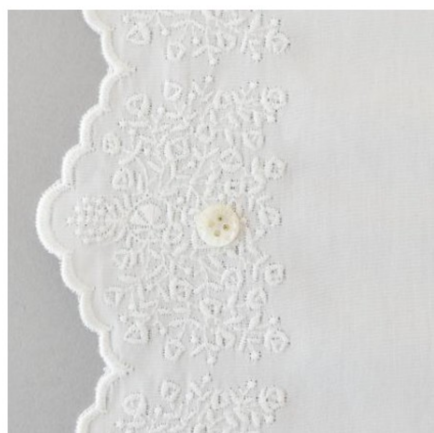
ホワイトにオフホワイト