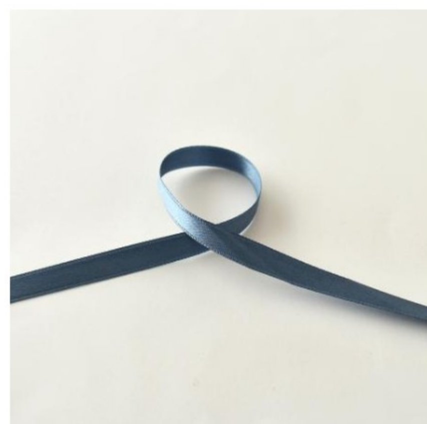
361(グレイッシュブルー)