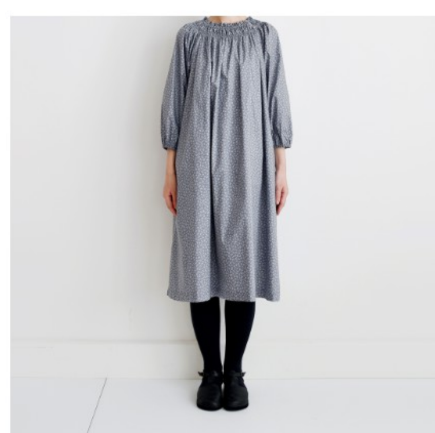
ラベンデューラ地にマッシュルーム:『CHECK&STRIPE SEW HAPPY』(世界文化社) ゴムシャーリングのワンピース 大人