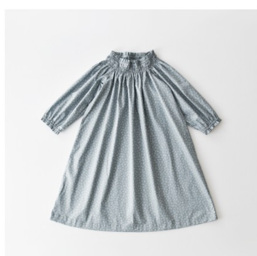
スモークブルーグレー地にマッシュルーム:『CHECK&STRIPE SEW HAPPY』(世界文化社)ゴムシャーリングのワンピース 子ども