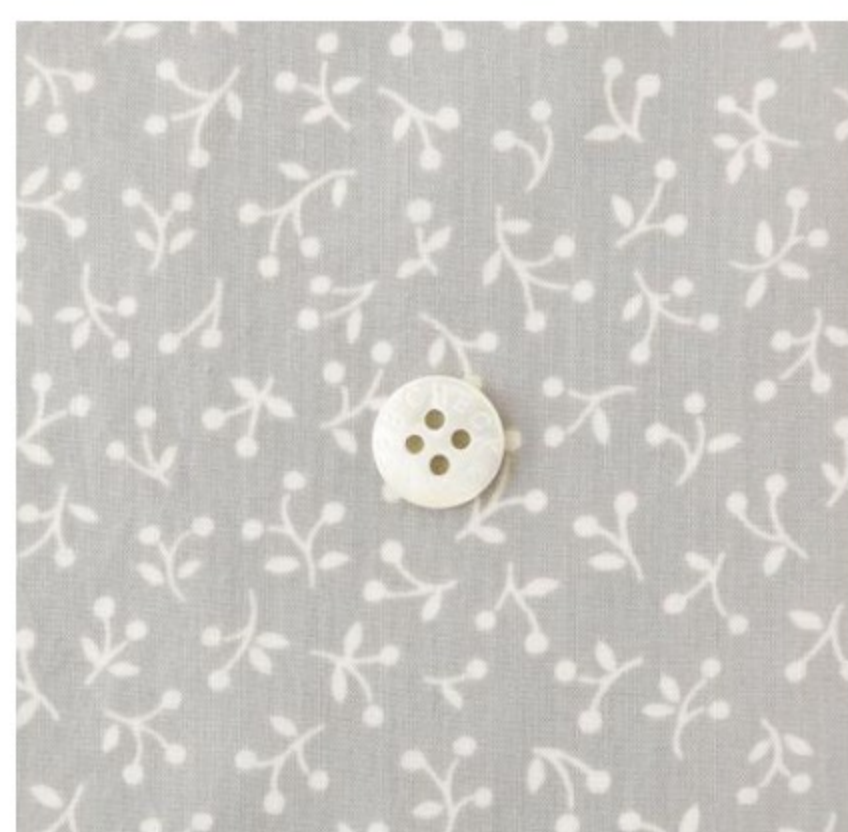
ストーン地にマッシュルーム