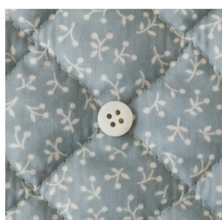
スモークブルーグレー地にマッシュルーム