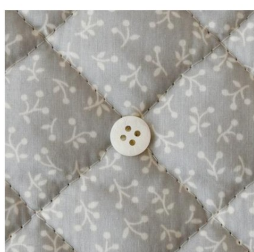
ストーン地にマッシュルーム