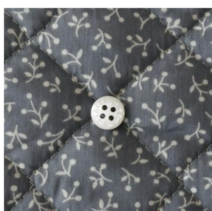
ダークグレー地にマッシュルーム