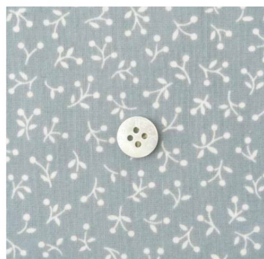
スモークブルーグレー地にマッシュルーム