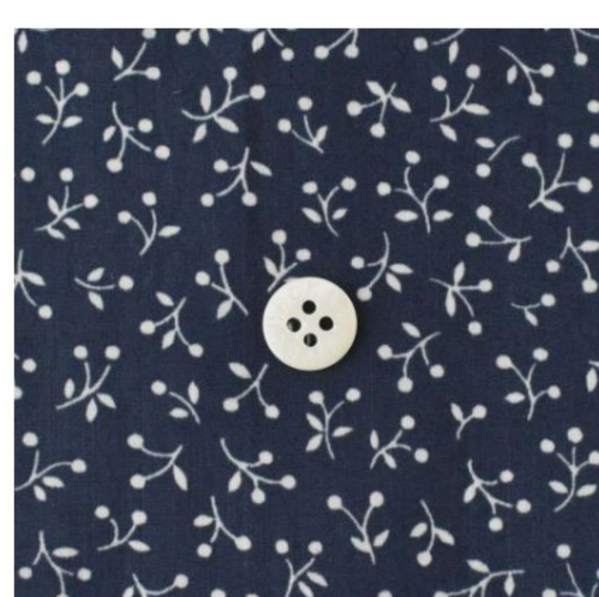
ネイビー地にマッシュルーム