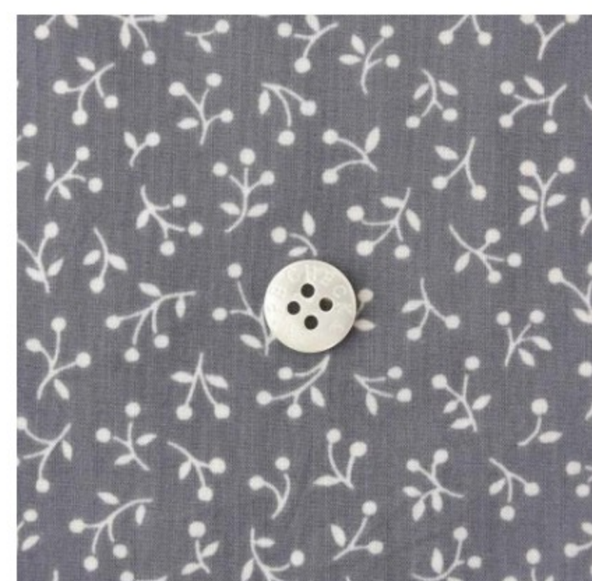
ラベンデューラ地にマッシュルーム