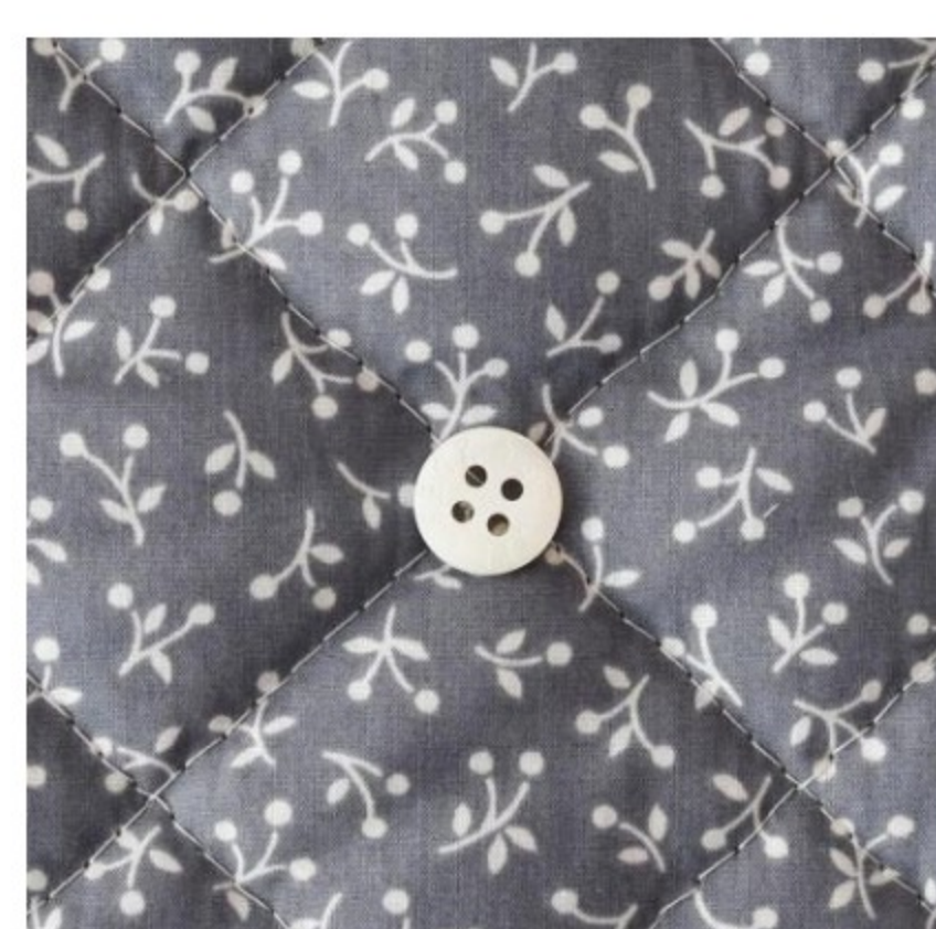
ラベンデューラ地にマッシュルーム