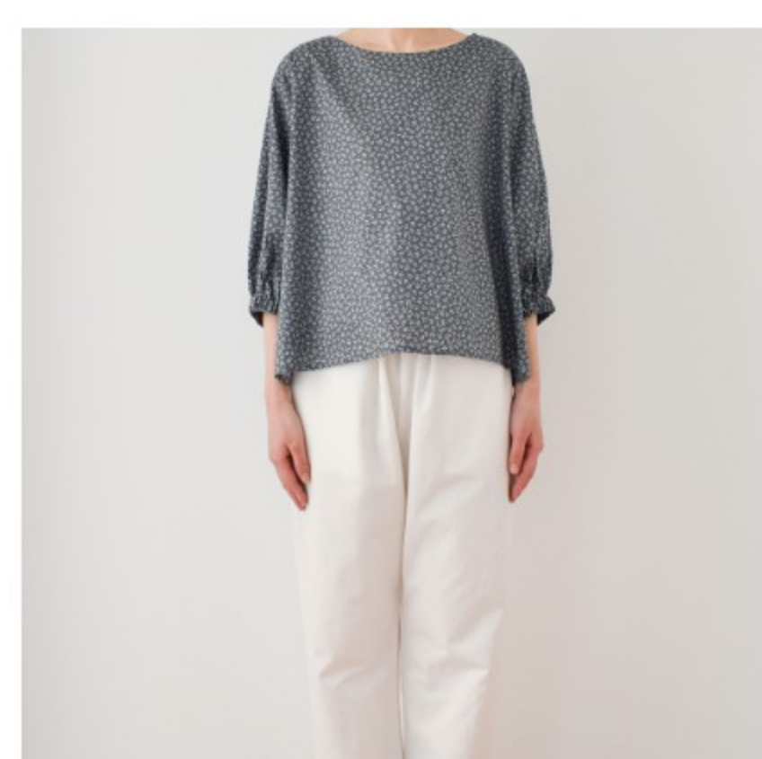
ダークグレー地にマッシュルーム:『CHECK&STRIPEのおとな服 ソーイング・レメディー』(文化出版局)バルーンスリーブのブラウス