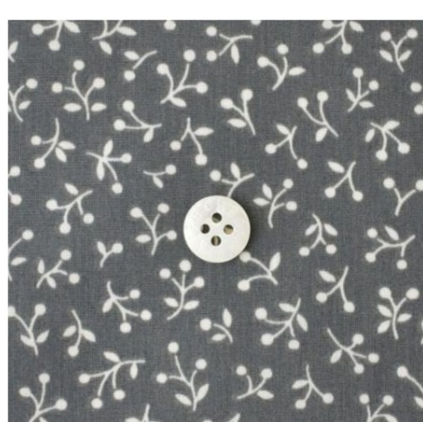
ダークグレー地にマッシュルーム