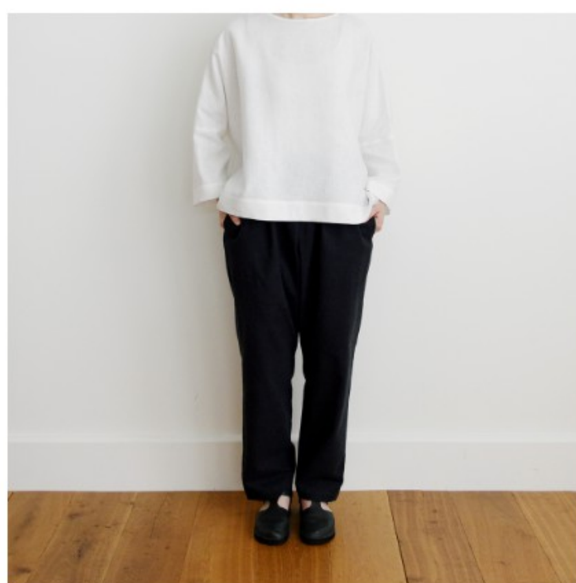
木いちご:『CHECK&STRIPE SEW HAPPY』(世界文化社) デイリーパンツ