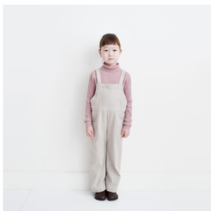
ソイラテ:『CHECK&STRIPEの子ども服 ソーイング・ナーサリー』(文化出版局) デイリーオーバーオール