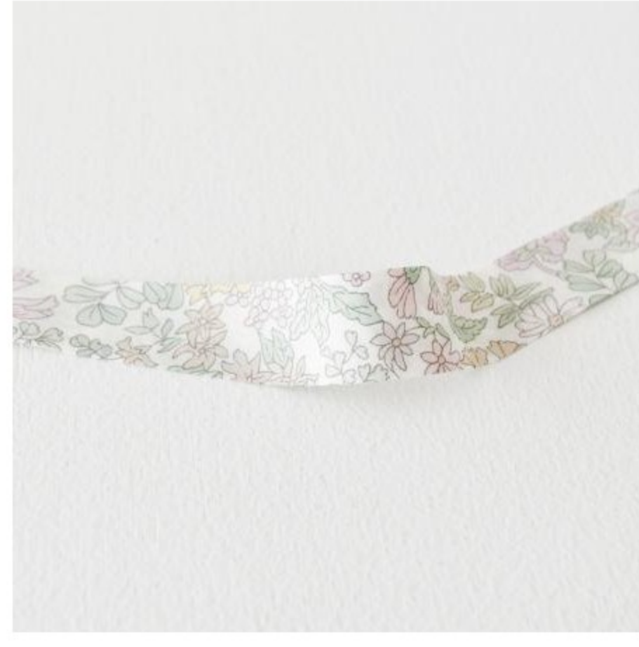
Emily バイアステープ(3色)