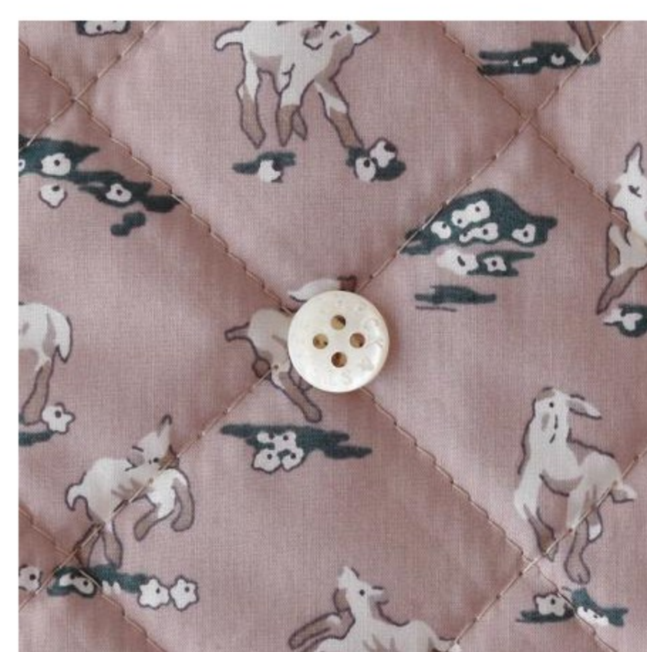
Whistler キルティング(3 色)