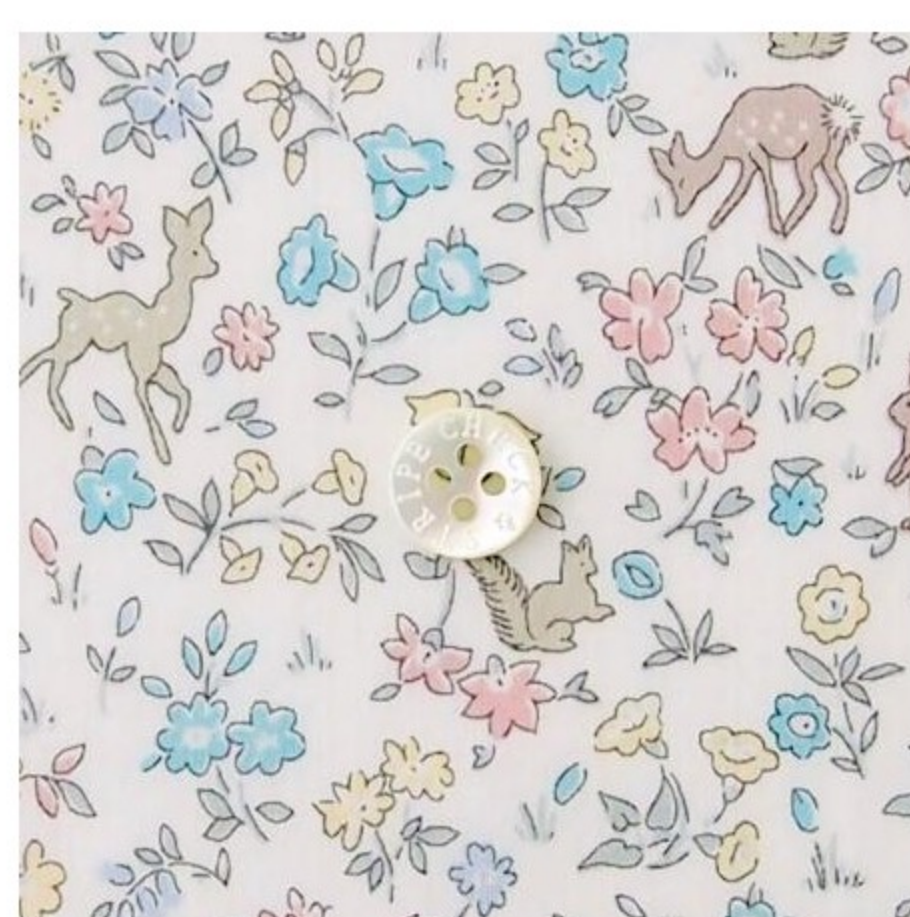
Meadow Tails コーティ ング(4色)