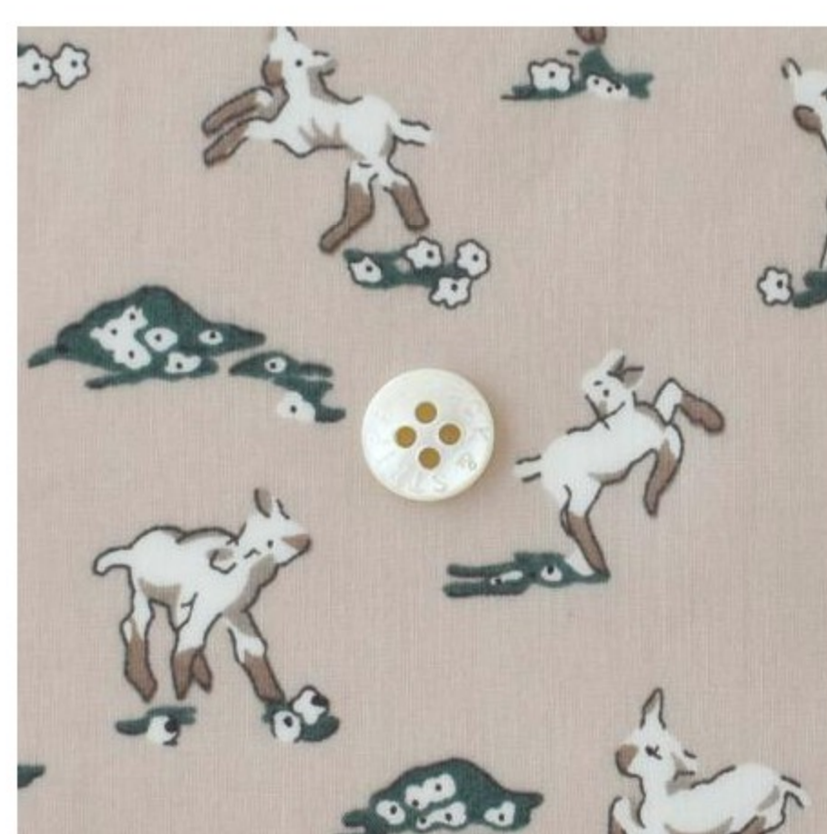
Whistler コーティング(3 色)