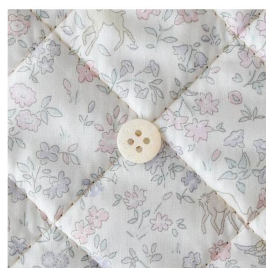
Meadow Tails キルティ ング(4色)