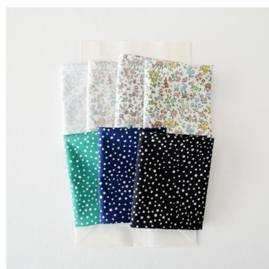
カットクロスセット