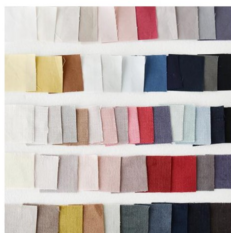
ご紹介のリバティプリントに 合うCHECK&STRIPEオリジ ナルのリネンやコットン(58 items)