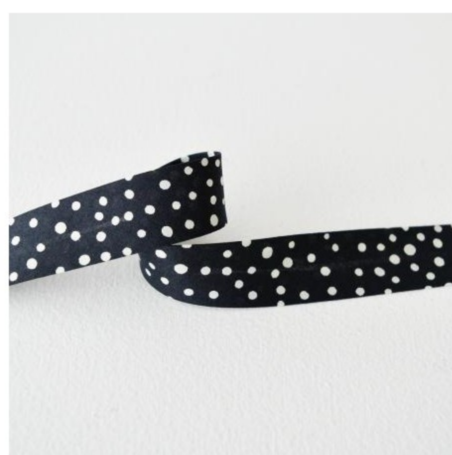
Fenton バイアステープ(3 色)