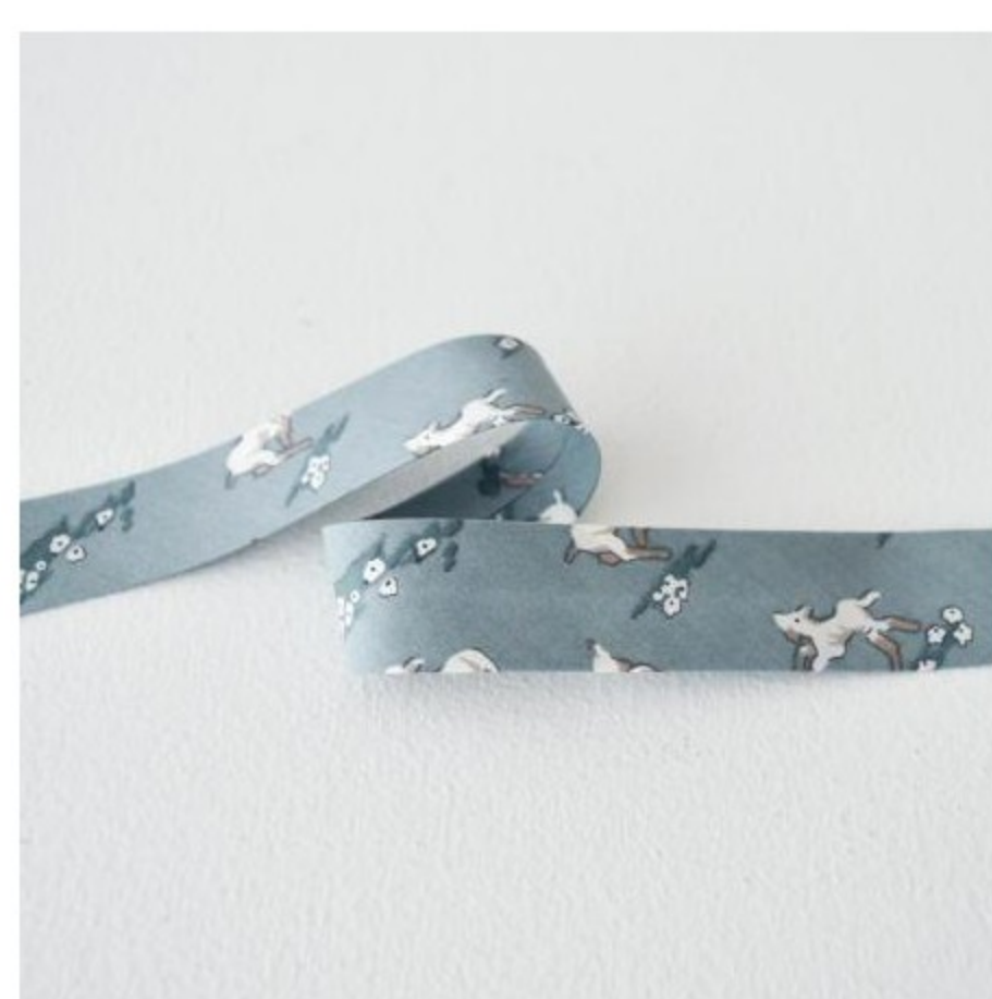
Whistler バイアステープ(3 色)