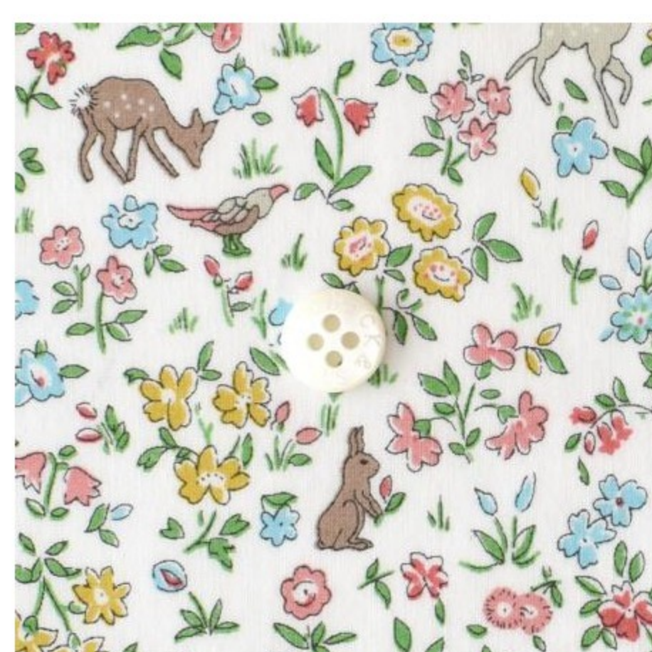
Meadow Tails タナローン (4色)