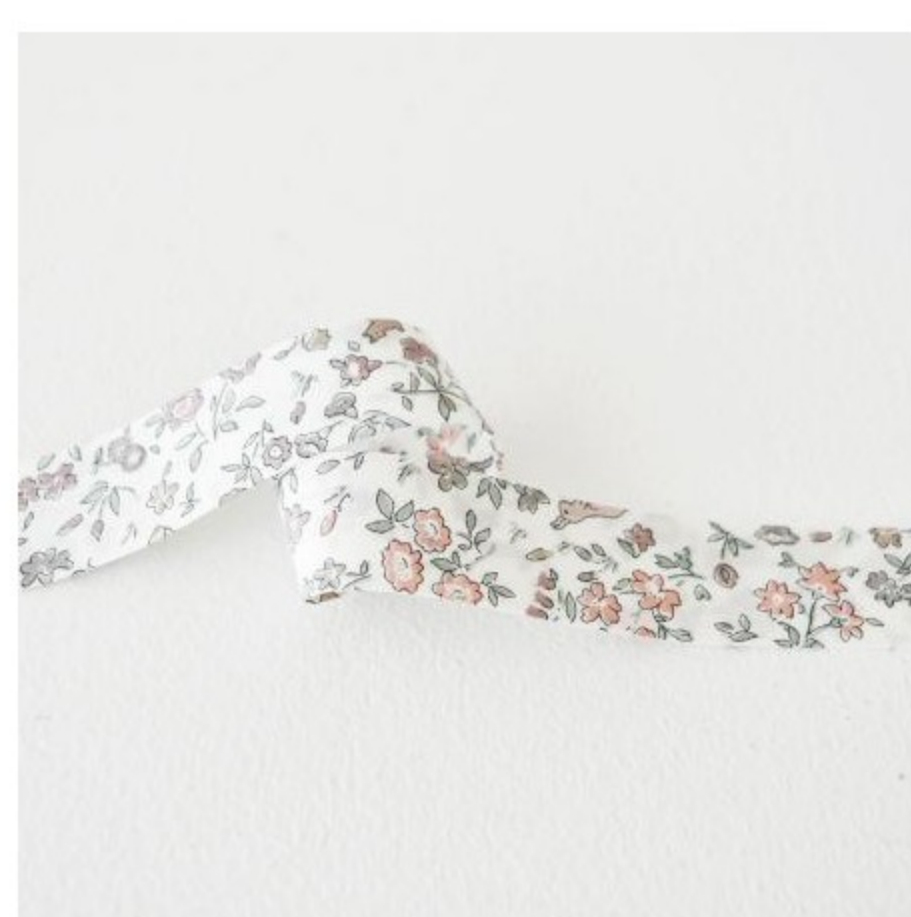
Meadow Tails バイアステ ープ(4色)