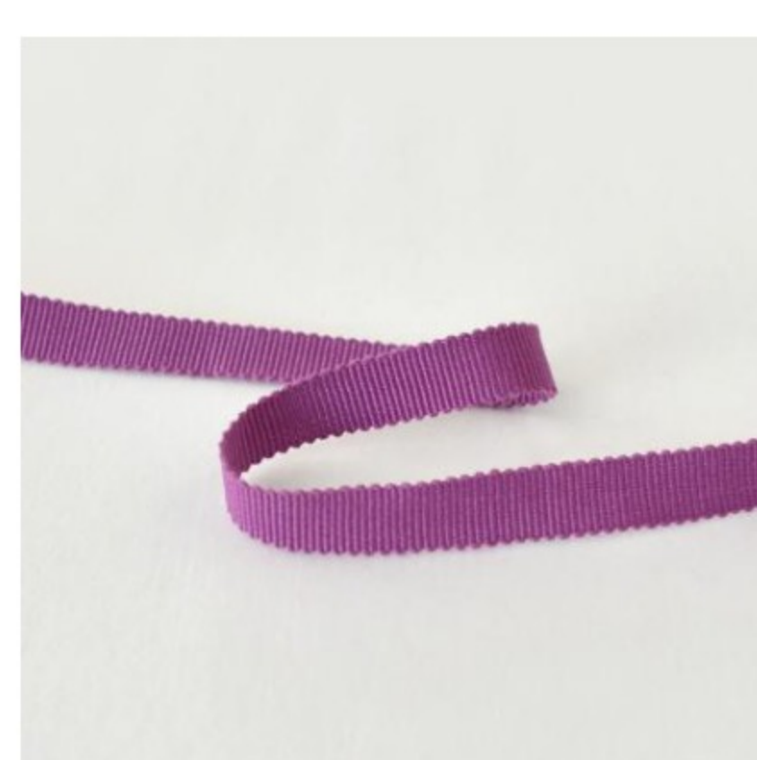
443(ピンクラズベリー)