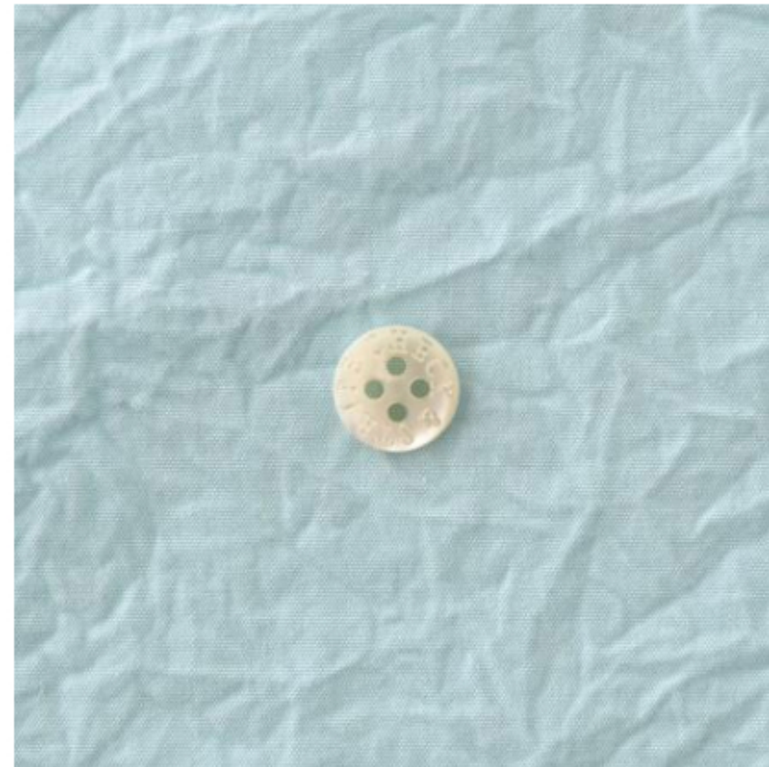
ペパーミントブルー