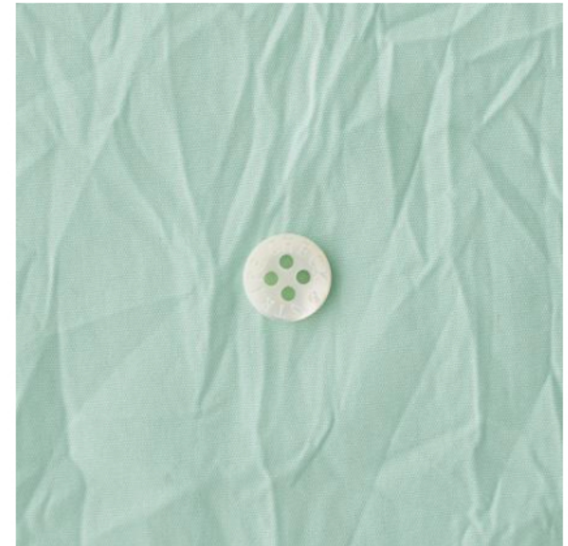
パステルグリーン