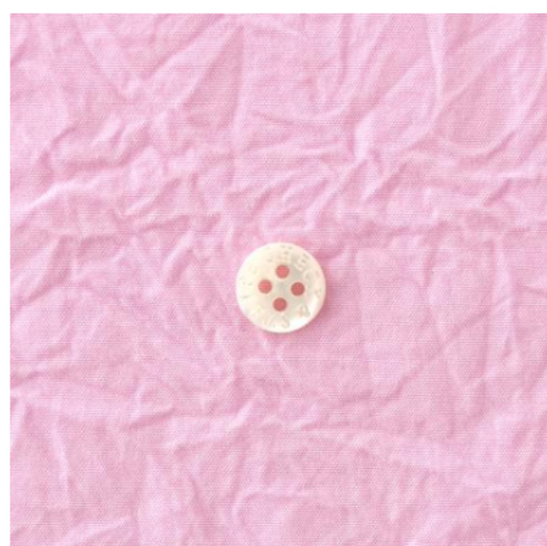
キャンディピンク