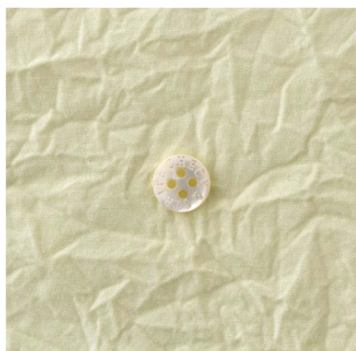
ピスタチオクリーム