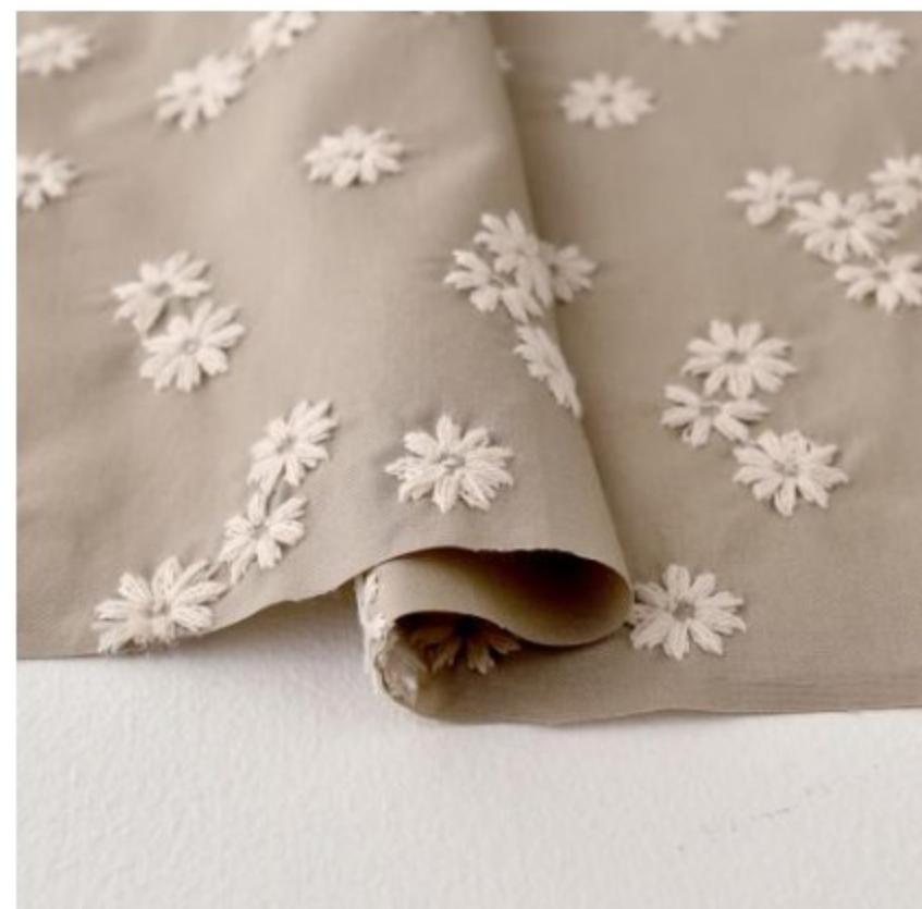
ソイラテにアイボリー