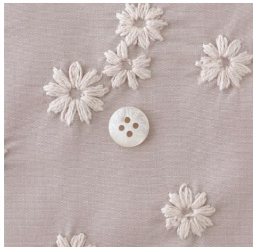
あずきクリームにシェルホワイト