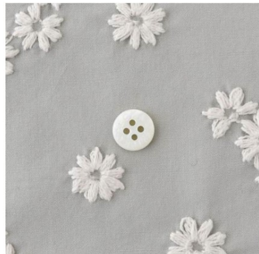
ストーンにアイボリー