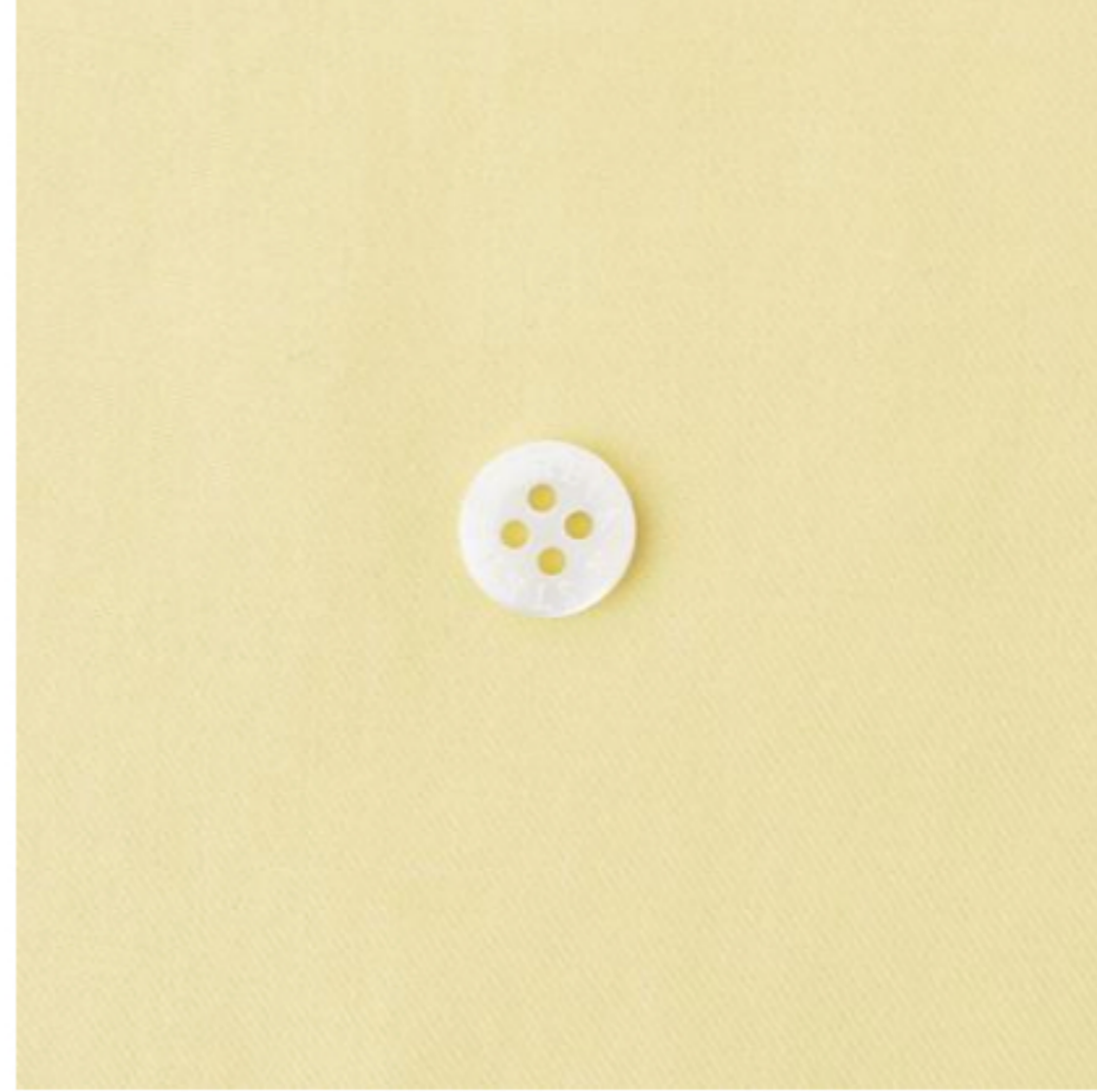
カナリーイエロー