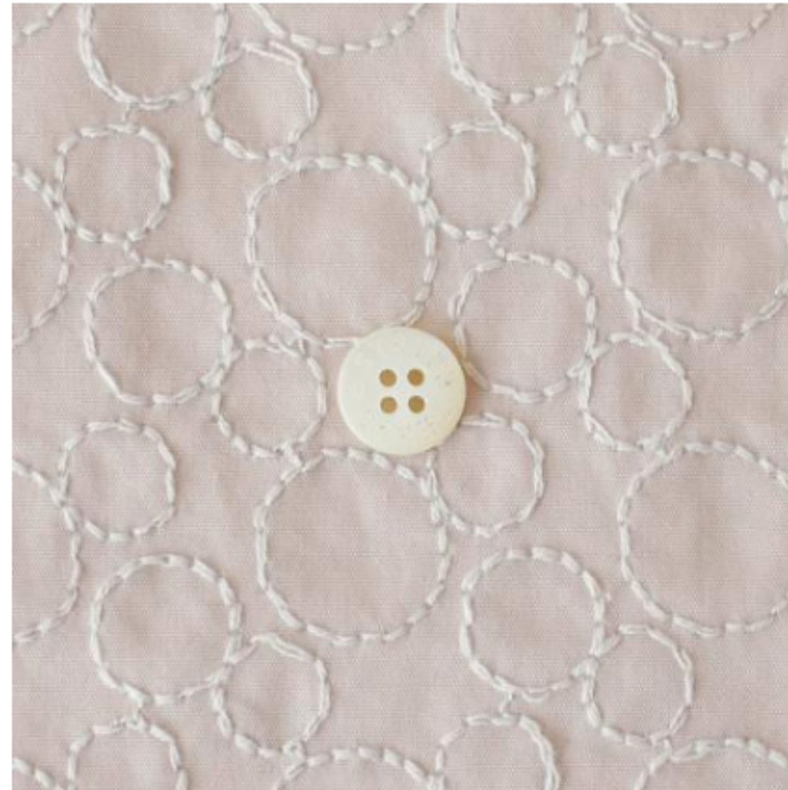
グレイッシュピンクにペールグレー