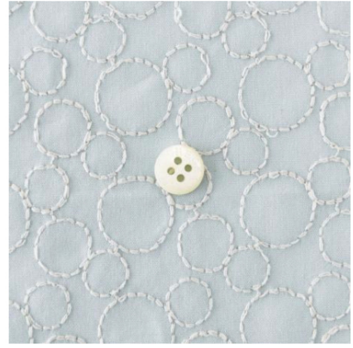
ペパーミントにペールグレー