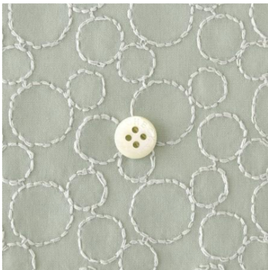
ミンティーにペールグレー