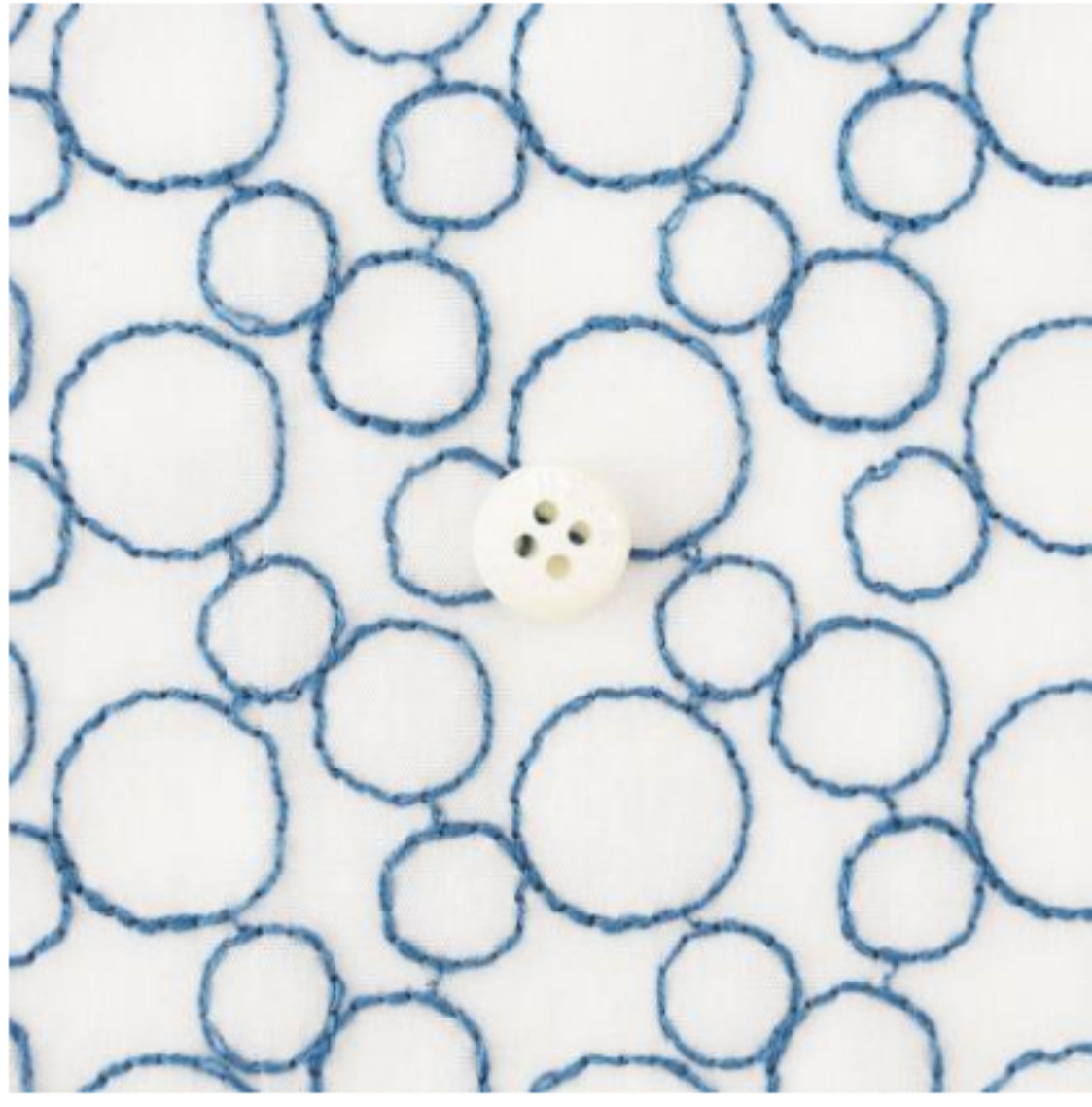
ホワイトにダークブルー