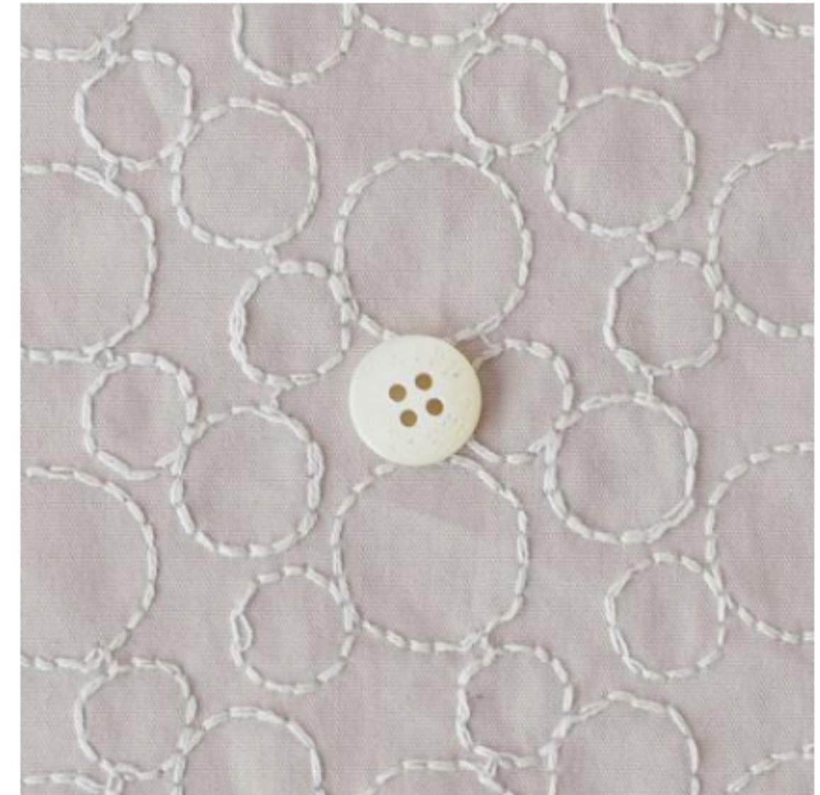
あずきクリームにペールグレー