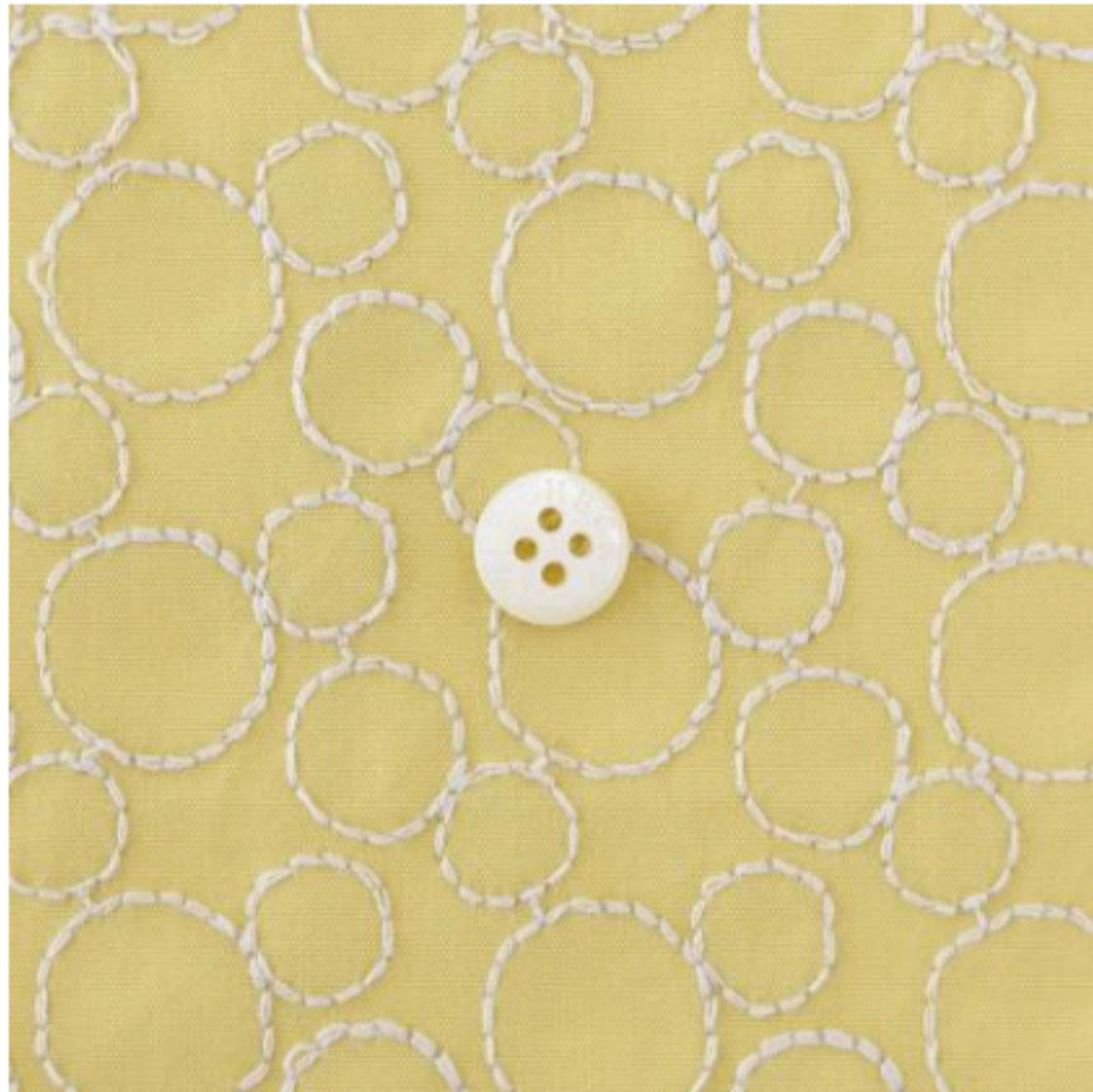
カナリーイエローにペールグレー