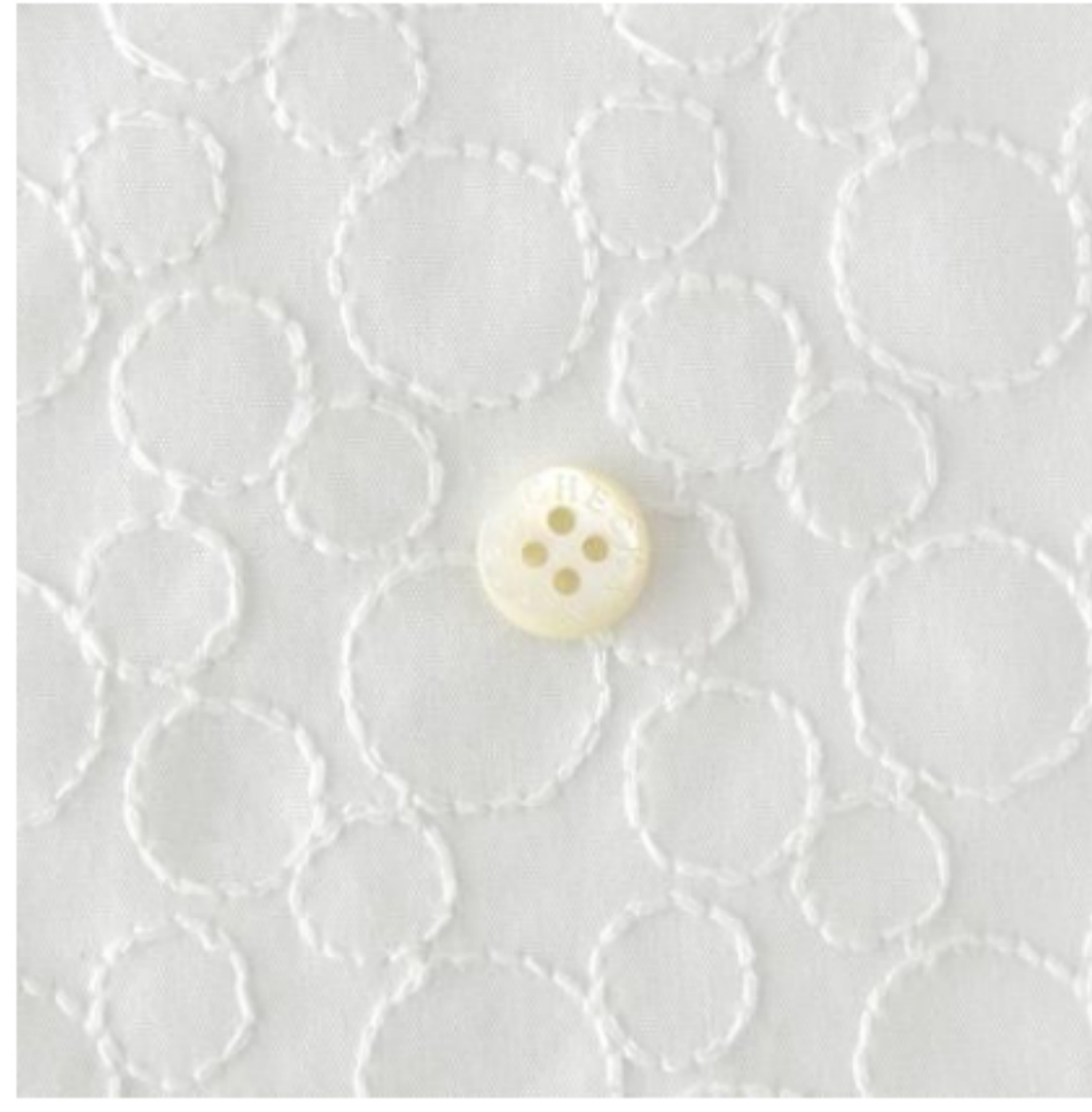
ホワイトにオフホワイト