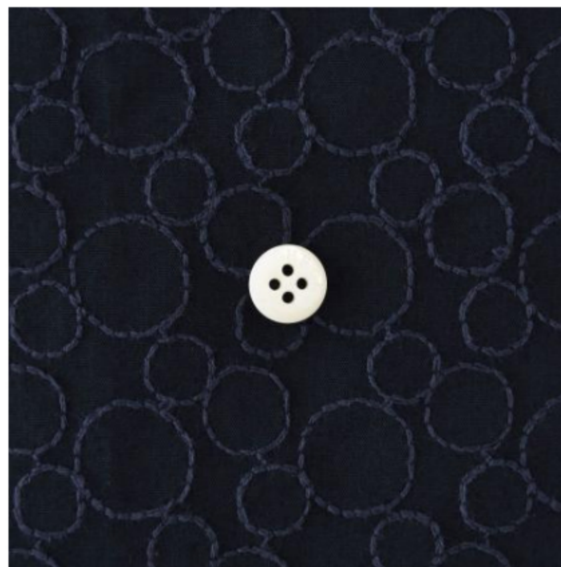
スタンダードネイビーにインクブルー