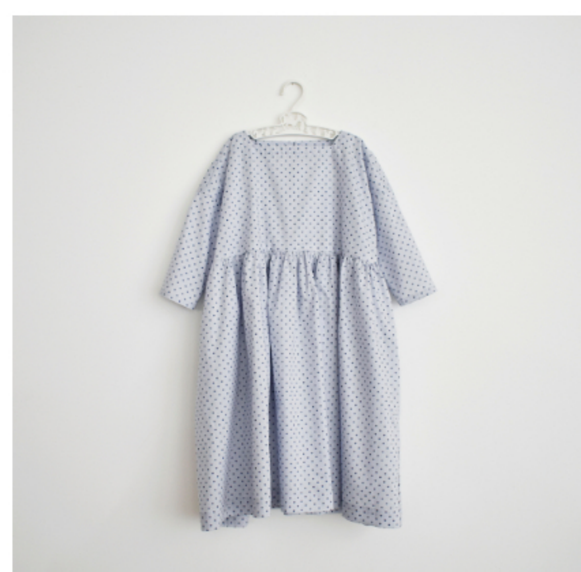
パールラベンダー: 『CHECK&STRIPEの子ども服 ソーイング・ナーサリー』(文化 出版局) スクエアネックのギャザ ーワンピース