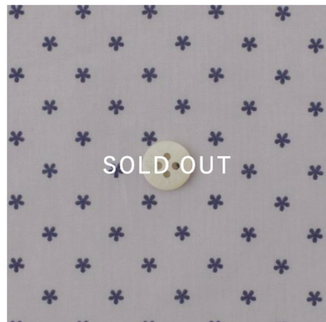
パールラベンダー