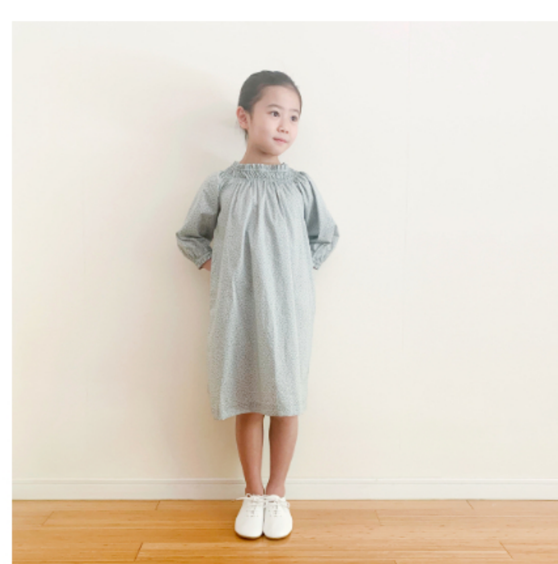
スモークブルーグレー地: 『CHECK&STRIPE SEW HAPPY』(世界文化社) ゴムシ ャーリングのワンピース 子ども