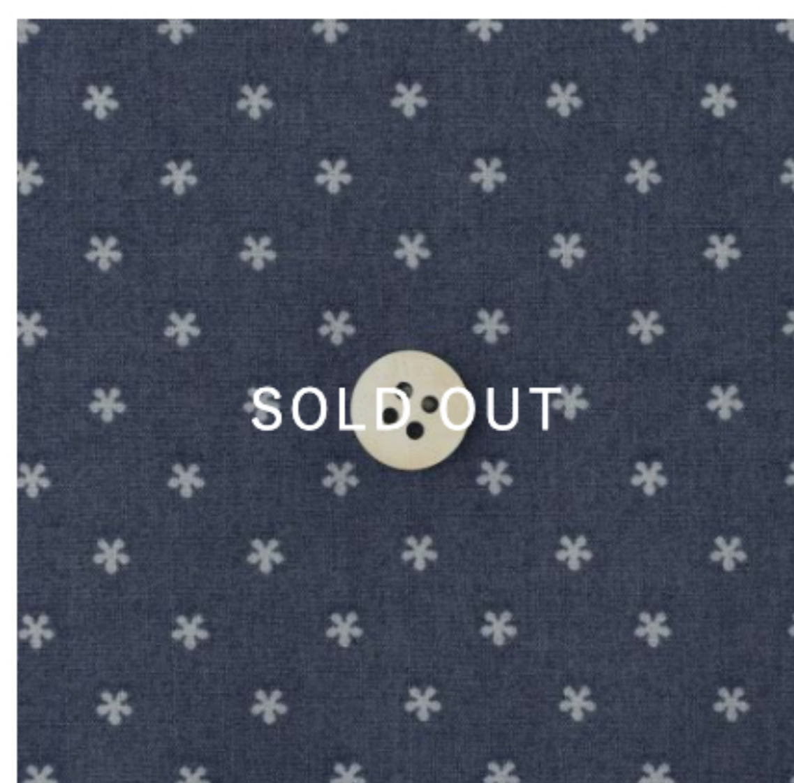
ネイビーラベンダー