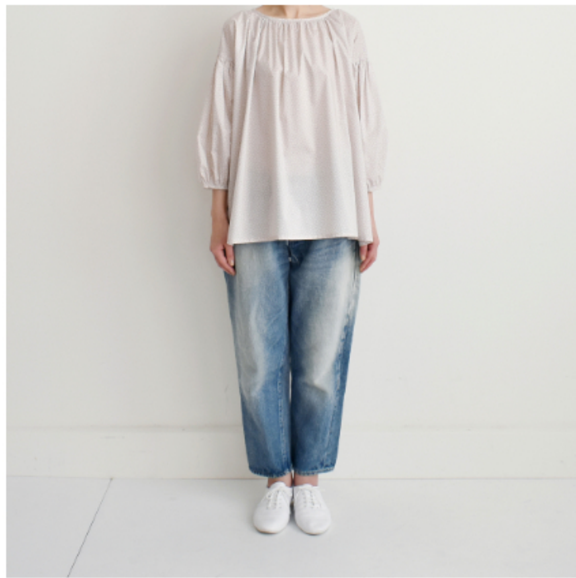
グレイッシュピンク地にマッシュルーム:『CHECK&STRIPEのおとな服 ソーイング・レメディ―』(文化出版局) スタンダードギャザーブラウス