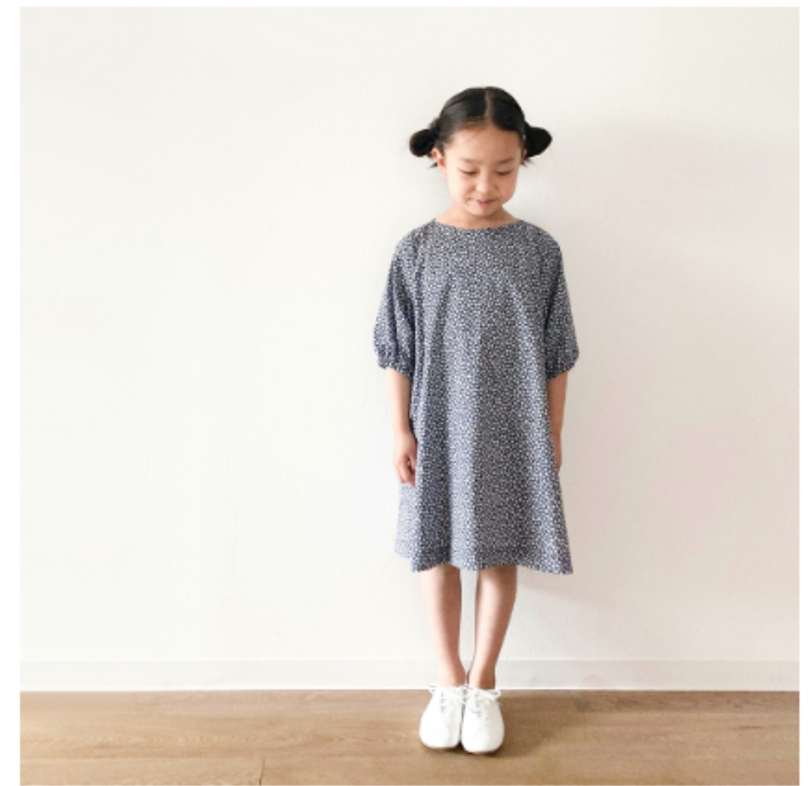
ネイビー地にマッシュルームとピンク:『CHECK&STRIPEの子ども服 ソーイング・ナーサリー』(文化出版局) バルーンスリーブのワンピース