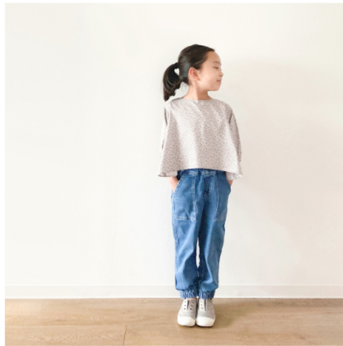
あずきミルク地にマッシュルームとピンク:『CHECK&STRIPEの子ども服 ソーイング・ナーサリー』(文化出版局) バルーンスリーブのブラウス