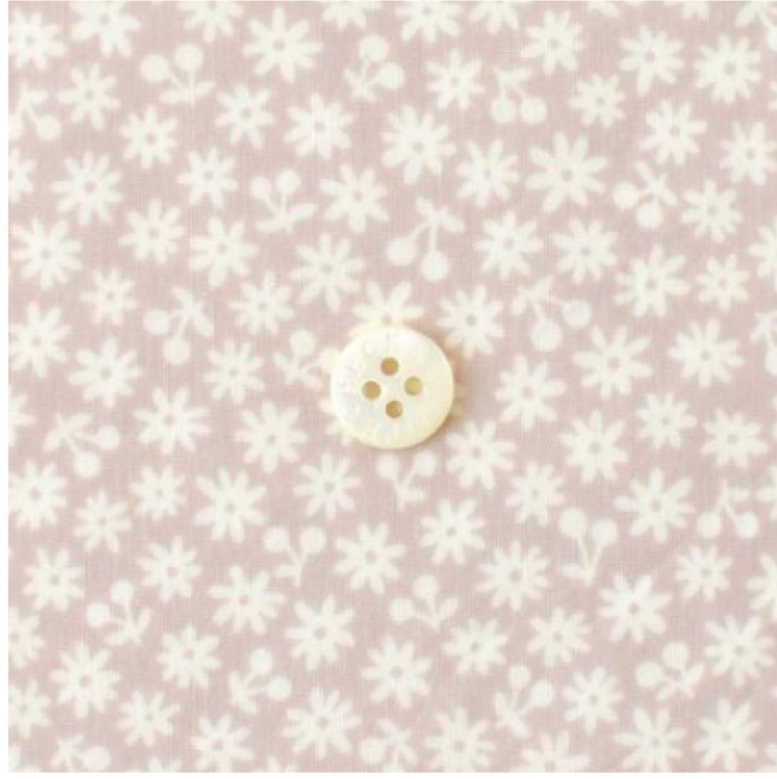
グレイッシュピンク地にマッシュルーム