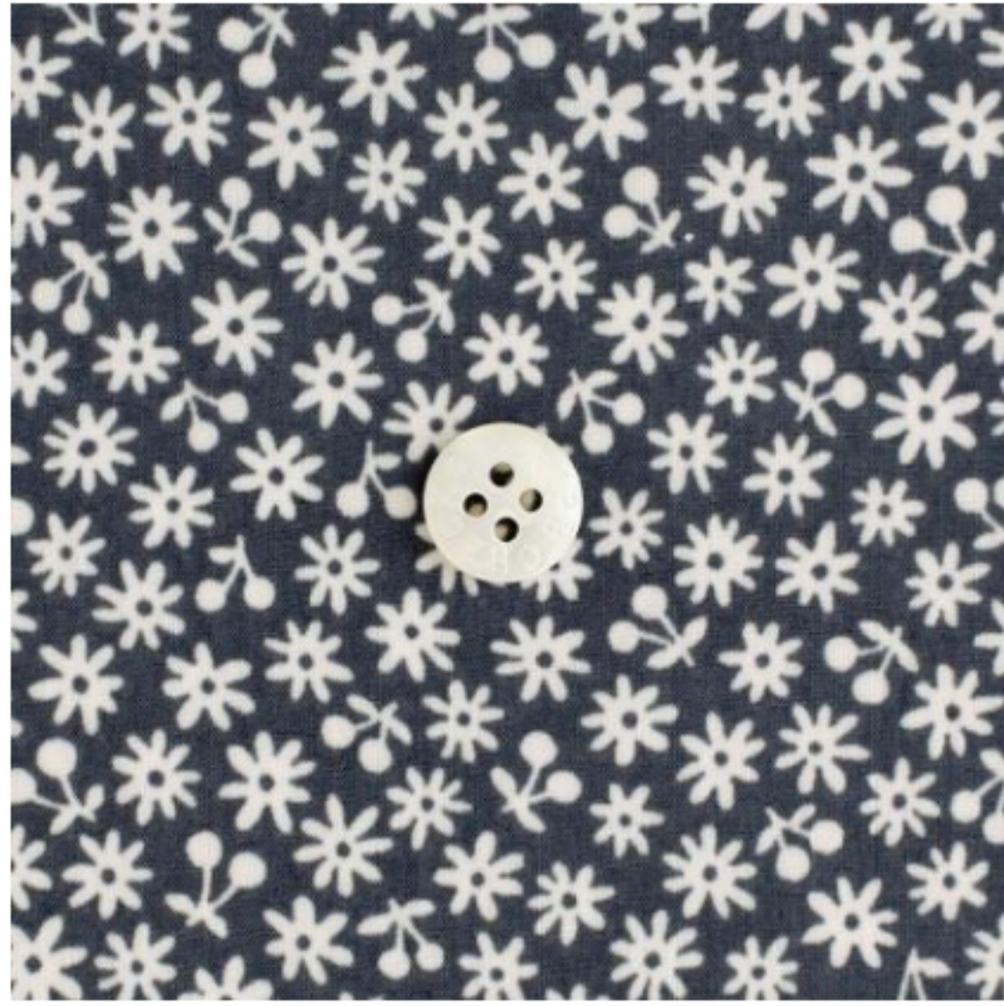
ダークグレー地にマッシュルーム