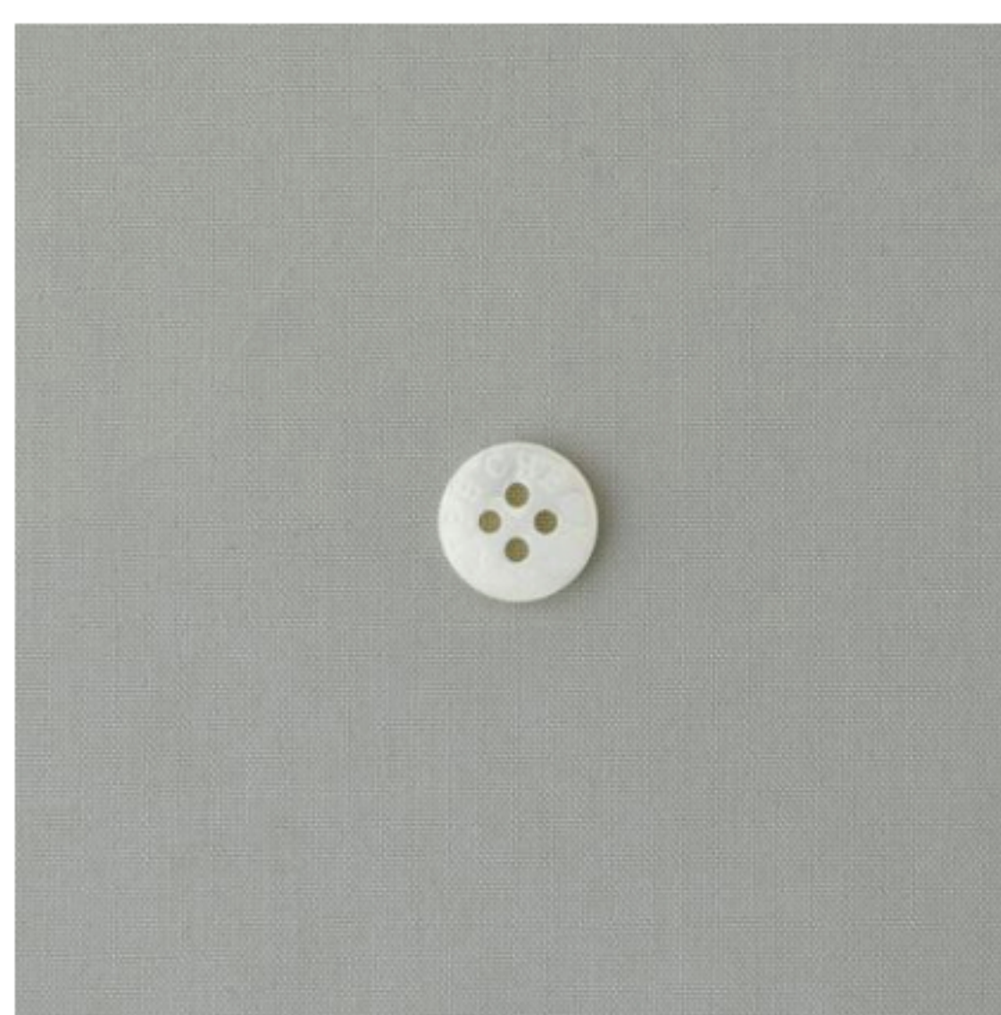
ライトグレージュ