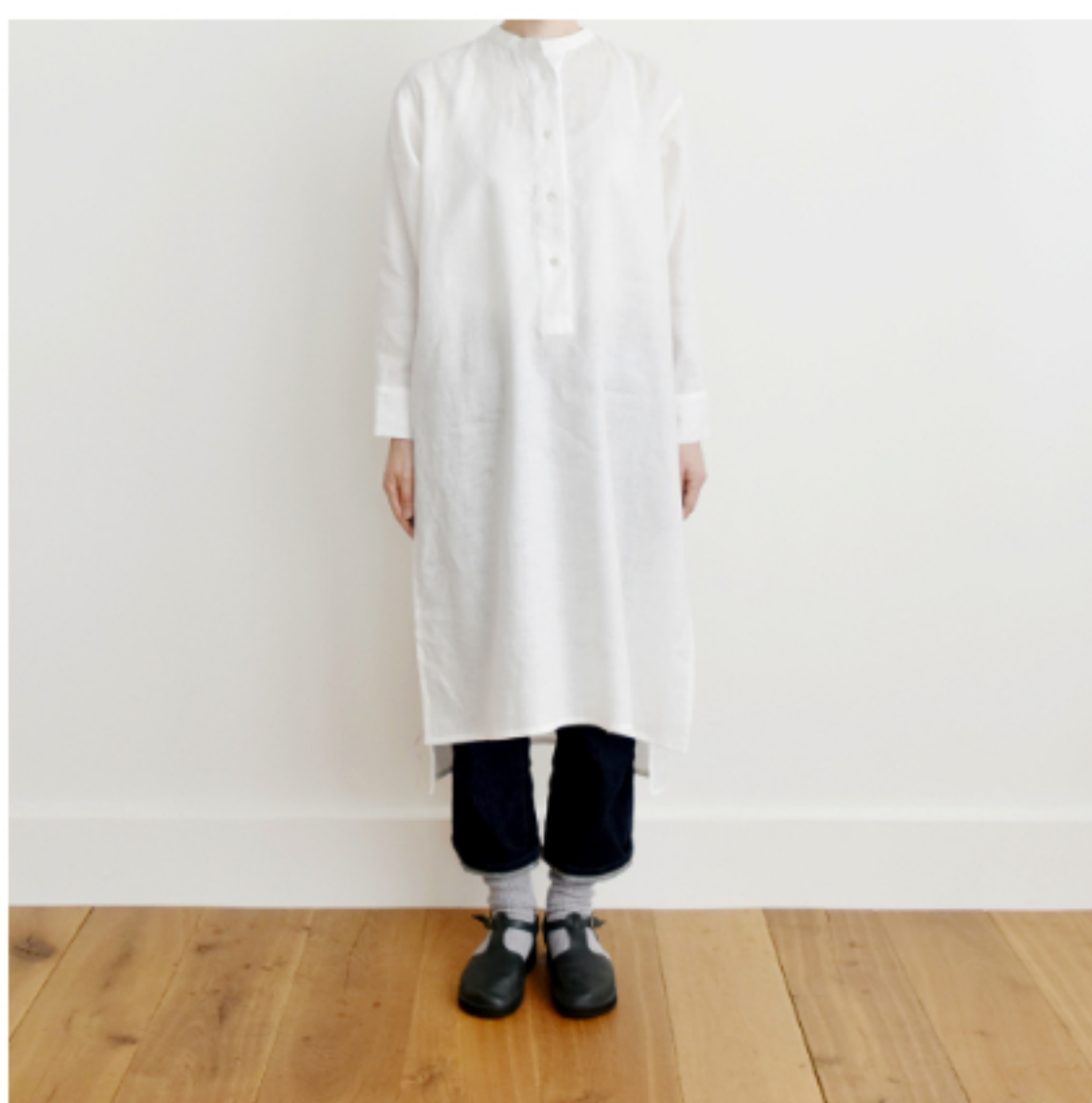
ホワイト:『CHECK&STRIPE SEW HAPPY』(世界文化社)ヘンリーネックのシャツワンピース