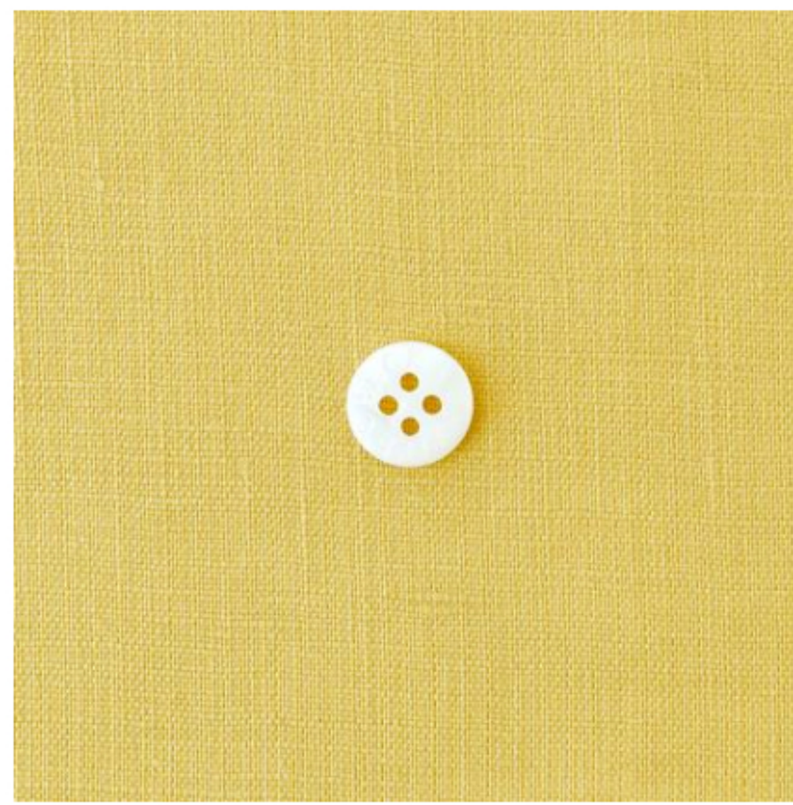
カナリーイエロー