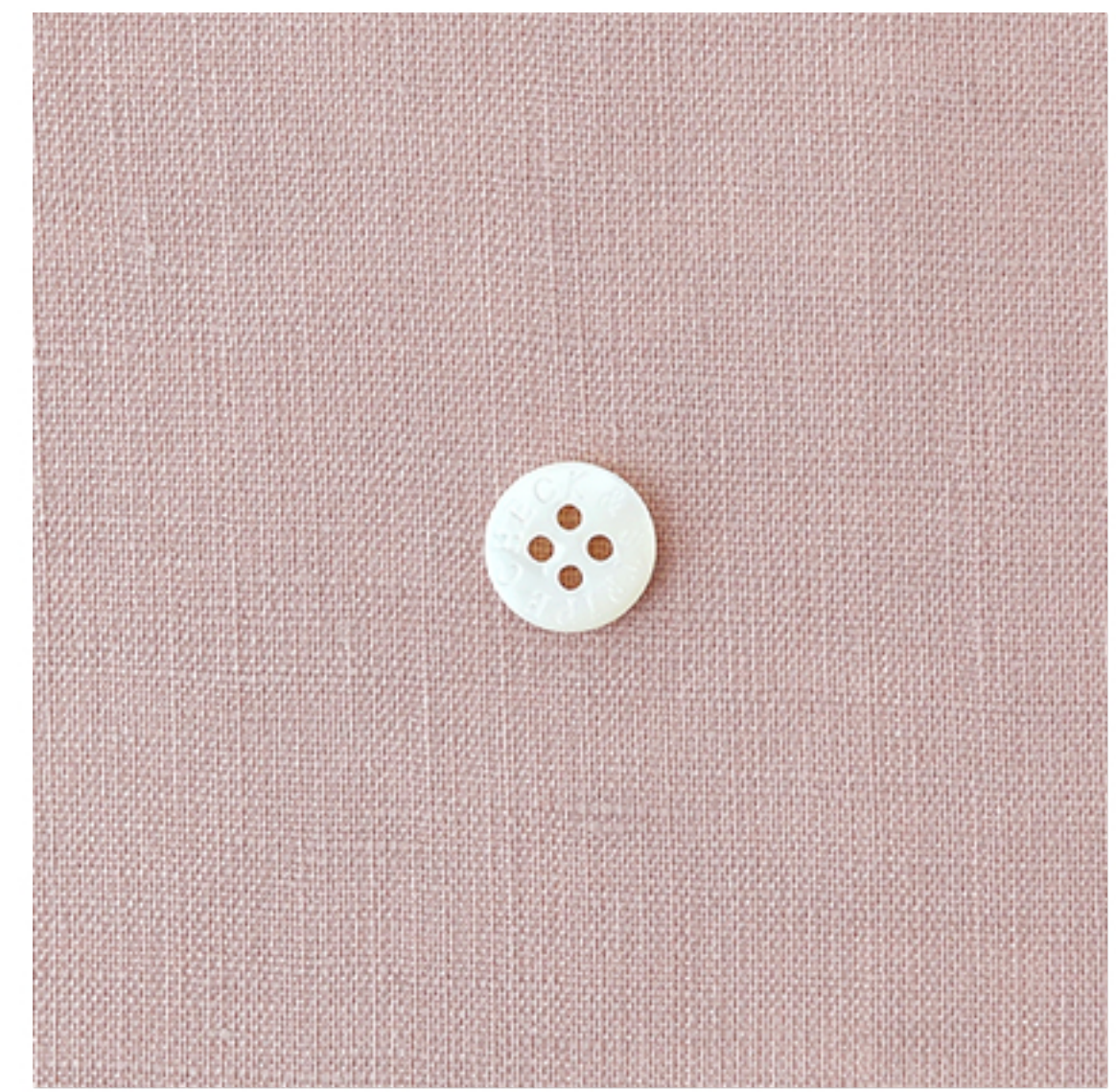
グレイッシュピンク