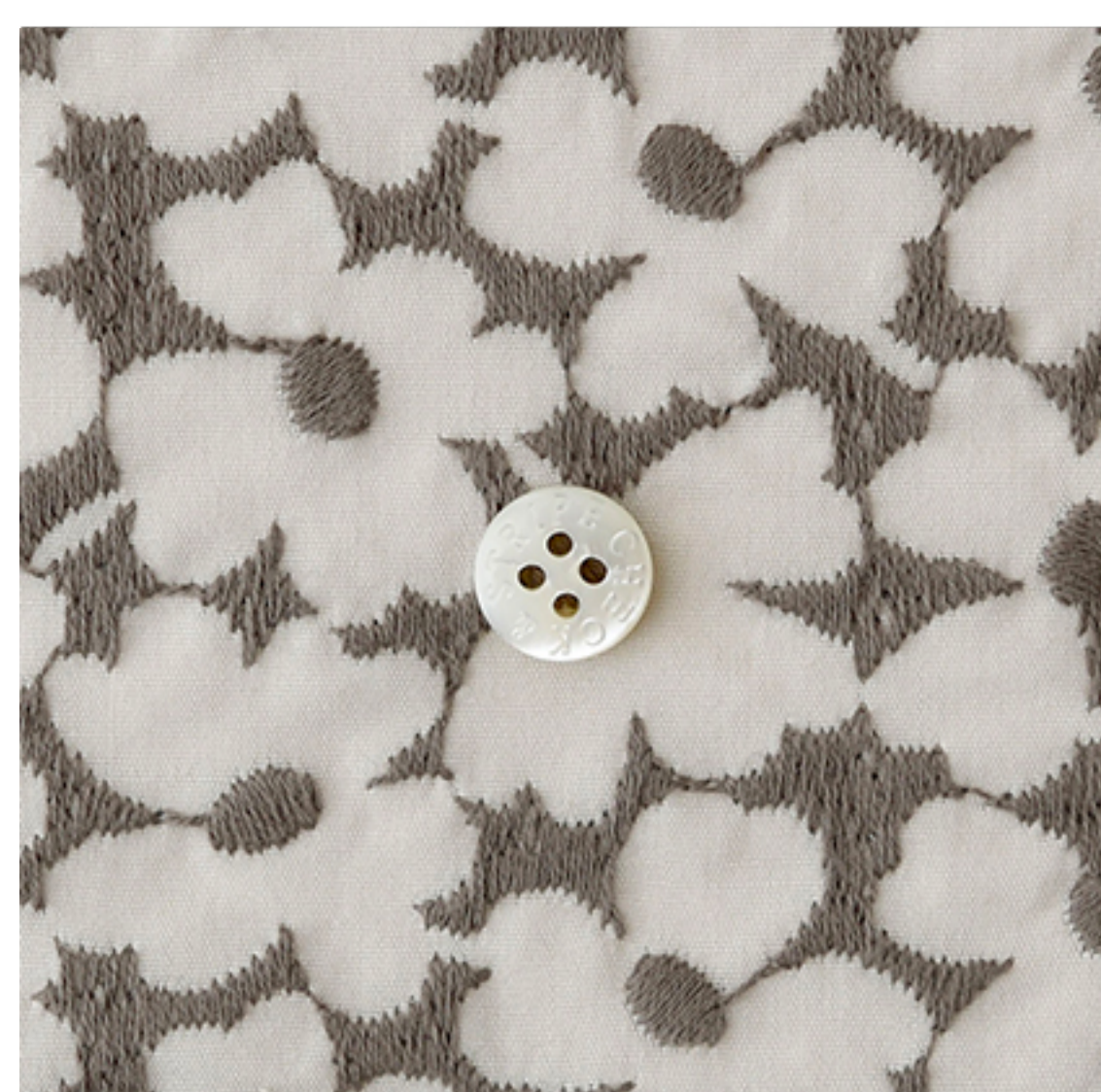
マッシュルームにダークグレー