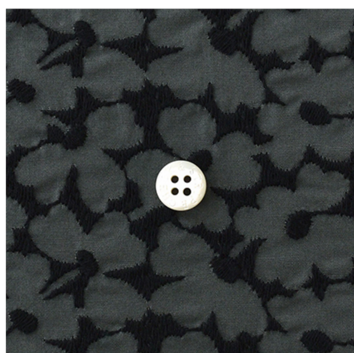
チャコールグレーにブラック