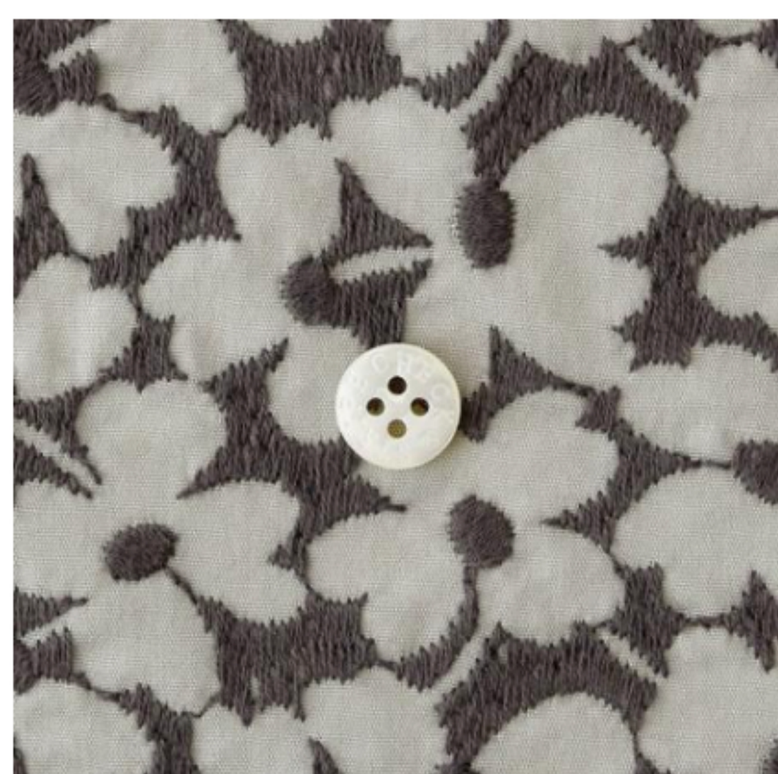
ストーンにスチールグレー