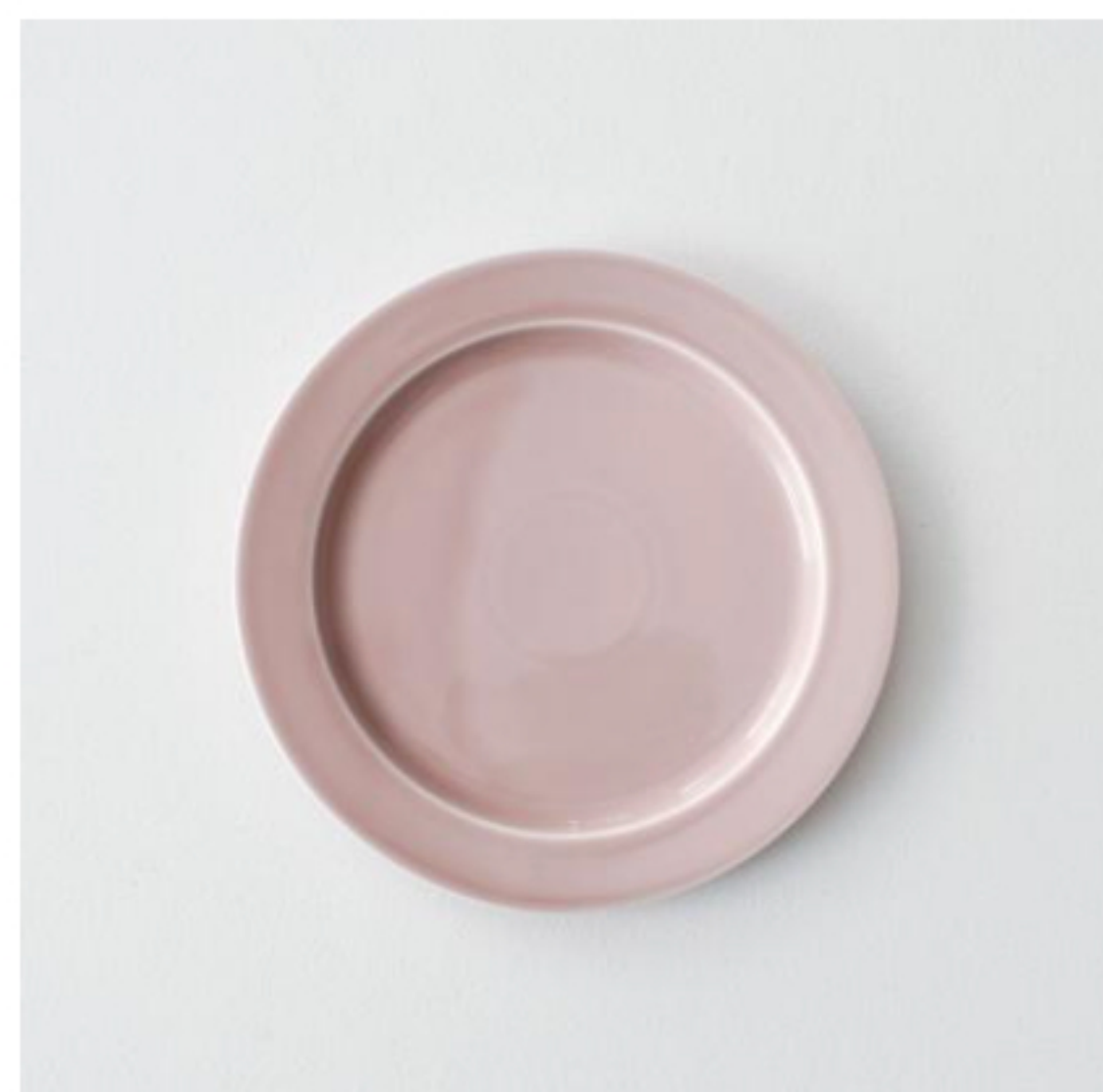
gôûter plate (plate S)