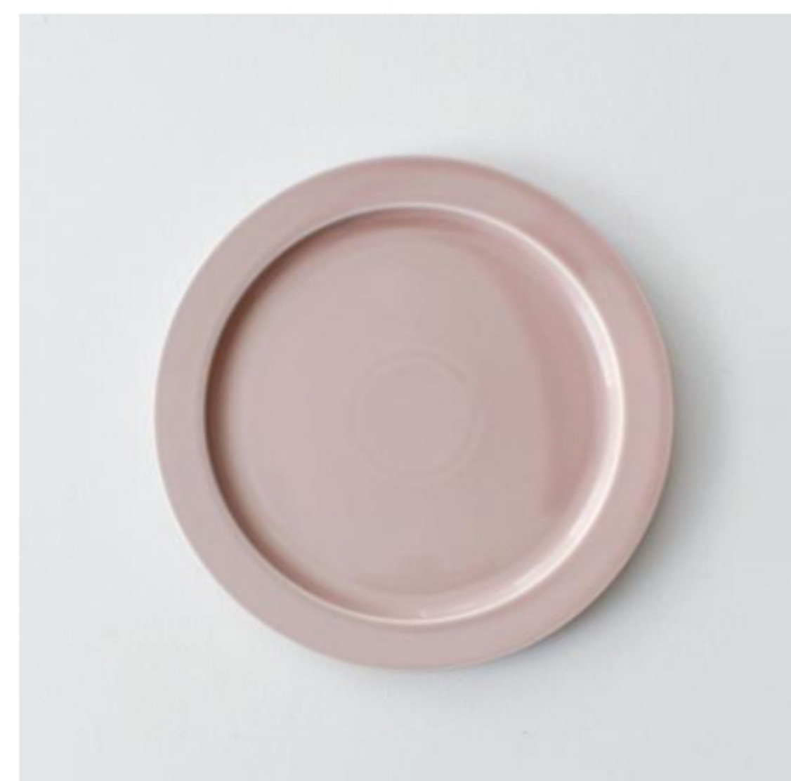
après midi plate 220