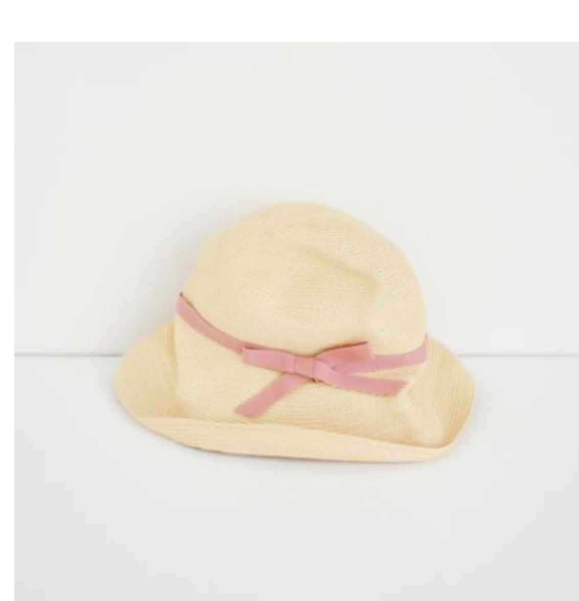
natural x pink