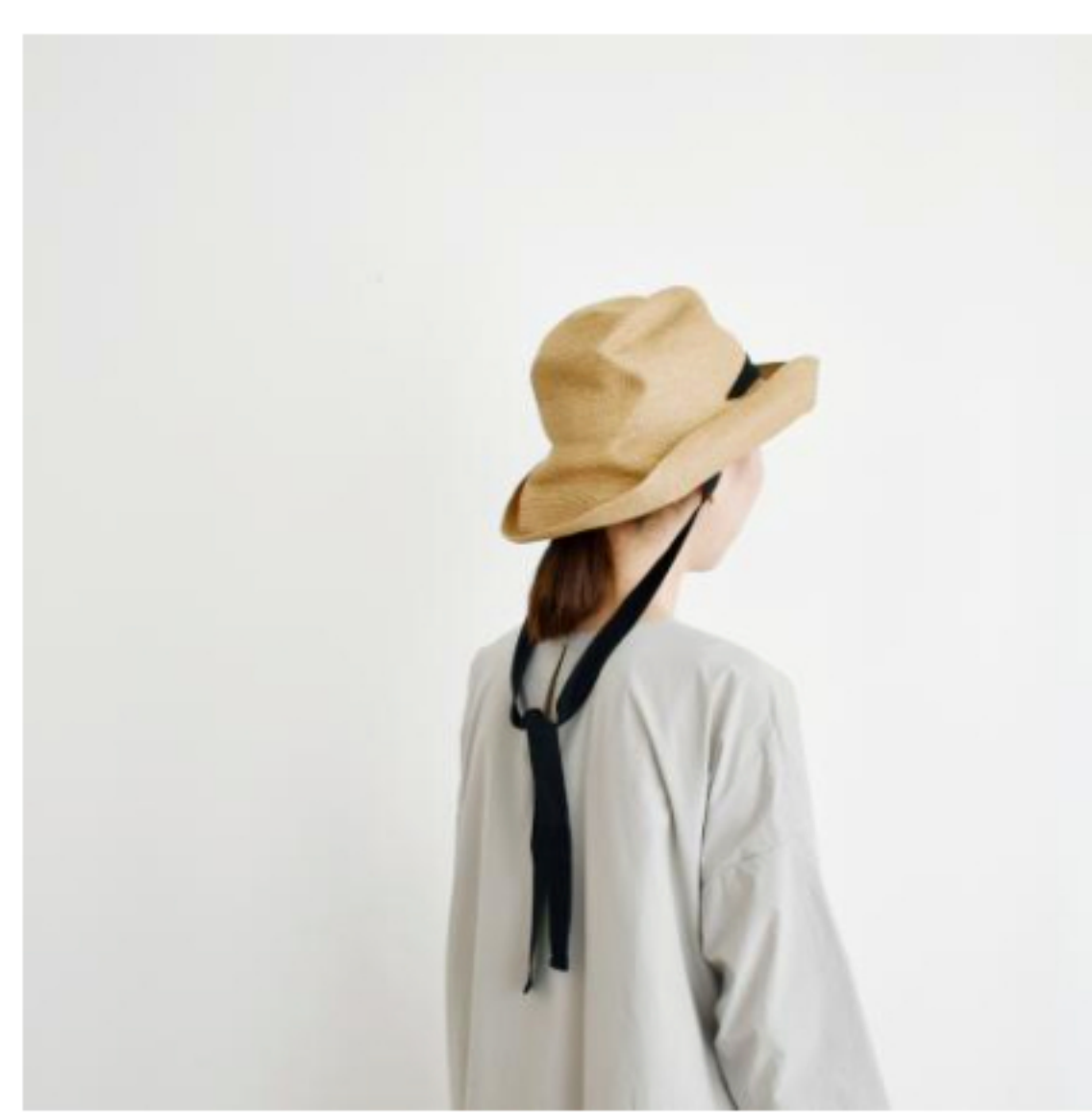
mix brown x black