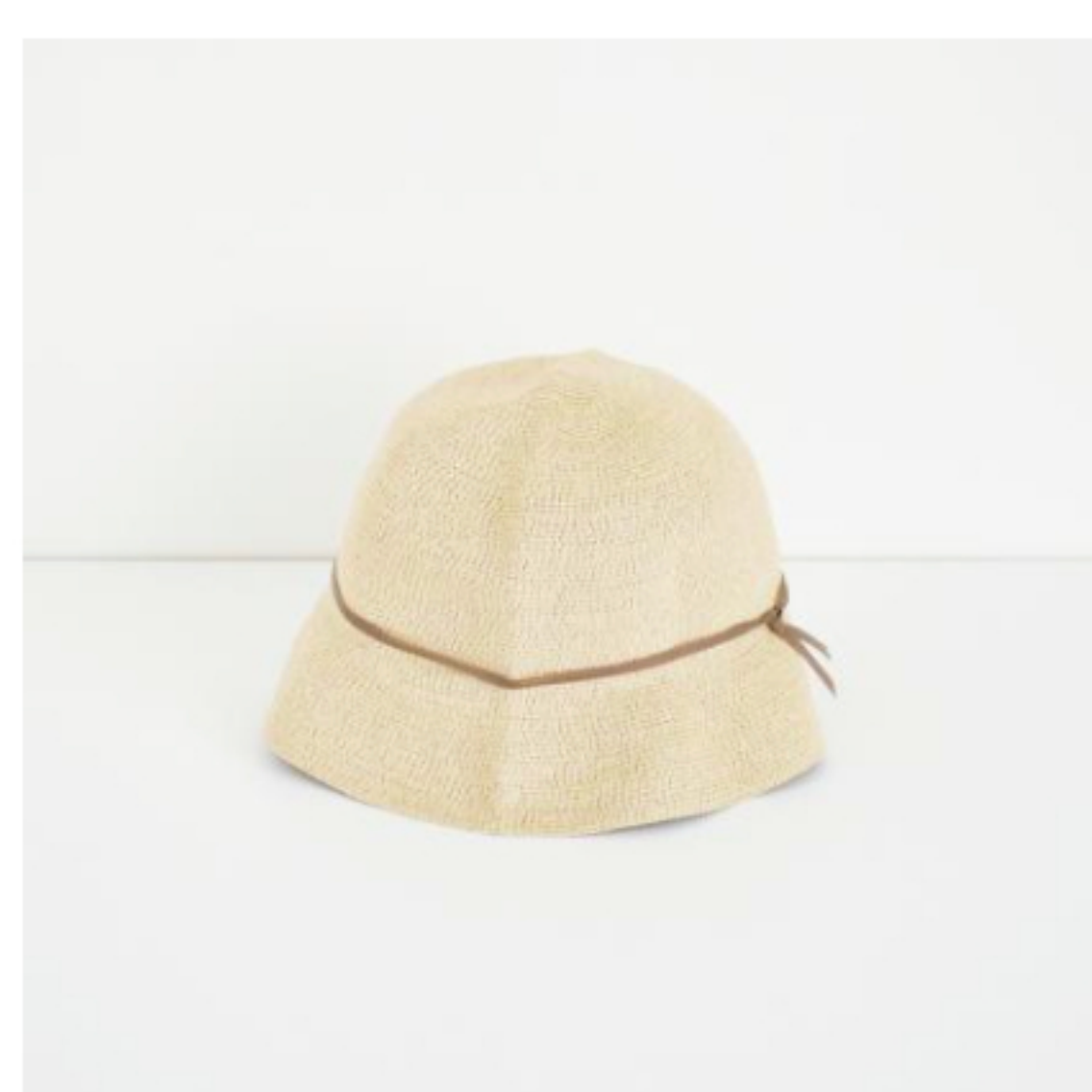
natural x light brown