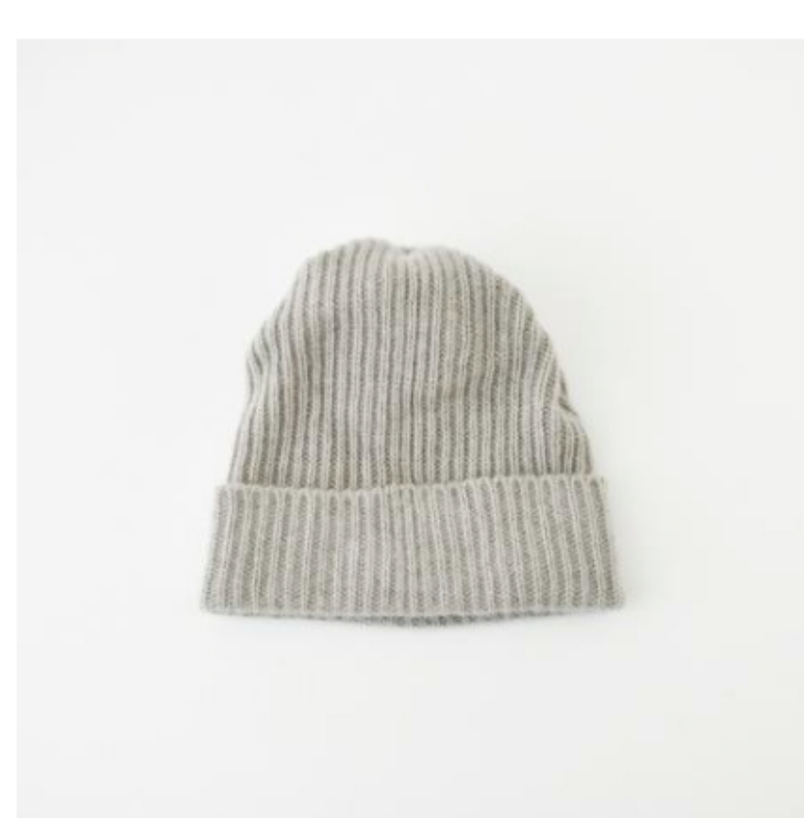
cashmere x sablelight greige