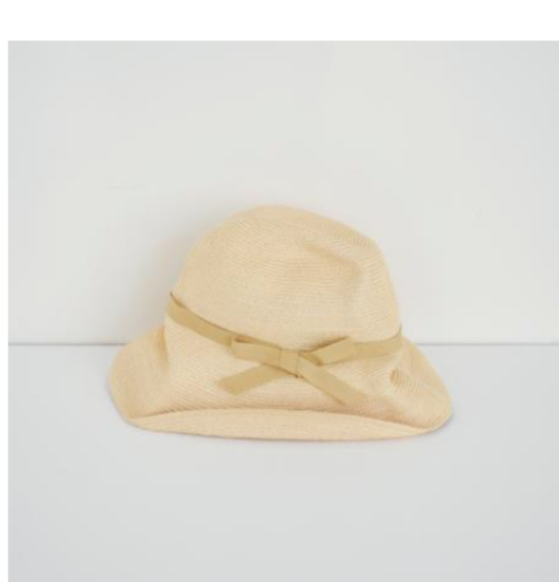
natural x wheat