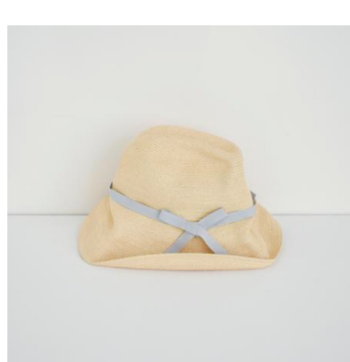
natural x light blue grey