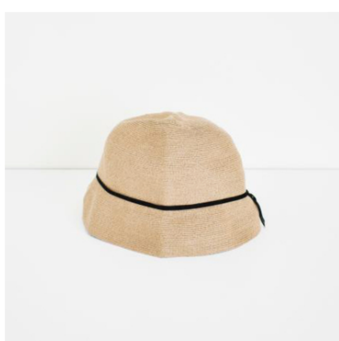
mix brown x black