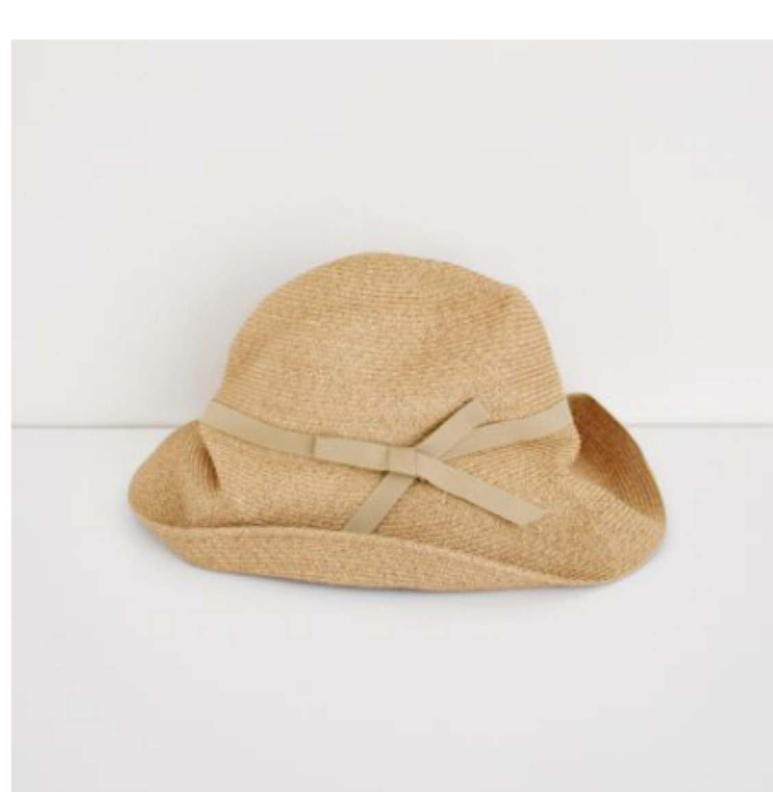
mix brown x beige