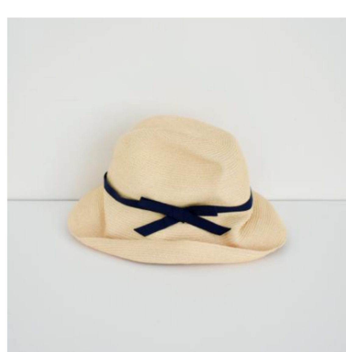
natural x navy