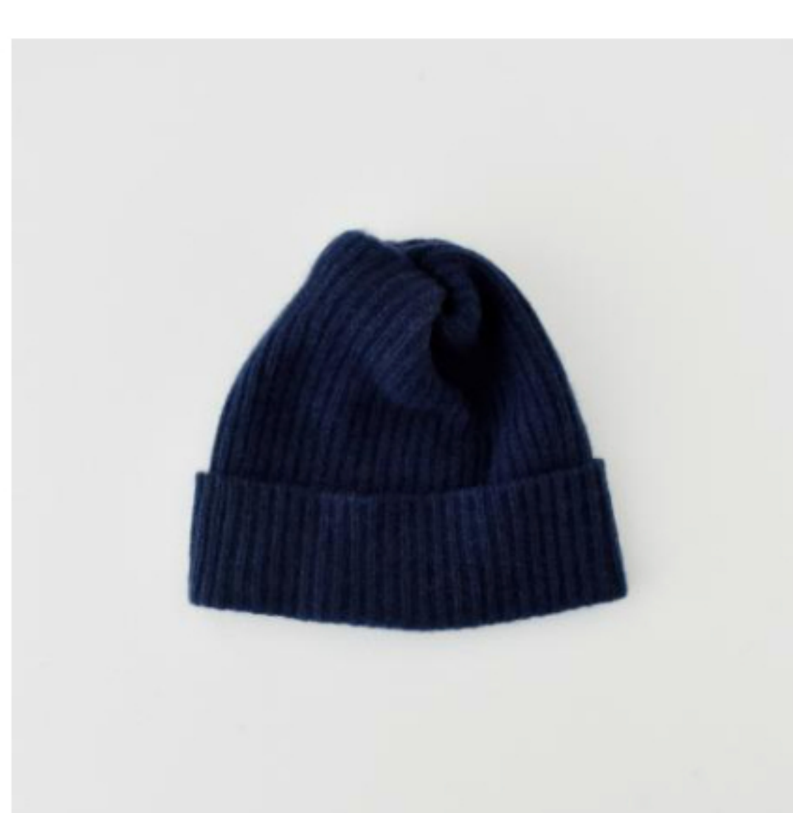
cashmere x sable indigo