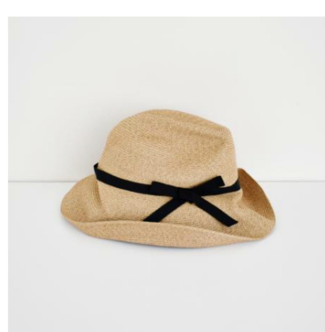
mix brown x black