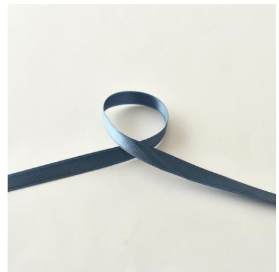
361(グレイッシュブルー)