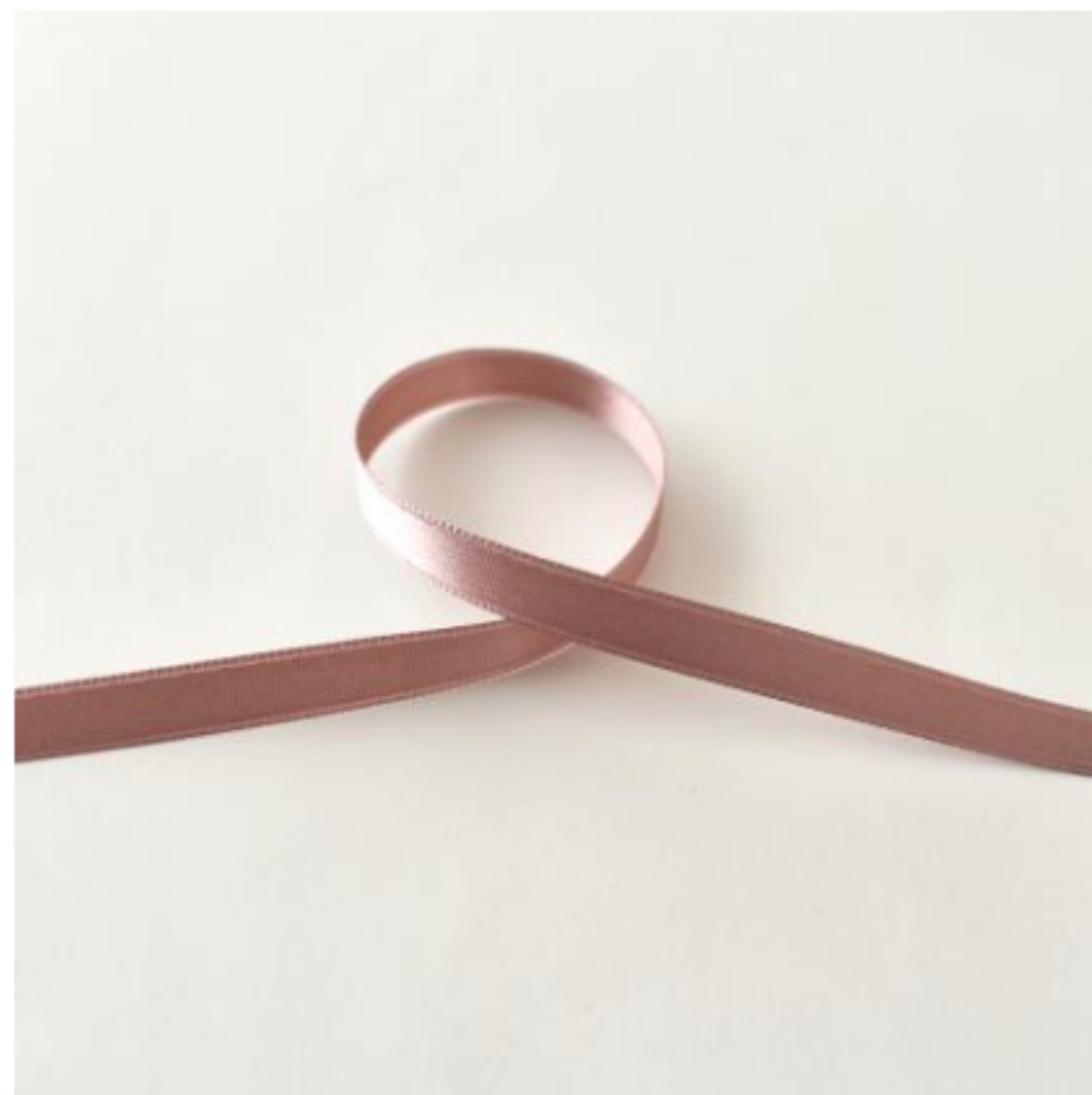
335(ピンクラベンダー)