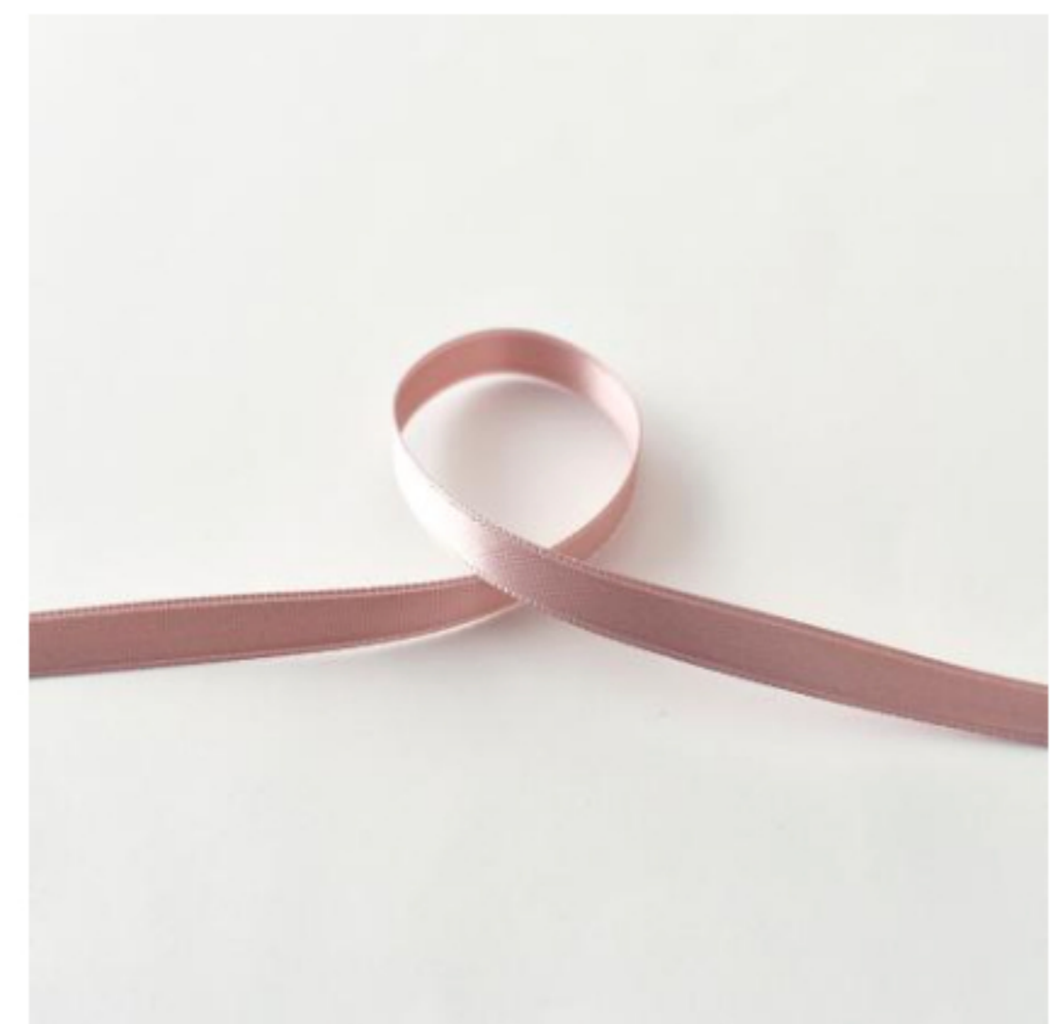
326(グレイッシュピンク)