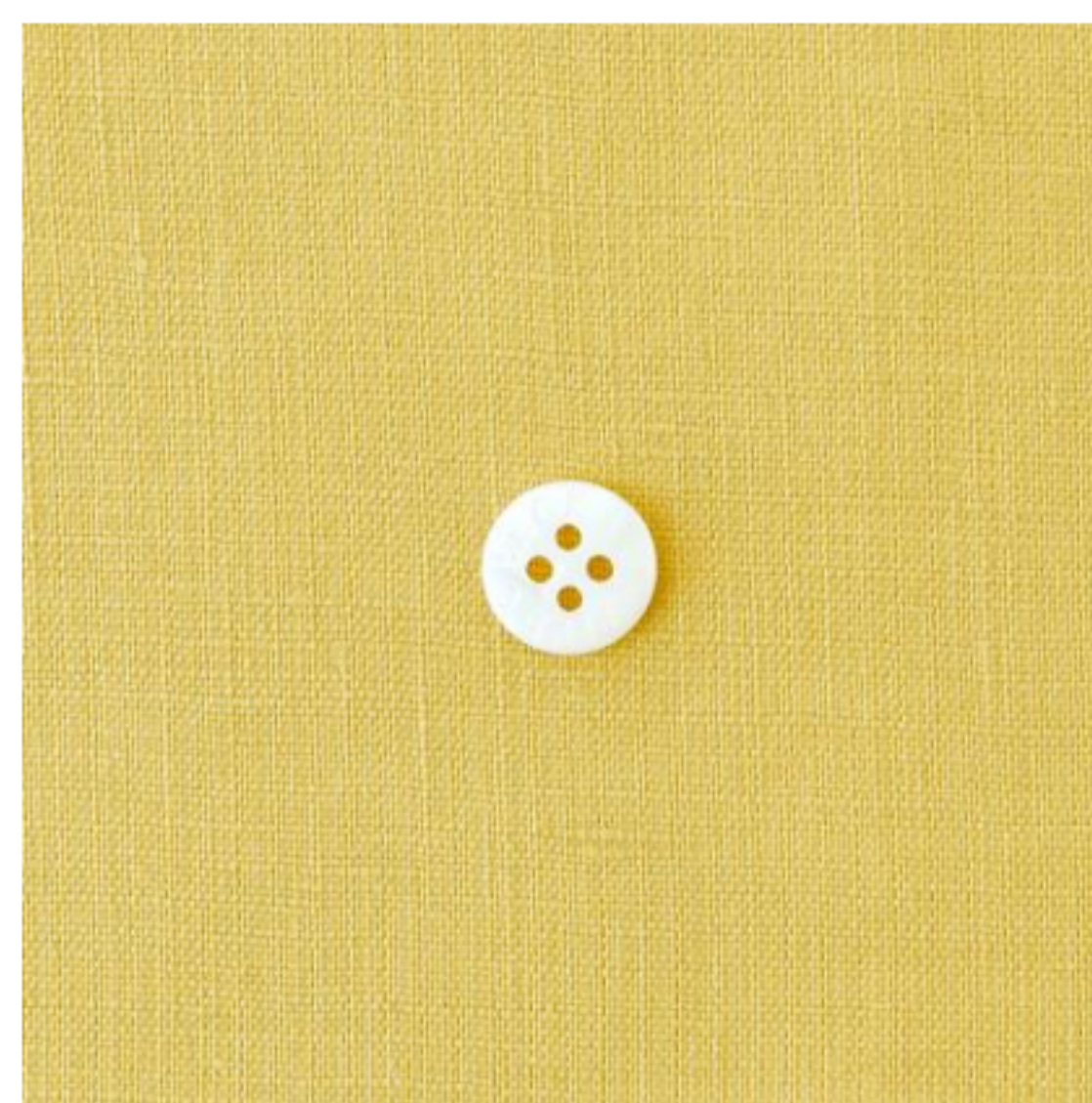
カナリーイエロー