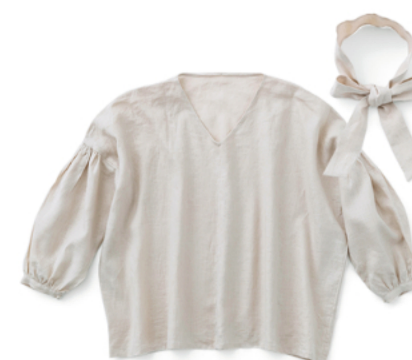
マッシュルーム:CHECK&STRIPEのおとな服『ソーイング・レメディ』(文化出版局) Vネックプルオーバー