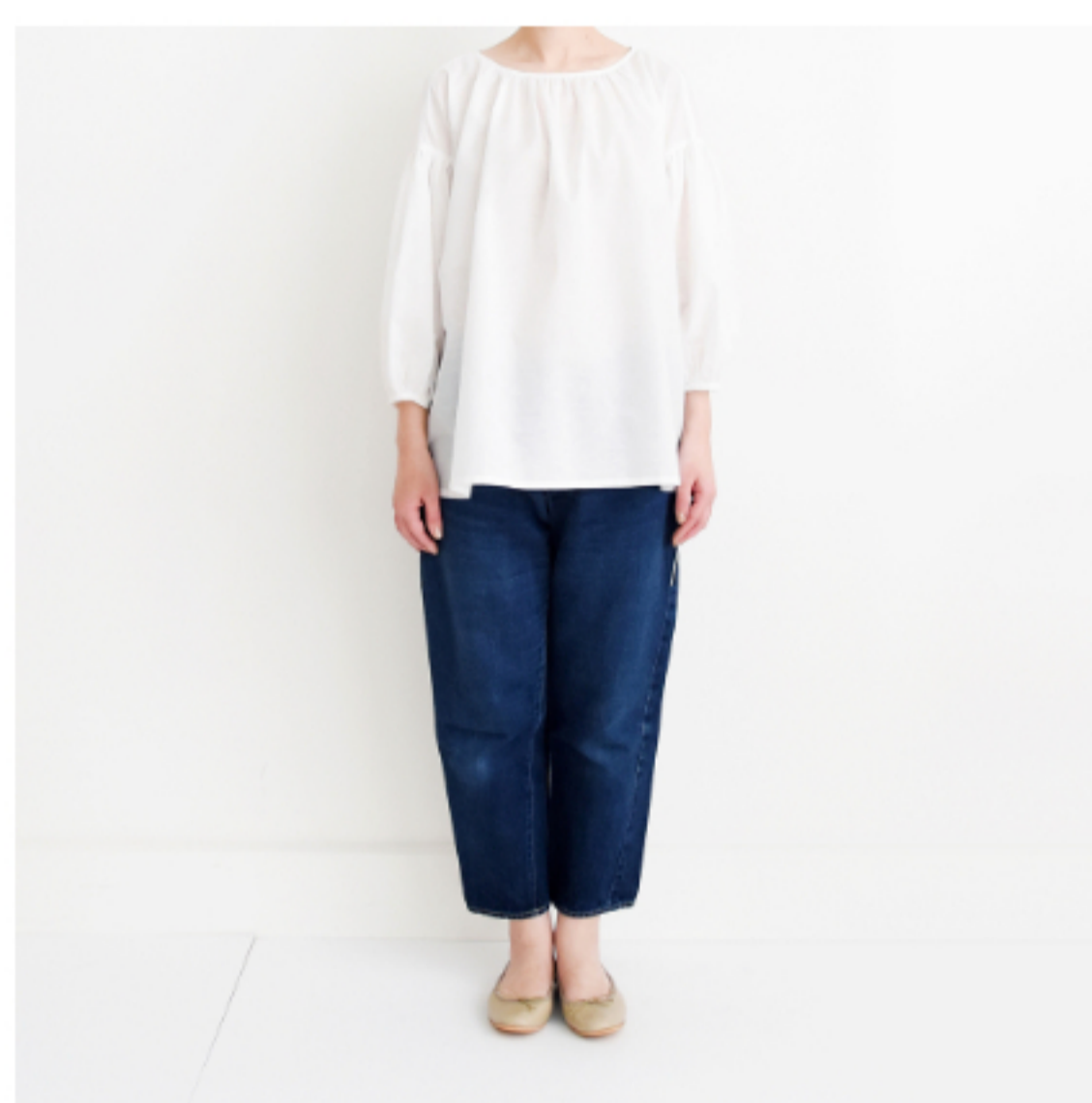
ホワイト:『CHECK&STRIPEのおとな服 ソーイング・レメディ―』(文化出版局) スタンダードギャザーブラウス