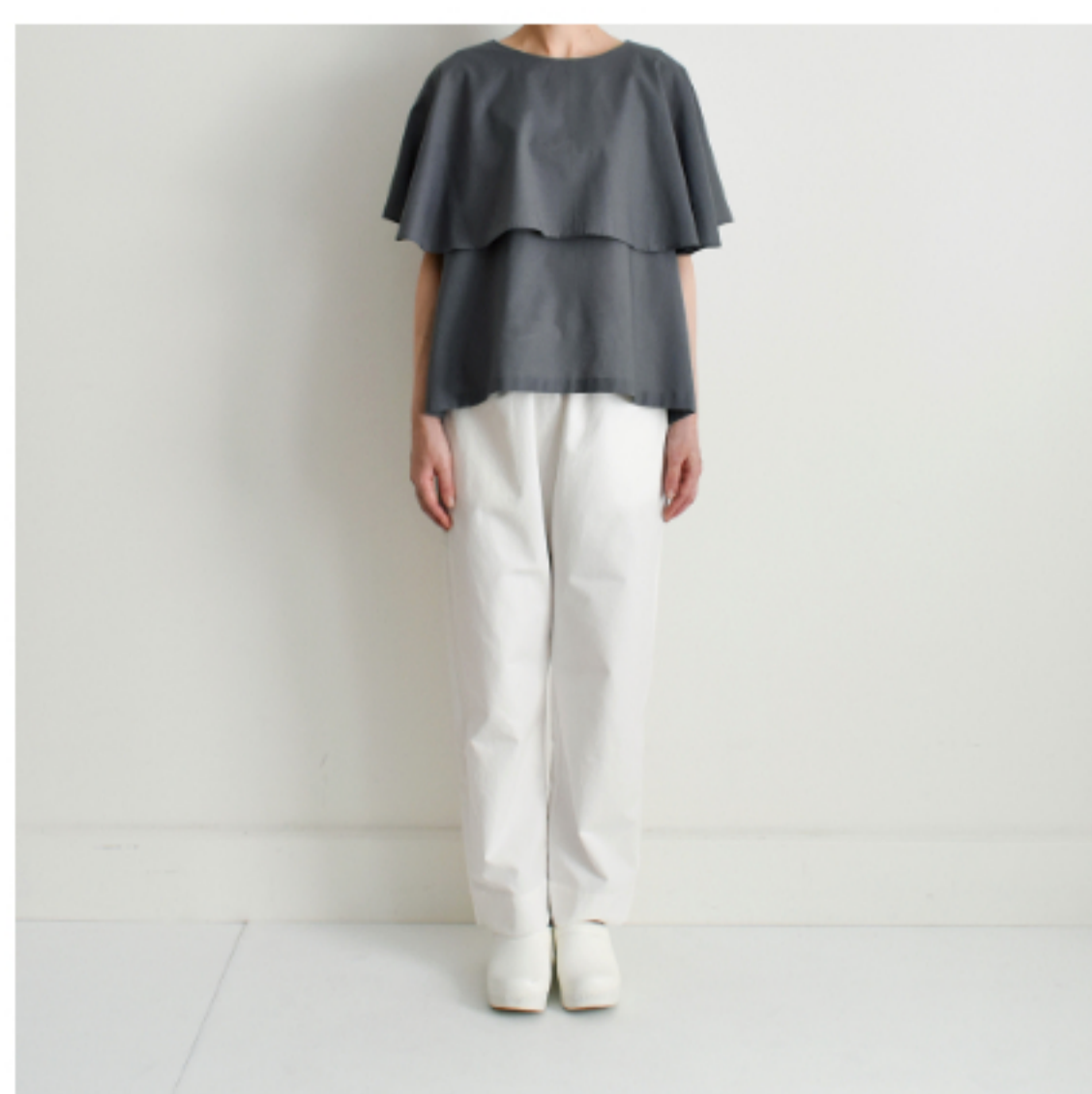
グレー:『CHECK&STRIPE my favorite 私の好きな服』(主婦と生活社) ケープブラウス