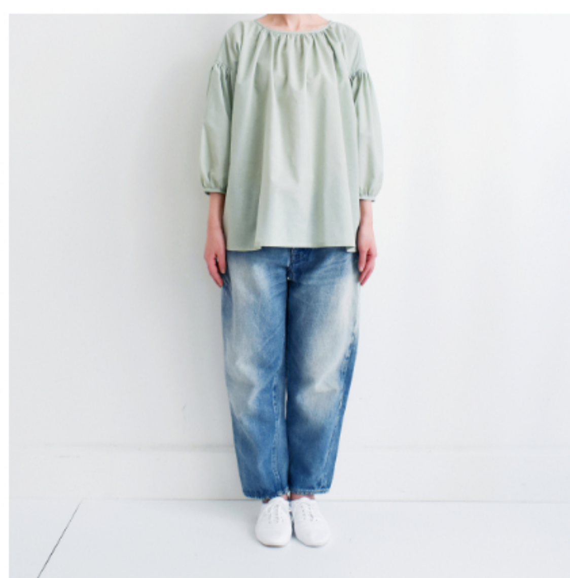
ミンティー:『CHECK&STRIPEのおとな服 ソーイング・レメディ―』(文化出版局) スタンダードギャザーブラウス