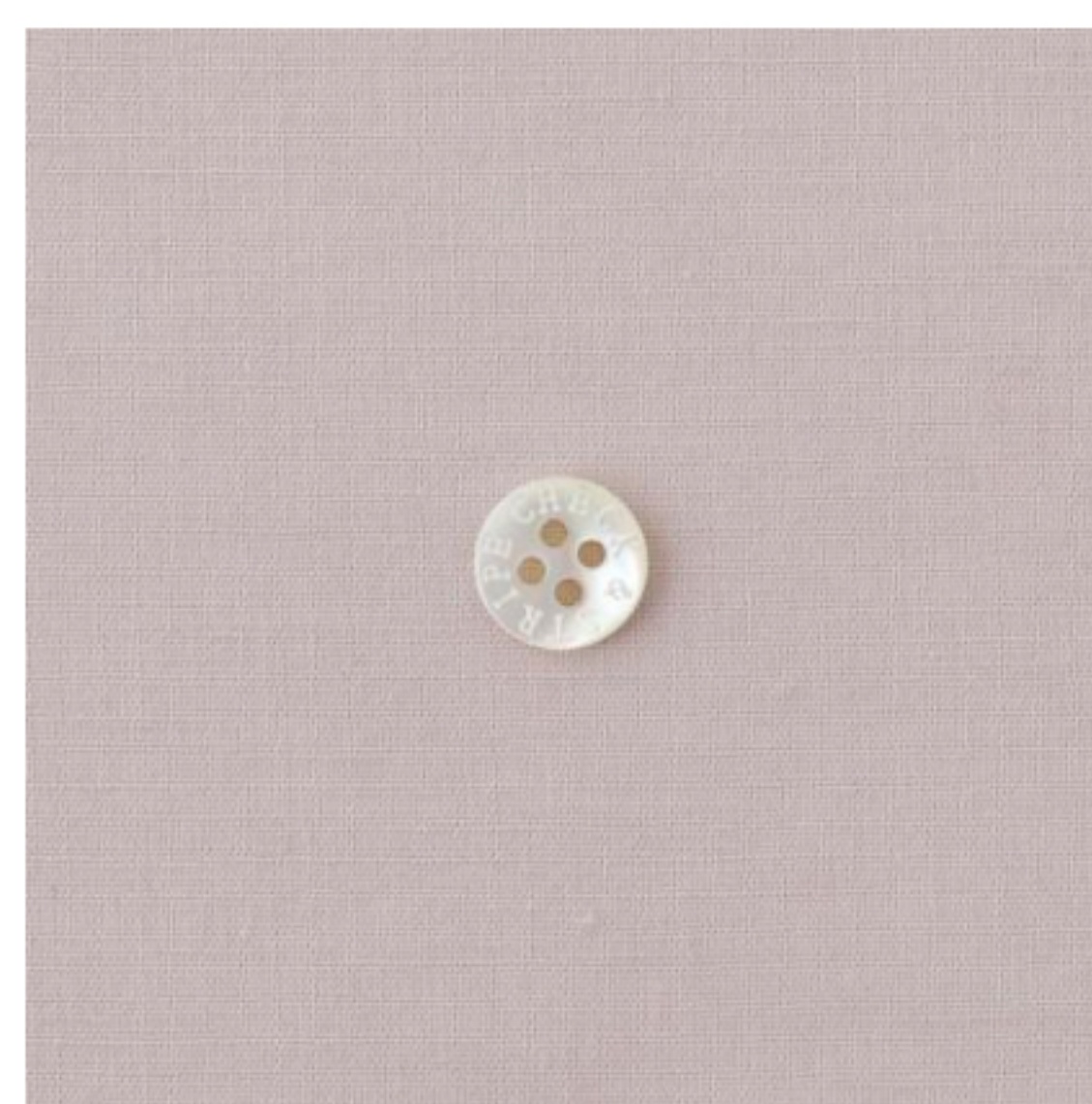
グレイッシュピンク