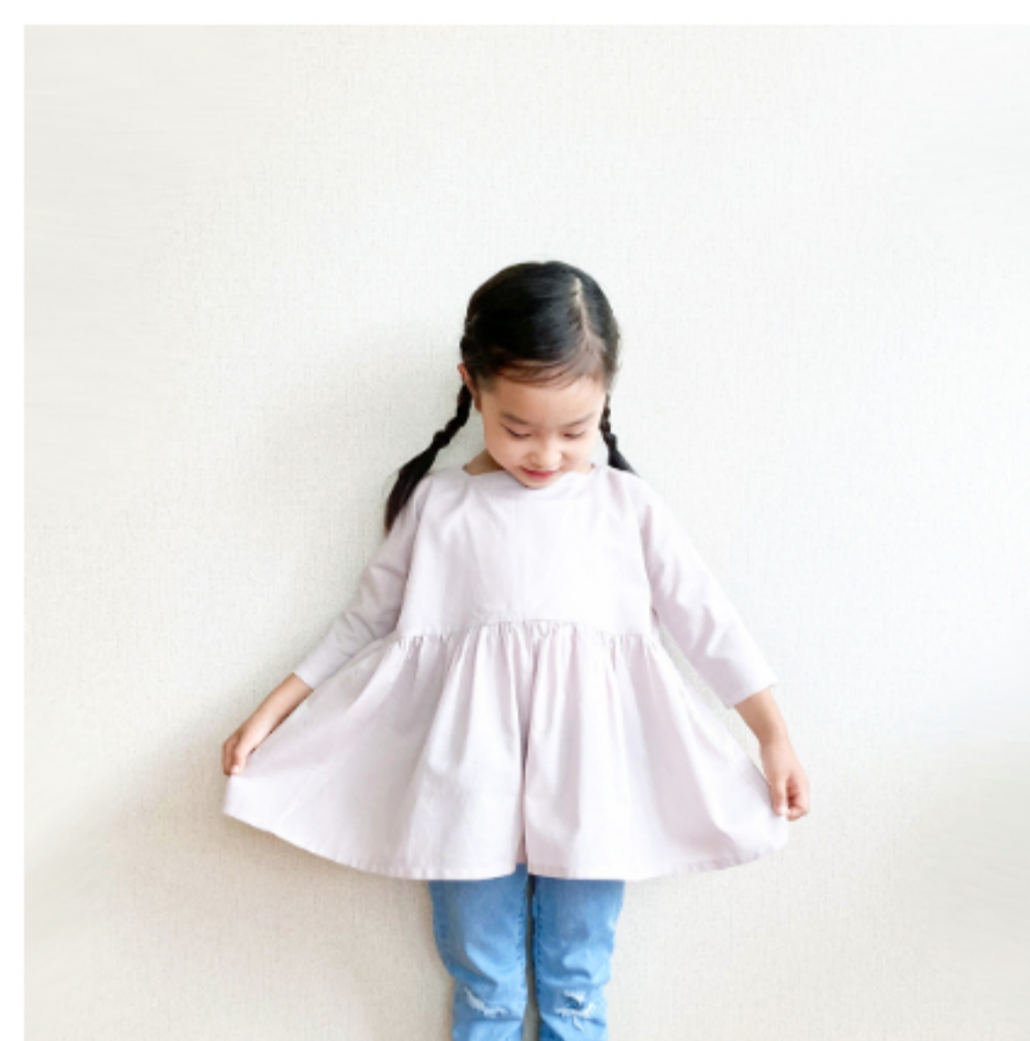
グレイッシュピンク: 『CHECK&STRIPEの子ども服 ソーイング・ナーサリー』(文化出版局) スクエアネックのギャザーブラウス