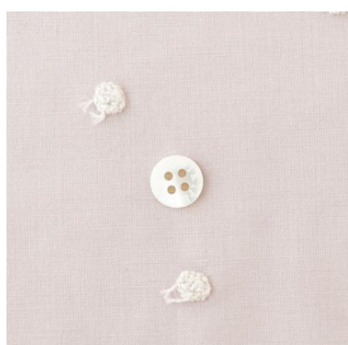
グレイッシュピンクにシェルホワイト