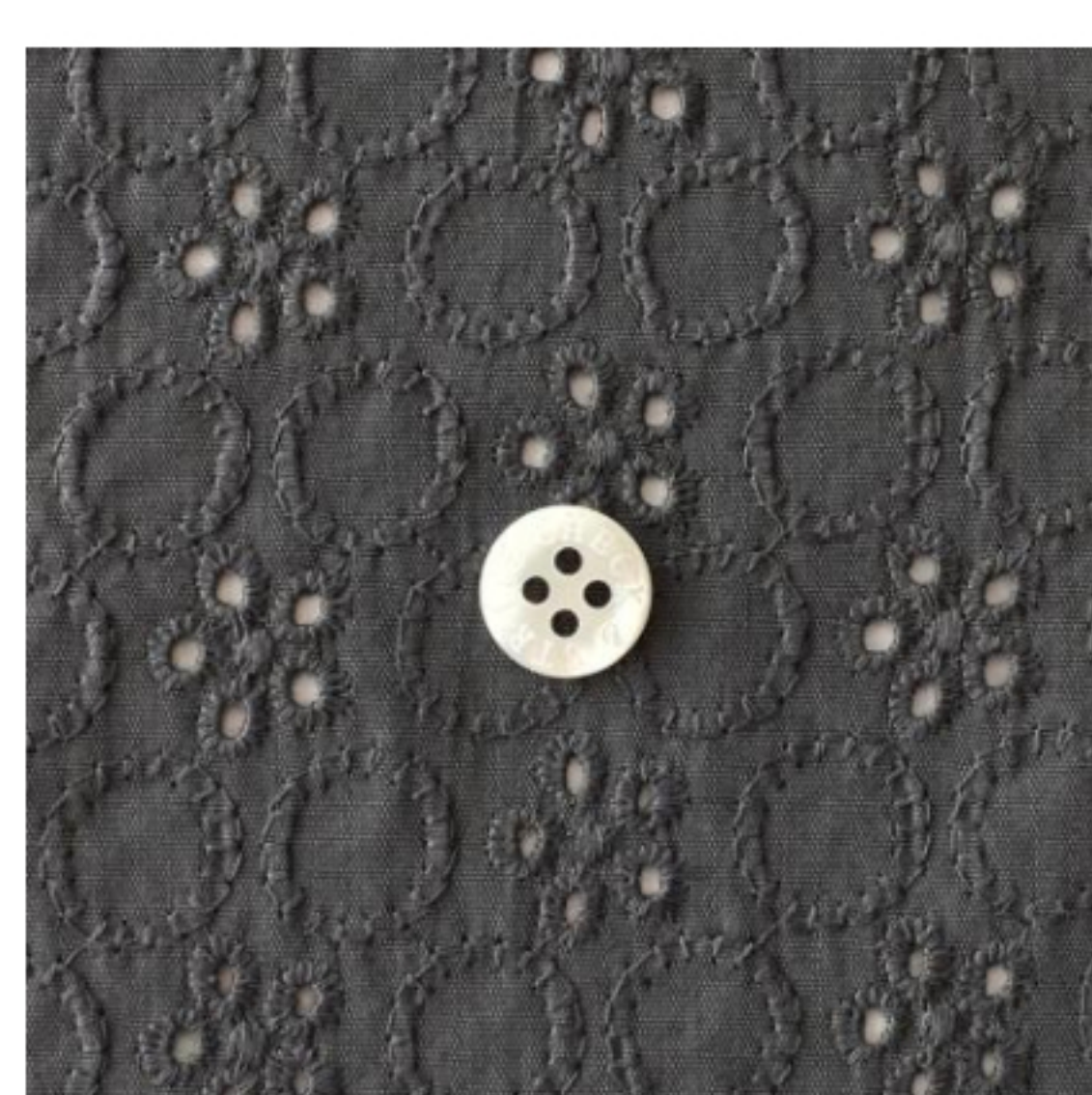
チャコールグレー